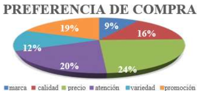
Figura 1. Preferencia de compra