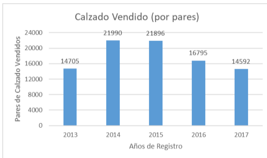
Figura N° 1: Calzado Vendido en "Calzado Reinozo" (por pares)