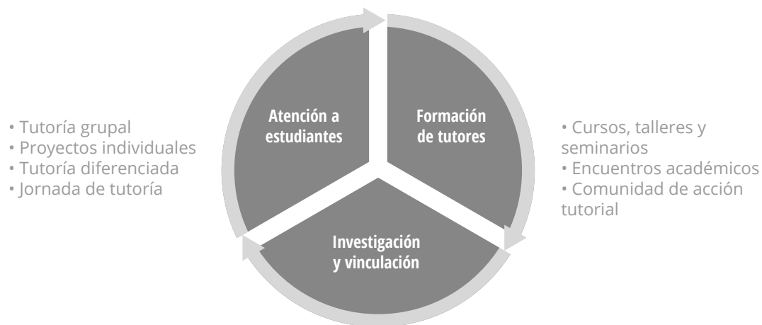
Figura 2. Líneas de acción del PIT-BENM