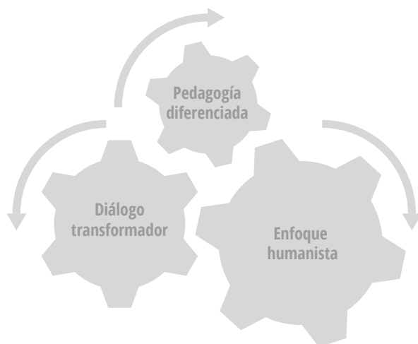
Figura 1. Ejes transversales del proyecto de tutoría de la BENM

En consecuencia, la tutoría requiere el reconocimiento de las condiciones de vida personal y académica y de los factores externos que inciden en el aprendizaje. De la Cruz Flores (2017) menciona que la relevancia de la tutoría en la educación superior contemporánea también se justifica cuando se analiza la heterogeneidad de los perfiles de los estudiantes (amplia gama de edades, orígenes sociales, formación, habilidades e incluso expectativas sobre la educación superior). Por ello, la tutoría puede ser un mecanismo útil para personalizar y diversificar los procesos de aprendizaje. En este sentido, el modelo de tutoría que se utiliza en la BENM gira en torno a tres ejes transversales que sustentan las acciones que se implementan: enfoque humanista, diálogo transformador y pedagogía diferenciada. En estos ahondaremos en los siguientes párrafos.