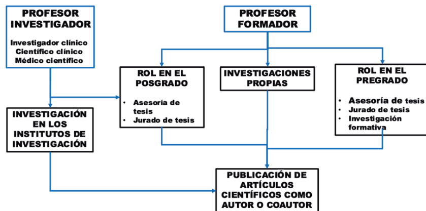
Figura 3. Rol de los profesores universitarios en la investigación en las escuelas de las ciencias de la salud

Por consiguiente, ser un docente en una escuela de ciencias de la salud en el siglo XXI requiere un conjunto de habilidades y competencias docentes, clínicas e investigativas que las aplica desde la formación del profesional en el pregrado, pasando por el asesoramiento en proyectos de investigación, hasta la realización de investigaciones propias. El rol del profesor es fundamental para avanzar y difundir conocimiento en su campo.