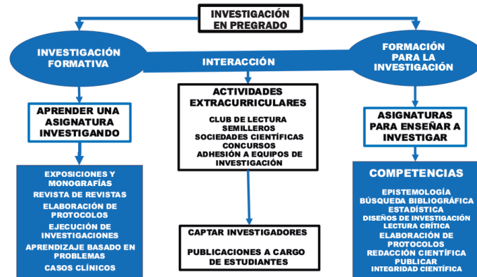
Figura 1. Enseñanza de la investigación en el pregrado de una escuela de las ciencias de la salud. Se presentan el objetivo y las estrategias de la investigación formativa, el objetivo y las competencias que los alumnos deben adquirir en la formación para la investigación y las actividades extracurriculares que se pueden desarrollar en el ámbito de la investigación y su objetivo.