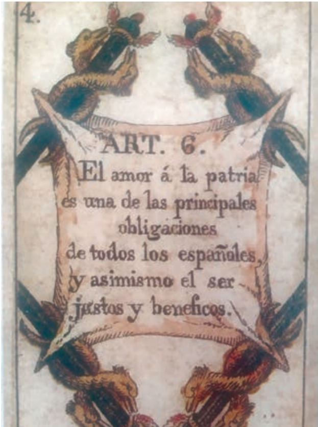
El artículo 6 de la Constitución española de 1812 plasmado en una carta de la baraja de la Constitución de Cádiz.