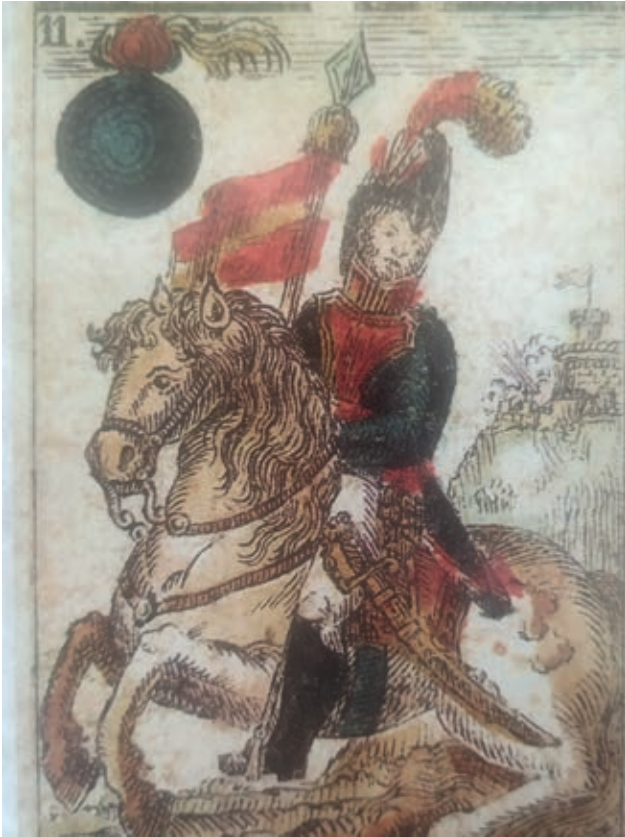
Arco Agüero representado en la baraja de la Constitución de Cádiz.

importancia al levantamiento murciano que la historiografía no le ha reconocido después.