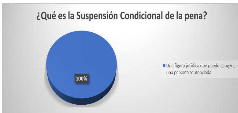
Figura 1. Suspensión condicional. Elaboración: Los autores.

1. ¿Qué es la suspensión condicional de la pena?