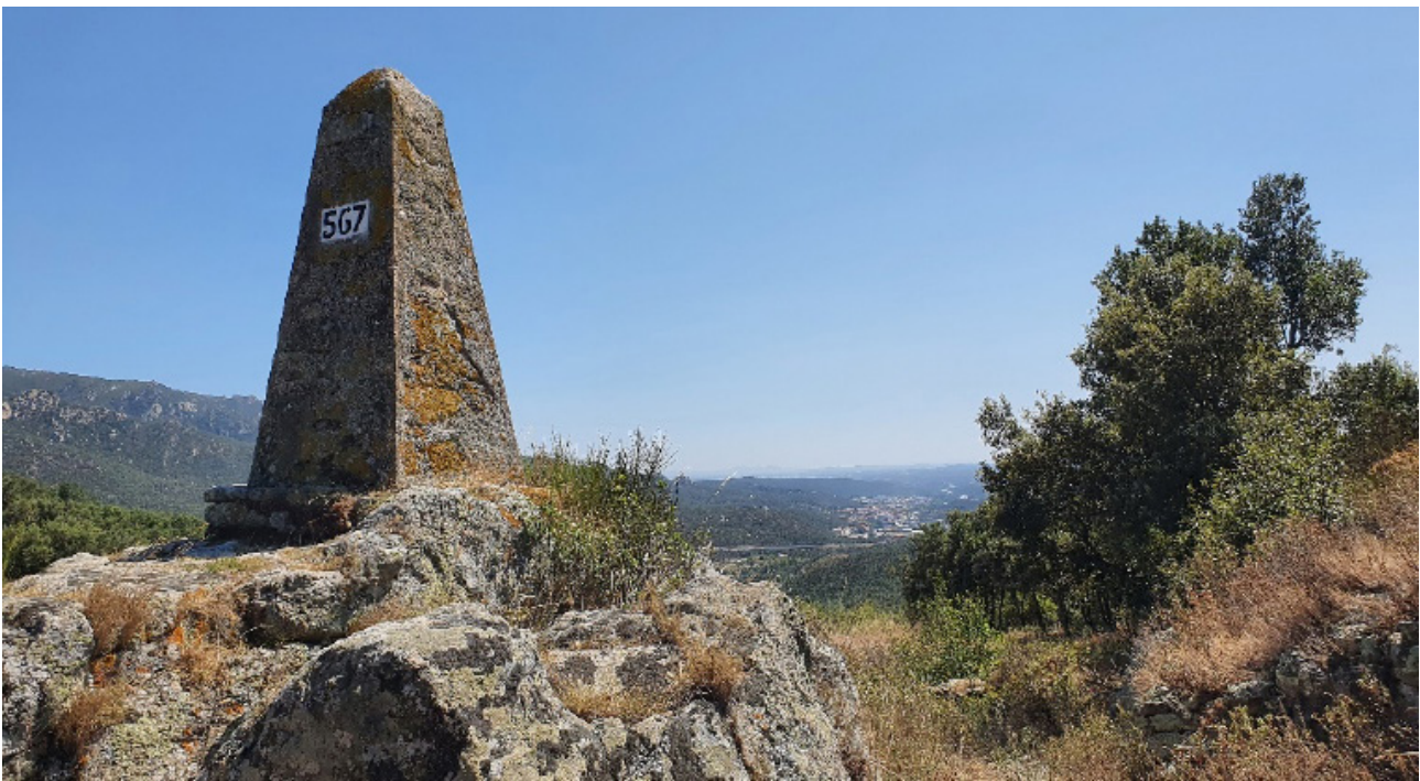
Fita fronterera al coll de Panissars