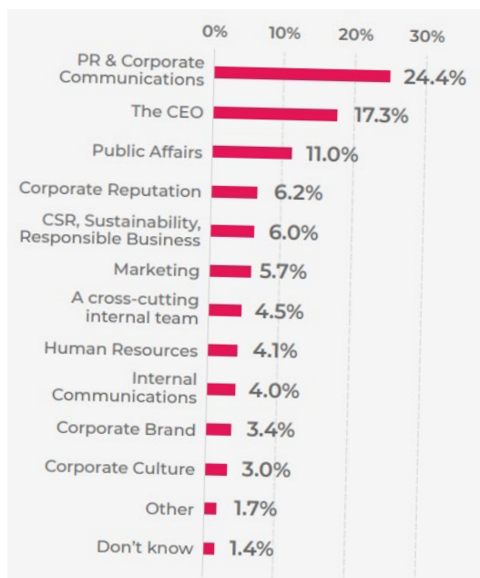
Figura 3. Who leads the corporate reputation?