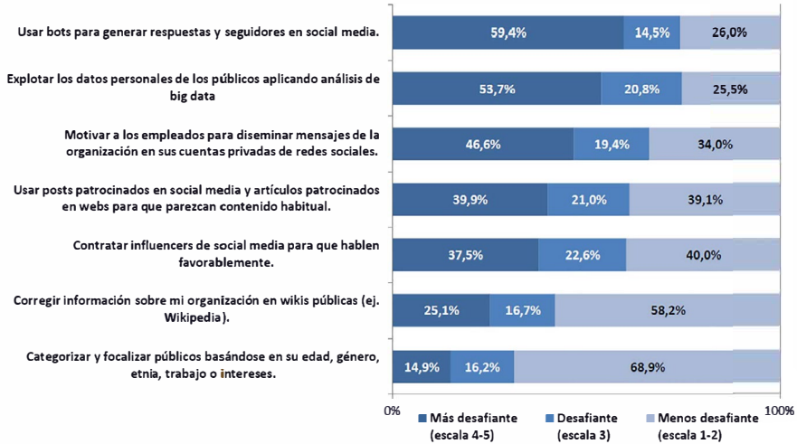
Figura 2. Tres de cada cinco profesionales están preocupados por el uso de bots y análisis de big data