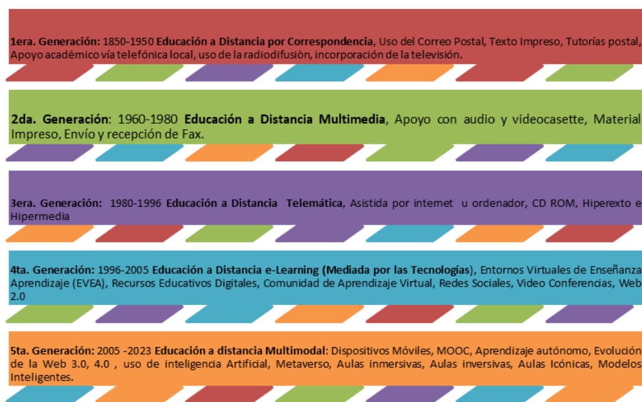
Gráfico 1. Inspirado en la evolución de la EaD.

Ahora bien, analizando los conceptos, quiero resumir en este esquema cómo la evolución de la Educación a distancia ha transitado y con ella su concepción, para que hoy día sea llamada Multimodal: