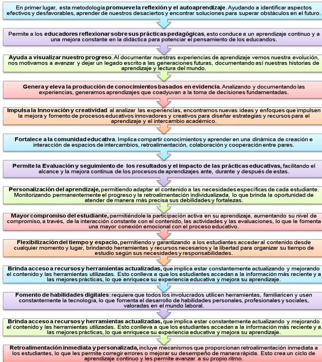
Gráfico 2. Beneficios de la Sistematización de Experiencia por Compromiso.