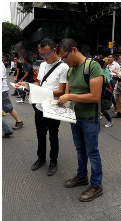
Ilustración 8. 26 junio 2016.