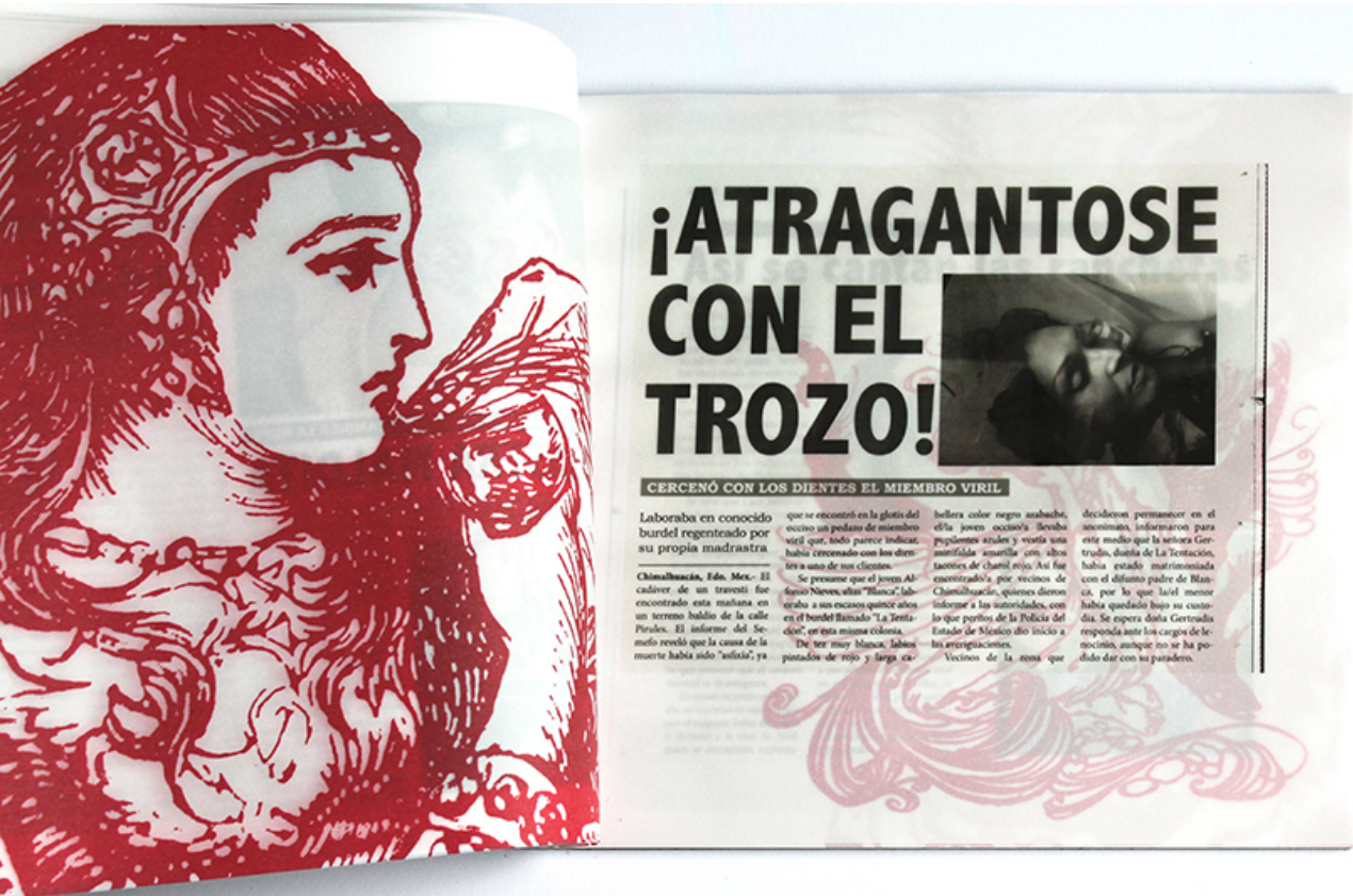
Ilustración 4. Autor Ave Barrera y Lola Horner. 2015. Blog Libro abierto (Ave Barrera).