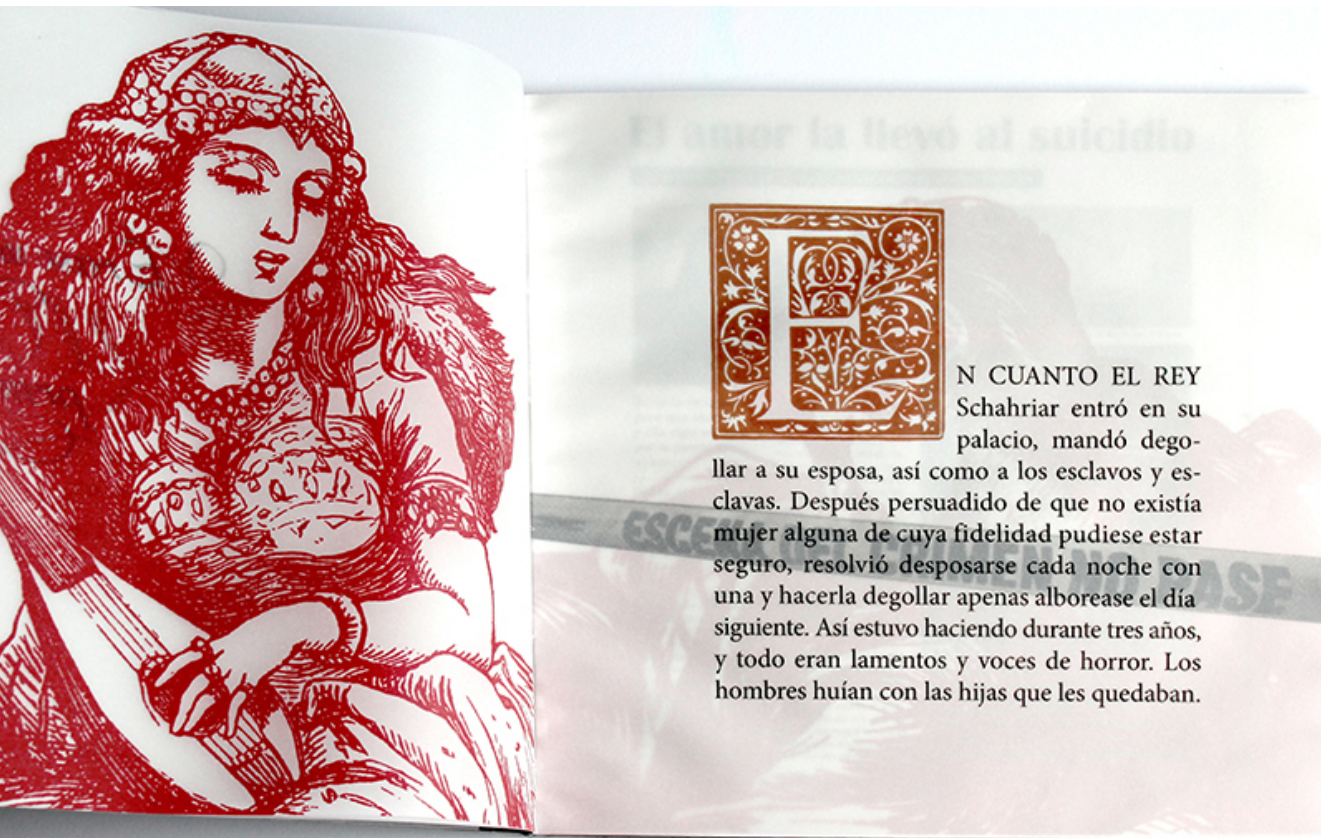
Ilustración 2. Autor Ave Barrera y Lola Horner. 2015. Blog Libro abierto (Ave Barrera).