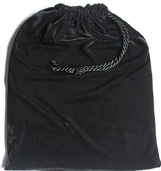
Ilustración 1. Autor Ave Barrera y Lola Horner. 2015. Blog Libro abierto (Ave Barrera). Fuente: https://avebarrera.wordpress.com/2018/11/07/21000-princesas/#jp-carousel-279

La producción técnica de este libro, va de lo analógico a lo digital: serigrafía, impresión offset, collage y fotomontaje sobre papel de algodón y albanene, pero al estilo de un libro ilustrado, que dispone de un saco de terciopelo a manera de contenedor que conceptualiza según sus autoras, la bolsa en la que se depositaba una cabeza decapitada enviada a los reyes en la Edad Media (Imagen 1). El texto inicial ostenta una letra capital ornamentada que versa así: