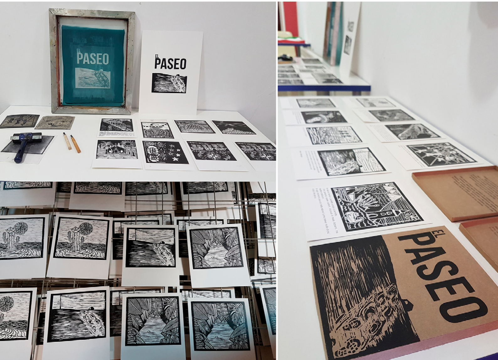
Ilustración 1. Libro «El Paseo», fotografía Marta Aguilar Moreno (2016)

Se parte de la premisa “el paseo” entendida ésta como acción y metáfora y se inicia el taller de dos semanas de duración, pero se amplía a tres para consumarlo. El libro arte se concluye con una edición de veinte ejemplares con nueve paseos tan variopintos como sus creadores, con ilustraciones en linografía y su correspondiente texto serigrafiado a una sola tinta, en portugués, catalán, gallego, italiano y castellano; presentado en un estuche de cartón con la portada también serigrafiada.