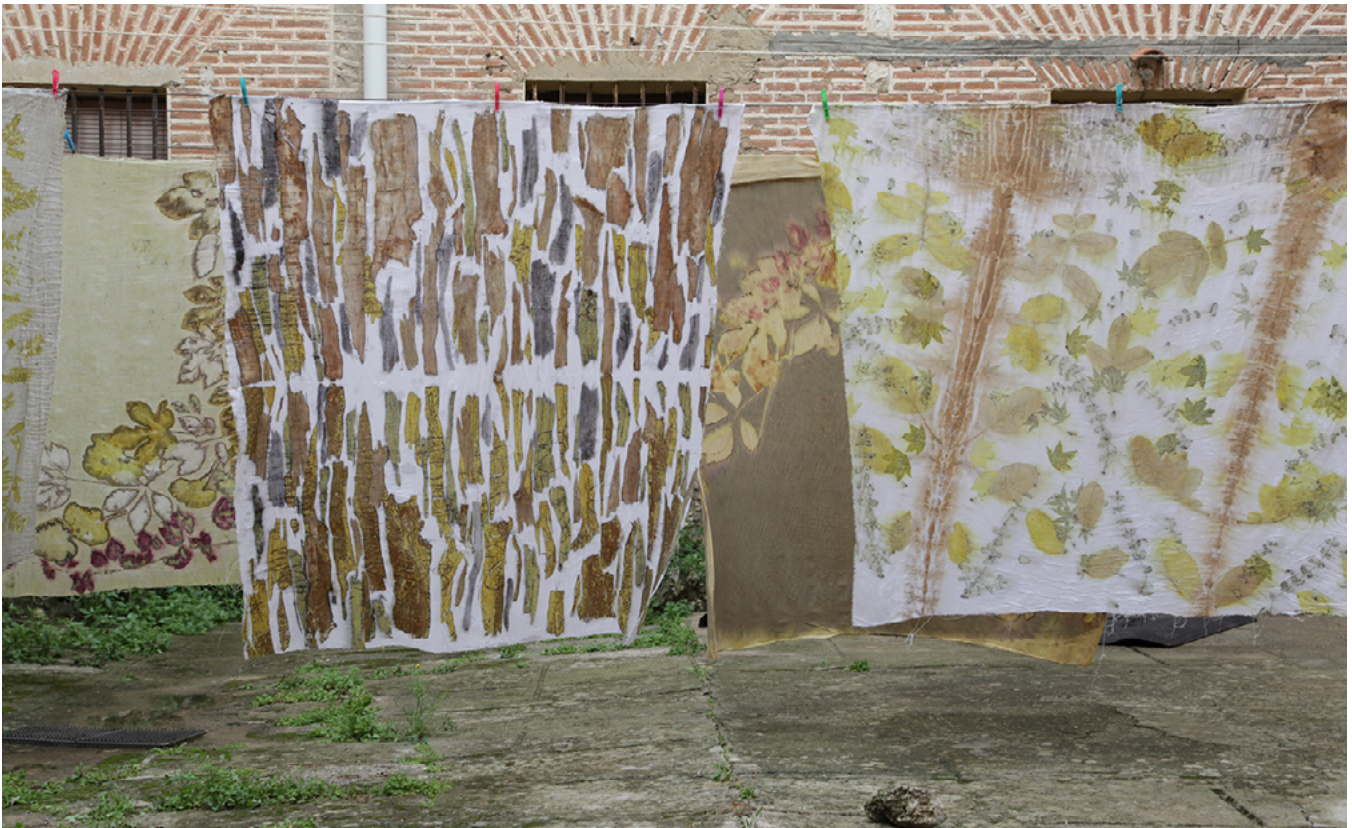
Tejidos estampados