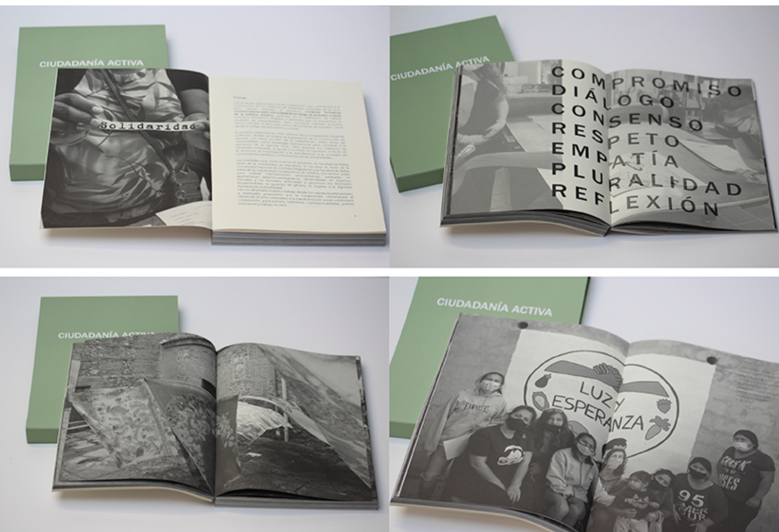
Ilustración 4. Libro «Ciudadanía Activa. Tres proyectos de integración a través del libro arte», fotografía Marta Aguilar Moreno (2022).