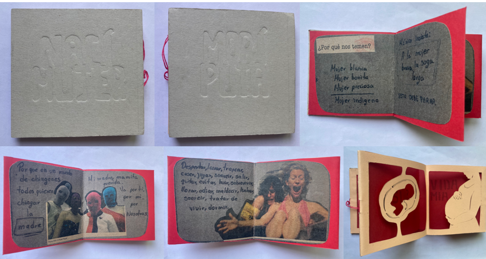
Figura 6. Serie de imágenes del libro-arte Nací Mujer / Morí Puta de Casandra Romero, 2017.

que provoca que las letras o elementos queden hundidos en la superficie. Esto crea un efecto de relieve negativo, ya que las áreas alrededor de las letras son elevadas y las propias letras están hundidas. Las letras no tienen color alguno, se mantiene natural al cartón gris grueso seleccionado por la artista, la composición es centrada, cuadrada, en caja alta y con un tracking e interlineado apretado que permite la lectura a pesar de la unión. La obra no solo tiene escritura en relieve, también tiene quirografía en su interior que lo vuelve más personal, al ser un libro de tipo carrusel y concertina en uno de sus lados expresa perspectivas feministas de la artista y problemas por los que pasa una mujer en territorio mexicano, justificando la muerte por ser una puta, por vestir de manera inapropiada, por buscárselo. Los textos quirográficos se apoyan del collage y de imágenes simbólicas para la mujer elaboradas en cut-out como un óvulo, un feto, un vientre, una virgen guadalupana, un sello feminista, que a su vez dejan ver a través del fondo carrusel otros textos, sumando constantemente a la interacción texto-imagen del lector.