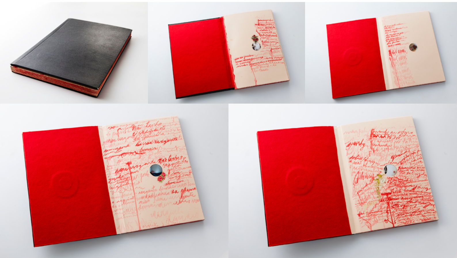
Figura 2. Serie de imágenes del libro-arte Fragmentos de un corpo amoroso, Silva Livia, 2013.

con calcomanías e imágenes de revistas y escritura con tinta china, un inventario de los senos femeninos que contempla su existencia en cuerpos orgánicos y también plásticos, en mujeres y también en mujeres transgénero. Intercalando escritura poética con páginas mudas, donde sólo se impone la imagen, es posible una pausa necesaria para un mejor disfrute de la obra. El predominio del rojo en el fieltro y la tinta, que fluye en placeres y tristezas, evoca simultáneamente la condición más básica de la existencia, la sangre; así como los estados de ánimo cambiantes de los cuerpos en la experiencia. La obra de Silva agrega dimensión estética y expresiva mediante el color rojo que va perdiendo opacidad, así como con la yuxtaposición y dirección de las palabras, la artista prolonga intencionalmente algunas colas y descendentes de la anatomía natural de ciertas letra para evocar a la sangre, a lo líquido y la gravedad del goteo. La presencia constante de ligaduras y cursividad refuerza la idea del flujo sanguíneo, el tono piel de la página por otro lado refuerza la idea de cuerpo que vive y sangra a partir de las letras.