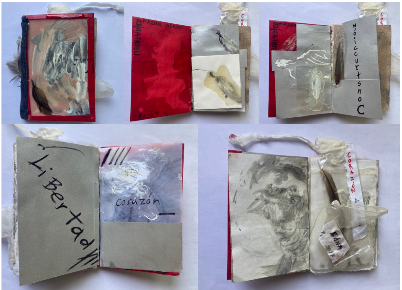
Figura 5. Serie de imágenes del libro-arte Corazón Alado de Edna Cantoral, 2017.

La escritura en relieve en un libro-arte es una técnica que implica la creación de texto o letras en relieve, es decir, elevadas o sobresalientes del material base en el que se está trabajando. Esta técnica agrega una dimensión táctil y visual a las palabras escritas, permitiendo a los lectores o espectadores experimentar el texto de una manera más sensorial y artística. La escritura en relieve se puede lograr a través de varias técnicas y materiales, y su aplicación puede