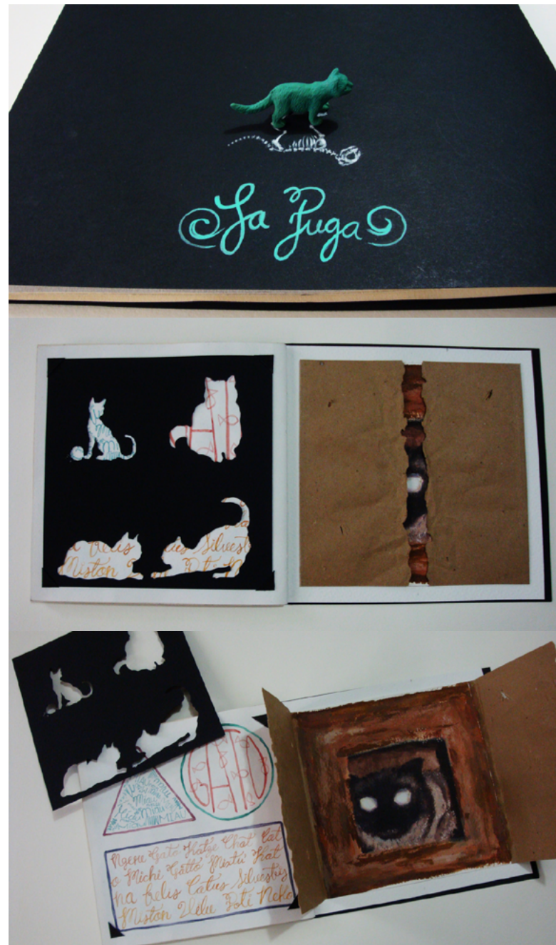
Figura 4. Serie de imágenes del libro-arte Felis Silvestris Catus , Alejandra Puga, 2013.

La escritura gestual en el libro-arte es una forma de expresión que implica la creación de texto mediante trazos libres y espontáneos, a menudo realizados de manera rápida y sin una preocupación excesiva por la legibilidad o la forma tradicional de las letras. Esta técnica se basa en la idea de capturar el movimiento y la energía en la escritura, transmitiendo emociones y sensaciones a través de las formas y los gestos