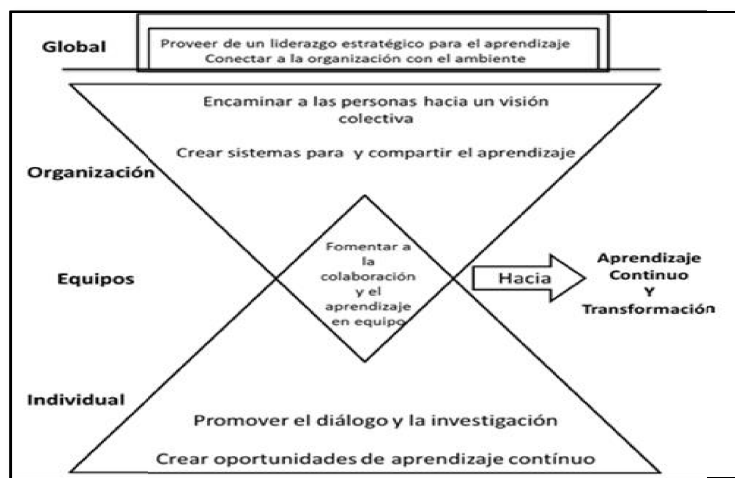
Fig. 1. Modelo integrado del Aprendizaje Organizacional. Fuente: [7]