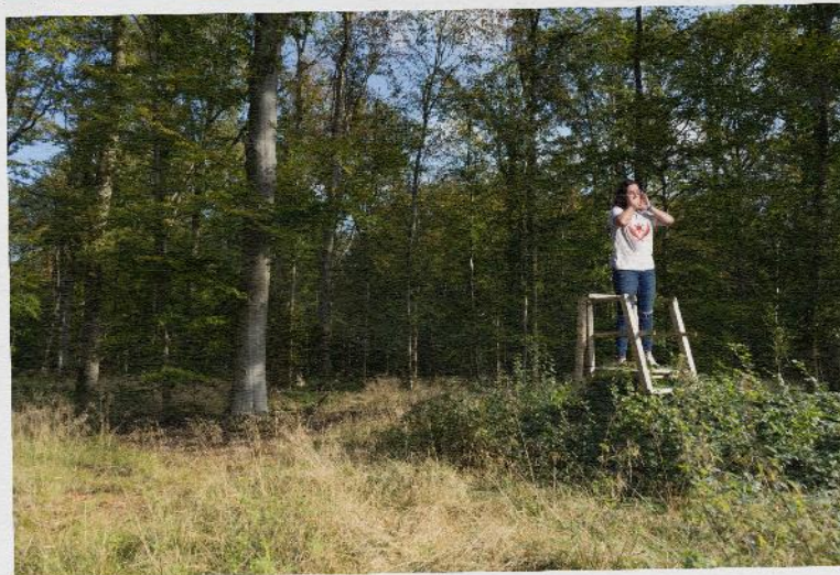
Una cantora vocal pujada al podi de pròtema ornitològica.