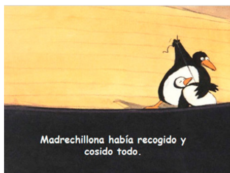
Figura 11. Libro Madrechillona

Asimismo, en Madrechillona (2000), de Jutta Bauer, un pingüino termina en pedazos por todo el mundo. La historia muestra a una mamá molesta que grita tan fuerte que desarma el cuerpo del pequeño pingüino. Sin embargo, ella misma se encarga de juntar cada una de las piezas para, finalmente, pedirle perdón.