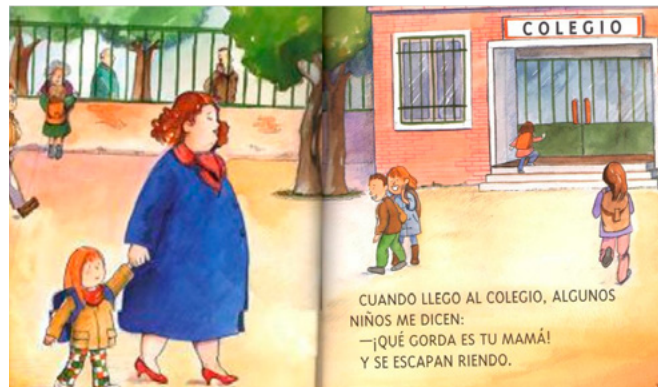
Figura 2. Libro Mi mamá es preciosa

Mi mamá es preciosa resalta uno de los estereotipos más comunes dirigidos hacia la mujer, el que se relaciona con la estética del cuerpo ideal. Como menciona Jáuregui (2008), del mero dato físico, “estar gordo o gorda”, se puede pasar a categorizar a la persona obesa sobre la base de nuestras creencias. El resultado de esta fusión es un sesgo en las atribuciones, lo cual puede cambiar la manera en que vemos a las madres o a las mujeres en general. Esta historia muestra un tipo de cuerpo completamente apegado a la realidad y adentra al lector en la diversidad de características estéticas de las mujeres, y en específico de las madres.