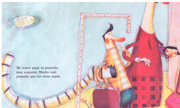
Figura 4. Libro Un papá a la medida