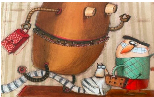
Figura 8. Libro Quiero una mamá robot

Respecto a la identidad y las emociones propias que proyectan los personajes con rol de madres, en A veces mamá tiene truenos en la cabeza (2020), de Beatriz Taboada, destacan las emociones que experimenta el personaje de la mamá y la manera en que se hacen visibles para la hija. En el análisis de las ilustraciones, se hace manifiesto que cuando hay emociones negativas casi no se muestra la cara de la madre; en cambio, si sus emociones son positivas, se representa de frente. Gracias a que la madre permite que sus emociones salgan a flote, la protagonista comienza a sentirse identificada con su madre, e incluso reconoce que se ha dado cuenta de que también tiene emociones cambiantes.