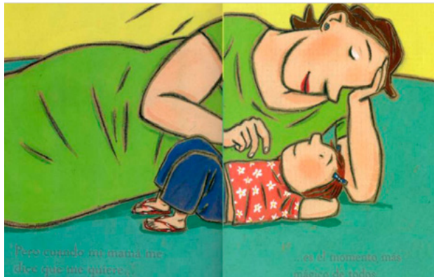
Figura 12. Libro Mi mamá es mágica

En el análisis del corpus de LIJ nos dimos cuenta de que en los textos aparece la palabra madre desde el inicio de la narración. Algunos muestran en la portada a una mujer acompañada de la imagen de un niño. También las madres son representadas con imágenes poco convencionales, como en El niño y la bestia , en cuya ilustración de portada se ve a un niño que dirige a una bestia hacia el interior del cuento.