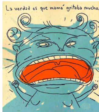
Figura 10. Libro El globo

Una vez que la madre se convierte en este objeto, a Camila le es más fácil acercarse; la relación con el globo rojo mejora, aun va al parque con él.