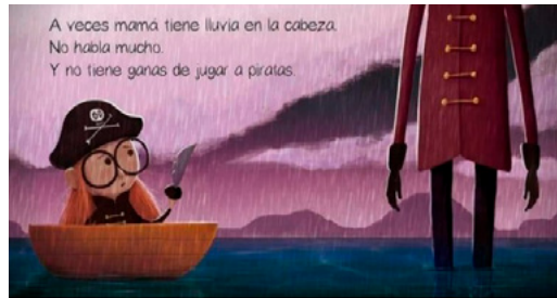
Figura 9. Libro A veces mamá tiene truenos en la cabeza

En El globo (2000), de Marisa Núñez, la mamá de la protagonista se convierte en un globo rojo a raíz de un ataque de cólera. Al analizar la ilustración, y de acuerdo con lo que menciona Erro (2000), el color rojo en las ilustraciones representa la ira, la violencia, y en el cuento vemos retratada a una mamá que es iracunda.