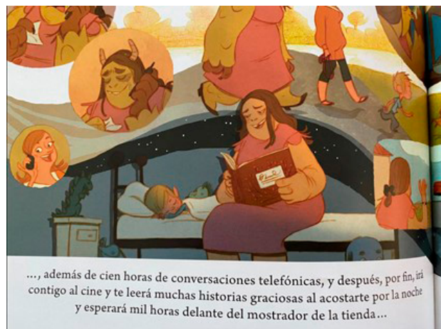
Figura 3. Libro El niño y la bestia

Por el desarrollo de la trama y las ilustraciones, el lector intuye que el personaje está llevando un duelo a causa de un divorcio, que se plantea de manera implícita. Si bien son las actitudes descritas en la trama las que convierten a la madre en otro ser, las imágenes dejan entrever al lector que el aspecto físico de ella es el que va cambiando, hasta convertirse en una bestia.