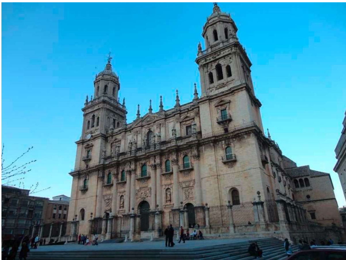
Catedral de Jaén. Foto del autor, 2013.

Morena para entretener al Conde de Artois 2 en 1782, y a Carlos IV en 1796 (JIMÉNEZ 1991: 135).