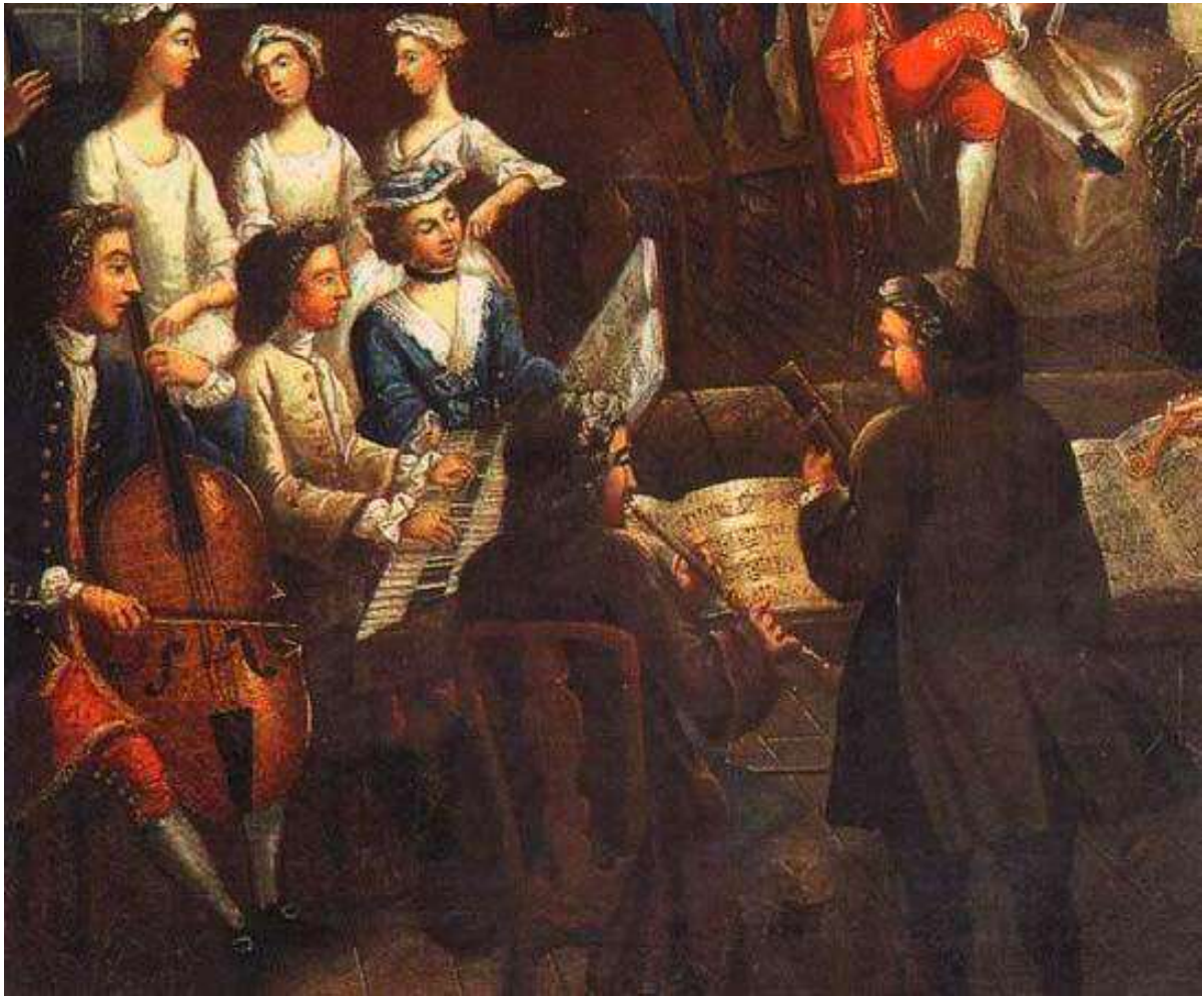
Trio de músicos tocando una sonata. Siglo XVIII. Anónimo.