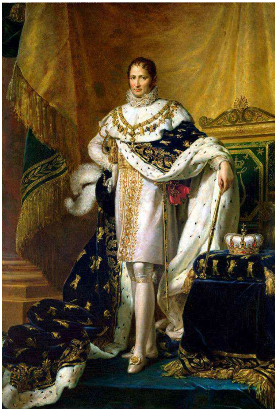
José Bonaparte como Rey de España, por François Gérard (c. 1808).

Poblaciones de Sierra Morena durante el periodo foral fue José Napoleón I. En el Palacio Real de La Carolina, firmó a 9 de mayo de 1810, el decreto que abolió el Fuero de las Nuevas Poblaciones entre otras providencias para las colonias. Aunque en esta ocasión, no tenemos referencias a grupos instrumentales en su visita.