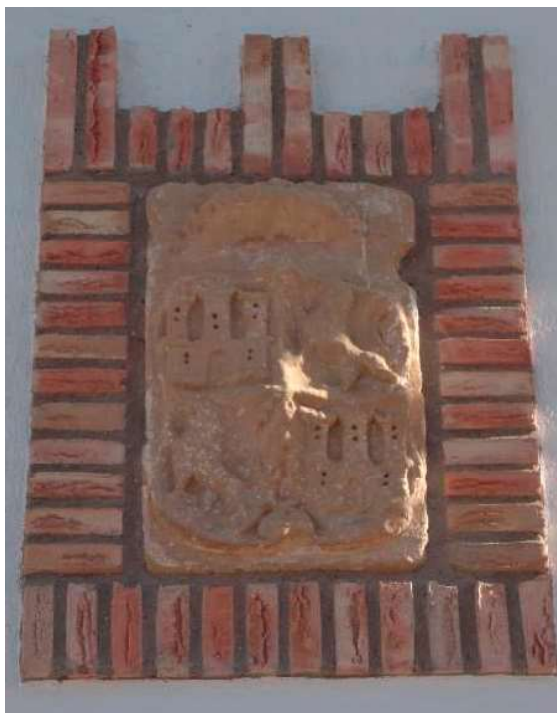
Escudo real de Santa Elena. Versión reducida, sin el escudete borbónico, igual al utilizado por la Intendencia de Nuevas Poblaciones.

Estos escudos, junto con las armas reales, son los emblemas oficiales de la desaparecida provincia “Intendencia de Nuevas Poblaciones”, símbolos que la representan incluso después de la abolición del Fuero de las Nuevas Poblaciones en 1835.