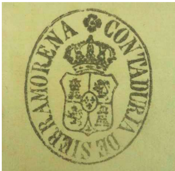
Sello de la contaduría de las Nuevas Poblaciones de Sierra Morena con el escudo real. 1824

En Santa Elena, un escudo de piedra, desaparecido a finales del siglo XX, fue documentado en el año 2011, colocándose en el año 2012 encima de un portón que da acceso a los restos de algunos arcos que formaban parte de la primera iglesia de Santa Elena, la cual había tenido su origen en la antigua ermita de la Santa Cruz o de Santa Elena. El escudo había estado situado hasta su desaparición encima de la clave de un arco cegado. Curiosamente el emblema es igual al utilizado por la Intendencia de Nuevas Poblaciones, y su situación original, dentro de la primera iglesia de Santa Elena nos puede sugerir que fuera realizado y situado en ella por la Intendencia de Nuevas Poblaciones, de igual modo que se realizó en otras iglesias coloniales que poseen escudos reales en su interior (o en sus fachadas) por ser su jurisdicción de realengo. Esto sucede en las iglesias de La Carolina, La Carlota, Fuente Palmera o La Luisiana.