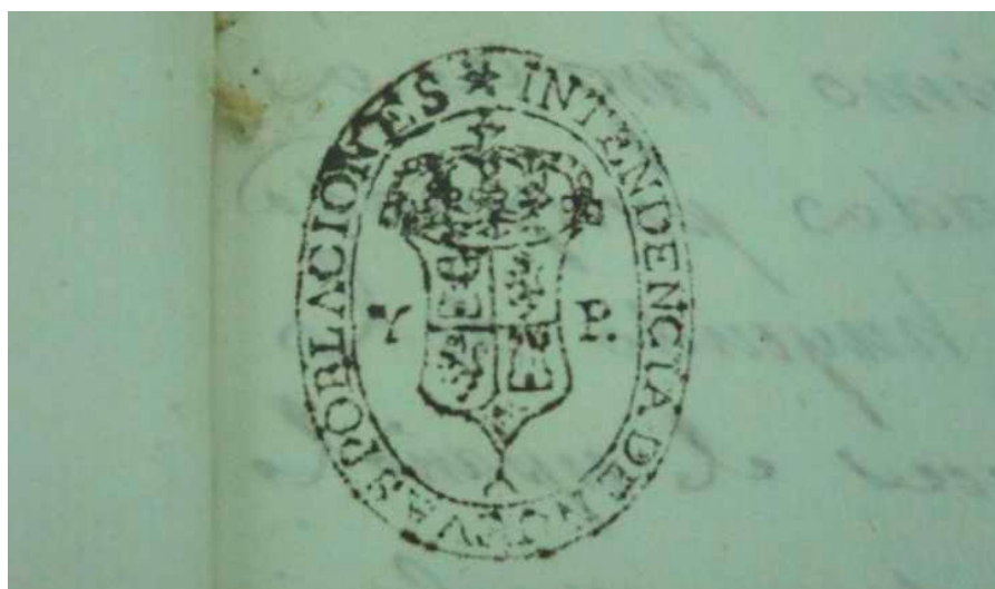
Sello de la Intendencia de Nuevas Poblaciones de Sierra Morena y Andalucía utilizado a partir de 1824 con las armas reales y sin el escudete Borbón.

Fue en 1824 cuando el Intendente de las Nuevas Poblaciones, Pedro Polo de Alcocer, mandó realizar los sellos, y con ellos los emblemas, que servirían para diferenciar la documentación emitida por las Intendencia de Nuevas Poblaciones de la emanada de la Subdelegación de Nuevas Poblaciones de Andalucía y la contaduría de las Nuevas Poblaciones de Sierra Morena. Hasta el momento, las Nuevas Poblaciones utilizaban como emblema el escudo de Carlos III, fundamentalmente la versión reducida que podemos ver coronando el Palacio de la Intendencia, en uno de los relieves de las torres de la Fundación de La Carolina o el que adornaba la Fuente del Rey de La Carlota, que por desgracia fue robado. El Atlante Español de Espinalt ya nos dejó claro este aspecto en 1787.