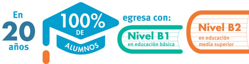
Imagen 1: SEP, Estrategia Nacional para el Fortalecimiento de la Enseñanza del Inglés, (2017)

La Reforma Integral de Educación Básica (RIEB) es una política pública que impulsa la formación integral de todos los alumnos de preescolar, primaria y secundaria con el objetivo de favorecer el desarrollo de competencias para la vida y el logro del perfil de egreso. El espíritu de la reforma no solo destaca el énfasis en su articulación, ni se reduce al desarrollo curricular, sino a una visión más amplia, con condiciones y factores que hacen posible que los egresados alcancen estándares de desempeño: competencias, conocimientos, actitudes y valores que se apoyan en el currículo, las prácticas docentes, los medios y materiales de apoyo, la gestión escolar y los alumnos.