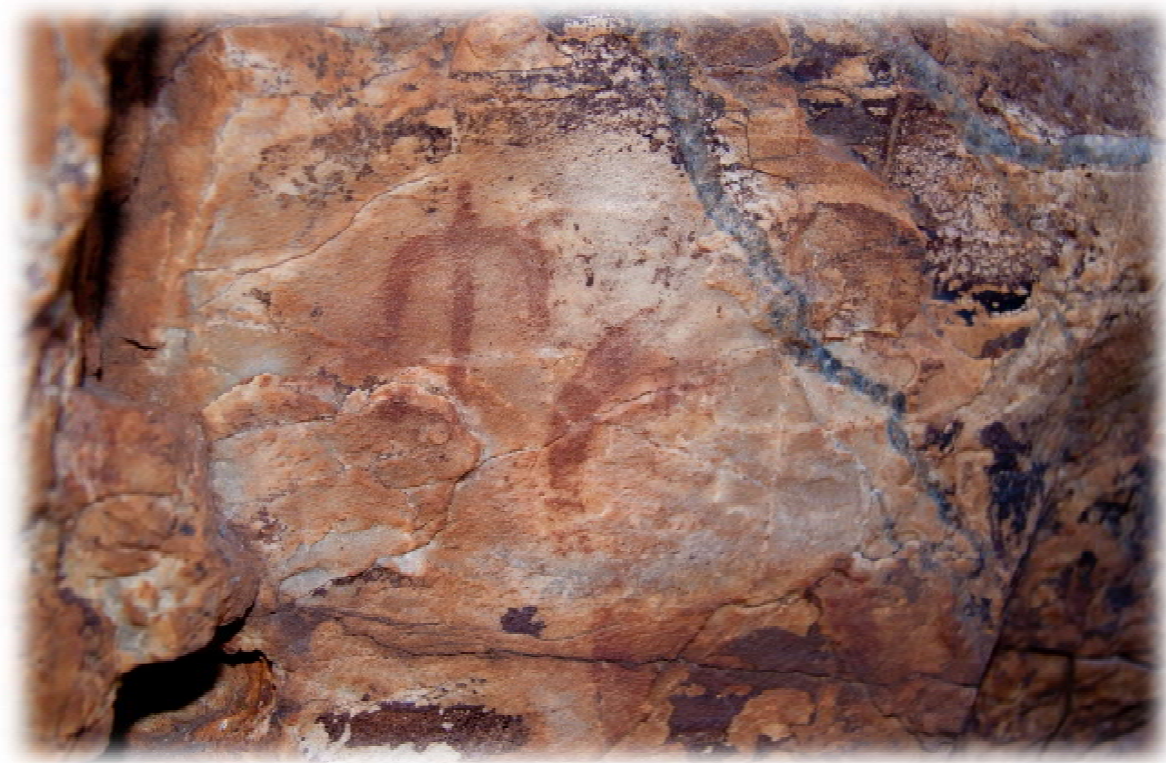
Representaciones antropomórficas. Foto del autor, 2014.