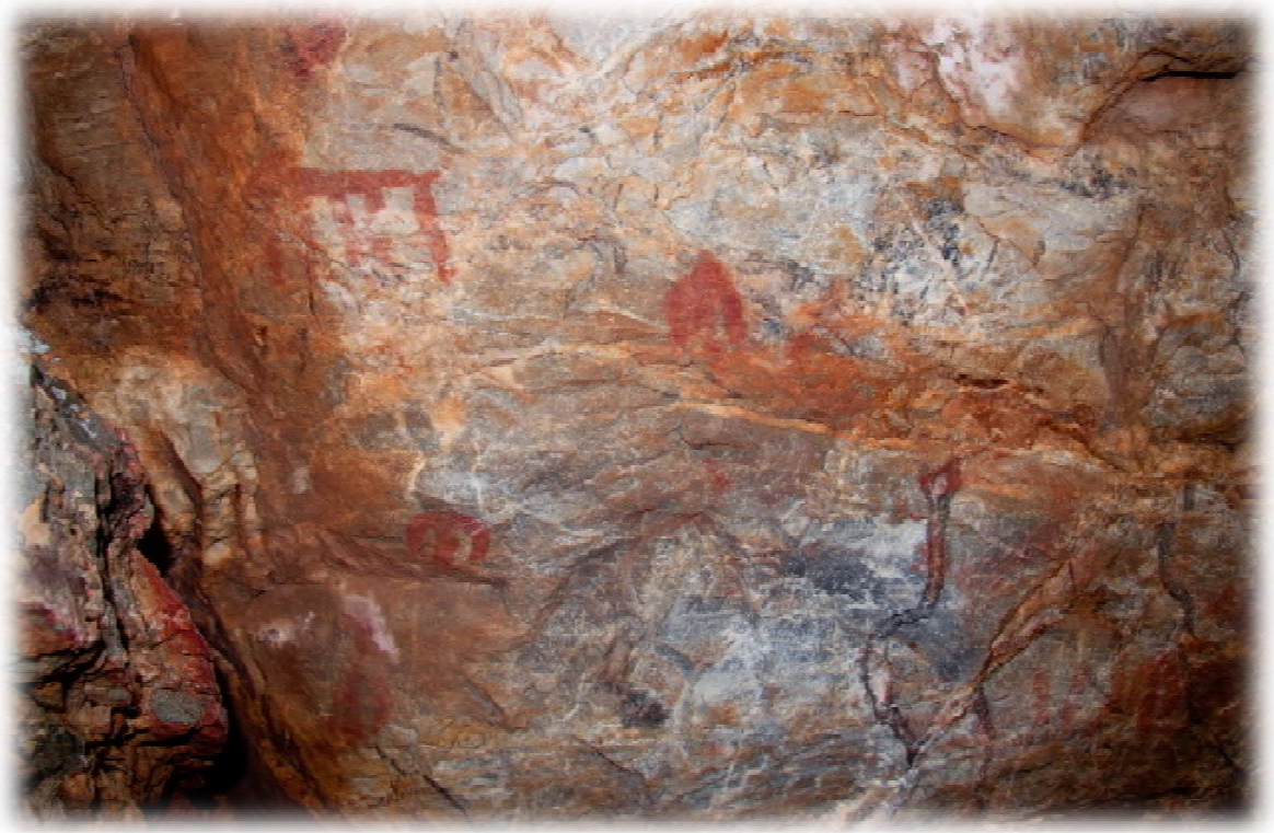
Pinturas del abrigo sur. Foto del autor, 2014.

En la cara norte, en una oquedad de más o menos 1,50 cm hay un grupo numeroso de figuras antropomórficas.