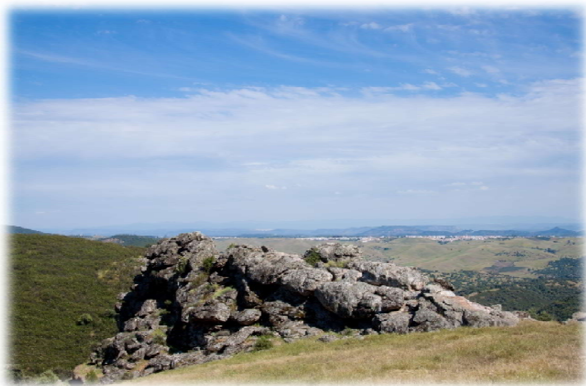
Crespón de cuarcita. Foto del autor, 2014.

En el abrigo sur, podemos diferenciar unas pinturas en color rojo, realizadas en su mayoría con los dedos y, posiblemente, con un útil parecido a un pincel para detallar los trazos más finos. Las representaciones ubicadas en este crespón son antropomórficas, tipo golondrina, y sobresale una zoomórfica compuesta por varias patas y una especie de cabeza que apenas se aprecia, debido a su deterioro.