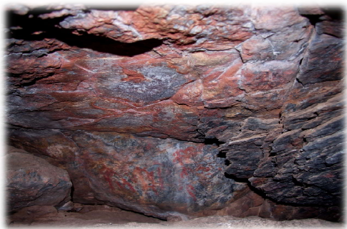
Pinturas antropomórficas de la cara norte. Foto del autor, 2014.

Y a pocos metros a la izquierda en la pared de la roca también se repiten esas representaciones.