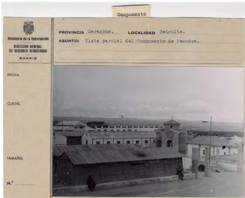
Regiones Devastadas. Belchite Caja F-04250, 17.