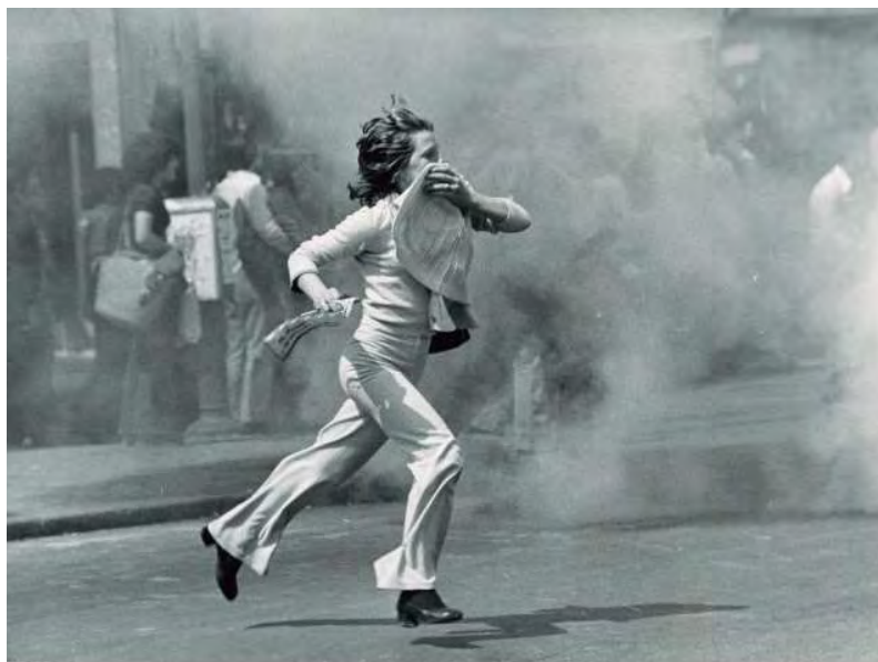
MCSE. Disturbios en Madrid durante la manifestación del 1º de mayo de 1977. Caja F-01616, sobre 20.