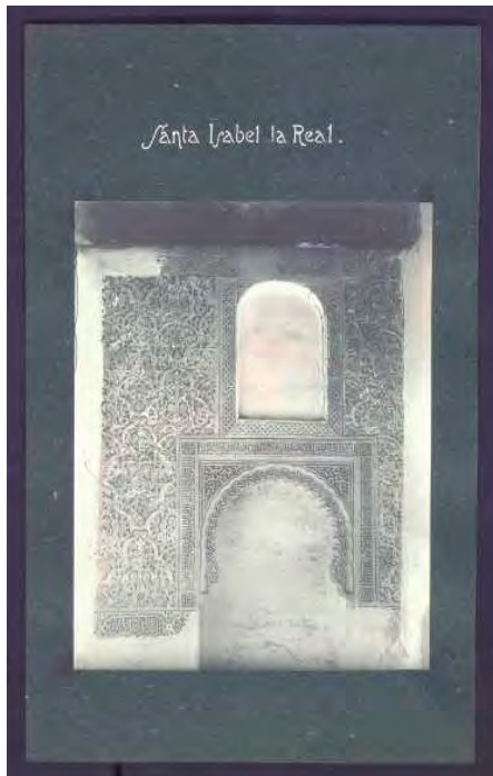
Fondo Ministerio de Educación "Vista de salón interior en Palacio de Daralhorra de Granada", fotografía perteneciente al proyecto de reparación o conservación del Palacio de Daralhorra (Granada), [1926], caja F/06004.