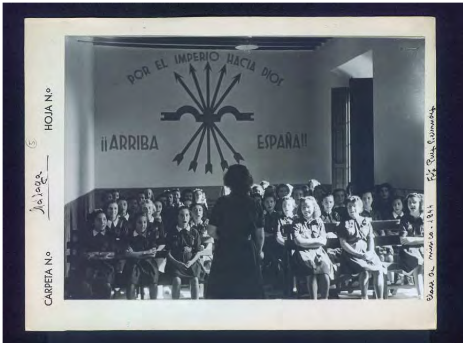
Sección Femenina. Escuela de niñas. (1944). Caja F-04303 sobre 19.

Fondo Fotográfico del Centro Nacional de Lectura Fondo fotográfico de la Dirección General de Regiones Devastadas Fondos Fotográficos de la Junta de Reconstrucción de Templos Parroquiales