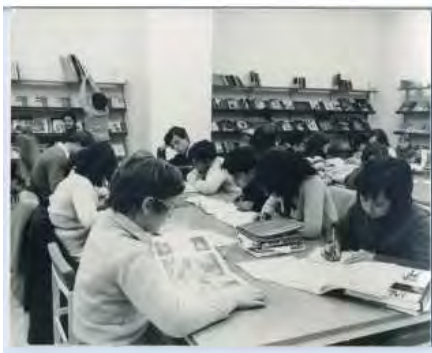
CNL. Biblioteca pública municipal de San Clemente (Cuenca) Caja F-00007, sobre 07.

Fondo Fotográfico del Centro Nacional de Lectura Fondo fotográfico de la Dirección General de Regiones Devastadas Fondos Fotográficos de la Junta de Reconstrucción de Templos Parroquiales