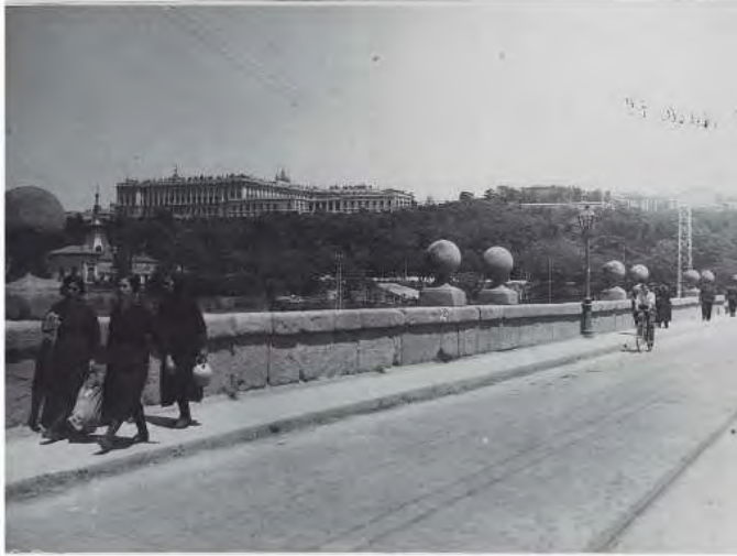
Patronato Nacional de Turismo. Puente de Segovia. Madrid. (1931-1936). Caja F-00205, sobre 06.

Creado en 1928, como heredero de la Comisaría Regia de Turismo, nos ha dejado las mejores imágenes de paisajes rurales y urbanos, monumentos y obras de arte en general, paradores y albergues, folclore, etc. Y todo ello de mano de los mejores fotógrafos del momento. Destaca entre todas, las imágenes que conforman el Catálogo Monumental.