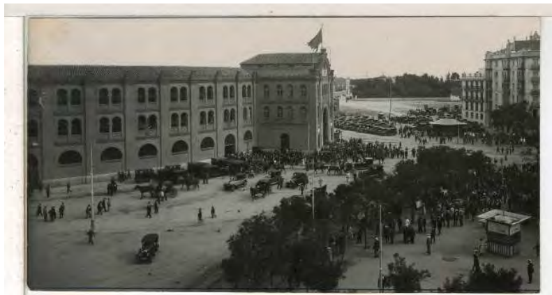
MCSE. Toros. Antigua Plaza de Toros de Madrid. F-01970-01.