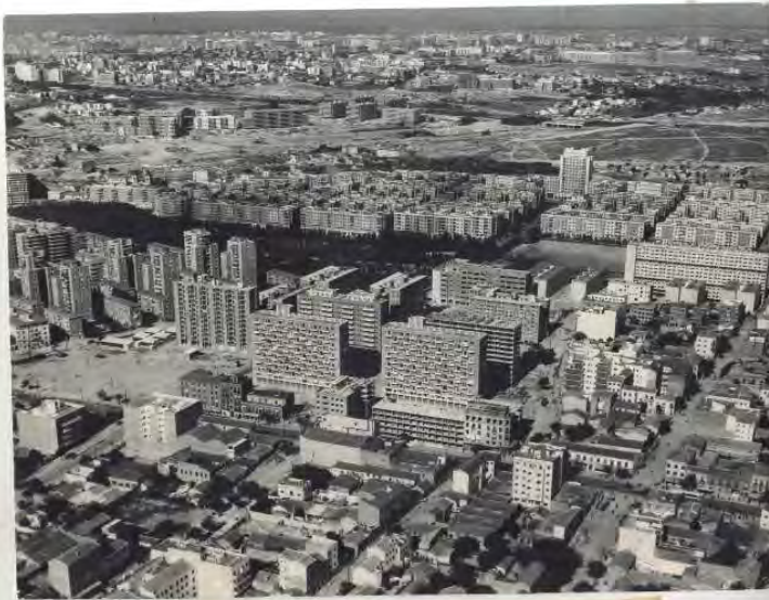
El sector de la Unión con el barrio de la Concepción y el Parque del Cajero, un barrio bello y moderno de lo que fue un barrio de inmigrantes. Al fondo, en el panorama general de la ciudad, se advierte, en las zonas ordenadas y abiertas la mano de la Comisión de Urbanismo.