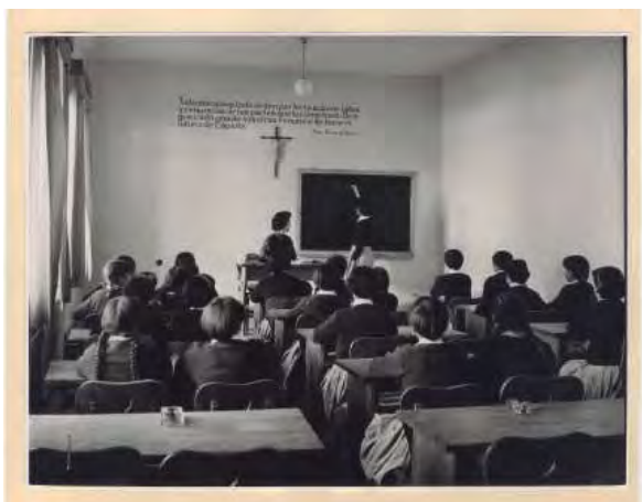
Sección Femenina. Escuela de niñas en Málaga (1944). Caja F-04306, sobre 09.