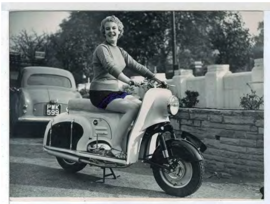
MCSE. PGE. (1955) F-00547, sobre 24.