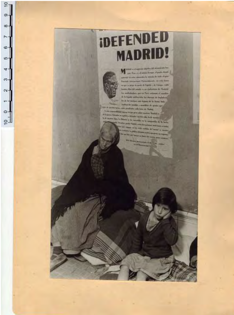
Refugiados en el metro. F-04042-53505-001-r.