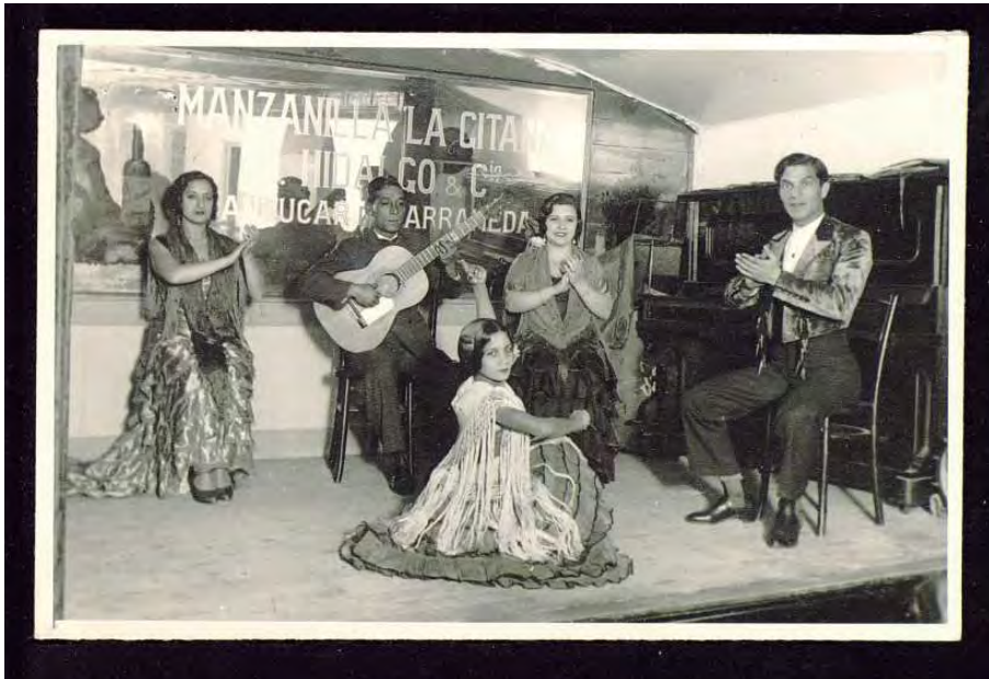
MCSE. Biografías. Carmen Amaya con 9 años. F-02048-37.