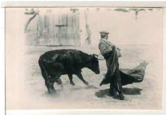
Toros. Rafael Guerra Guerrita.