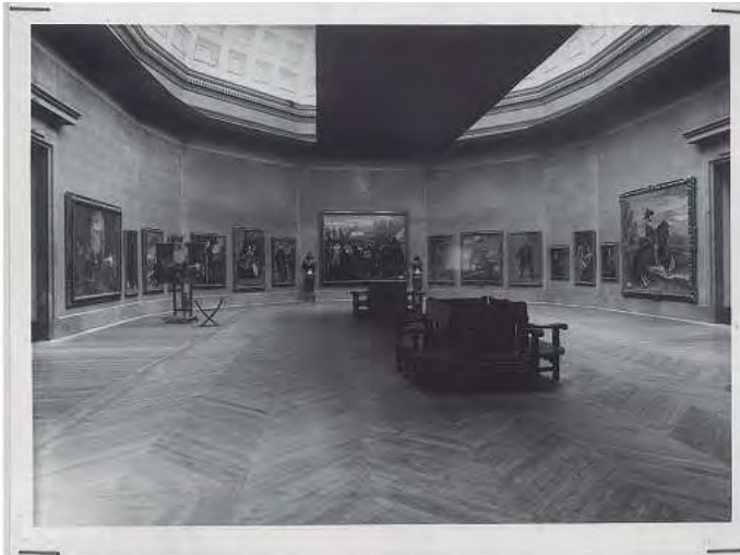
Patronato Nacional de Turismo. Sala Velázquez en el Museo del Prado. Madrid. Caja F-00208, sobre 02.