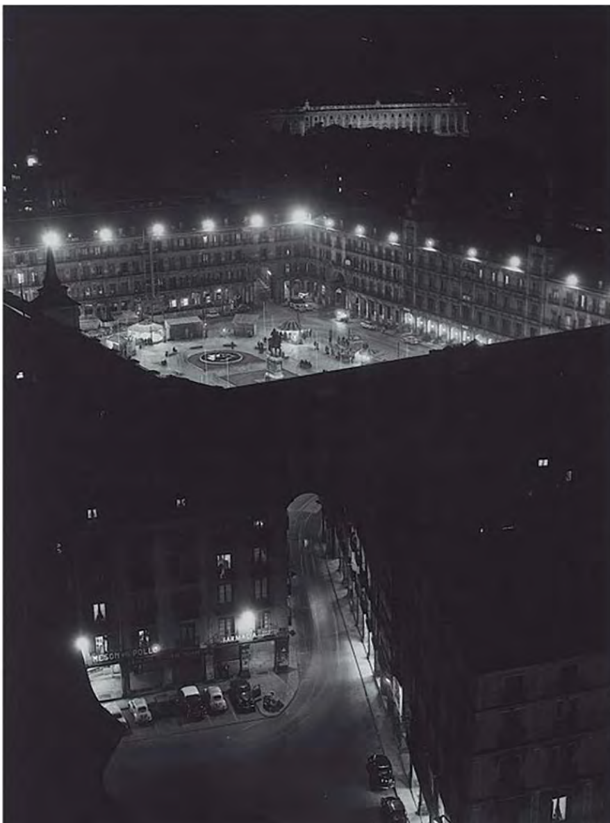
Patronato Nacional de Turismo. Vista de la Plaza Mayor desde la Iglesia de Santa Cruz. Madrid. Caja F-00178, sobre 07.