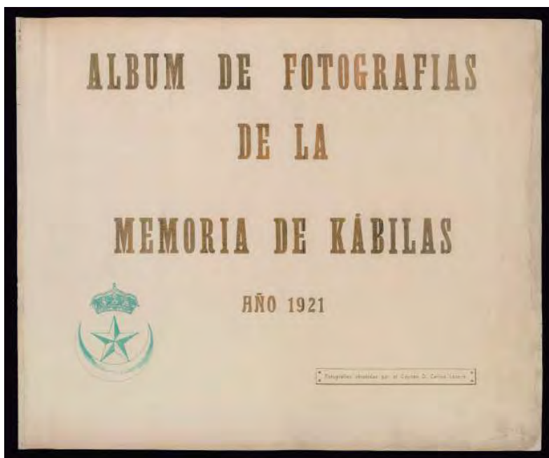
Memoria de las Kabilas, 1921. Caja 12/05219.