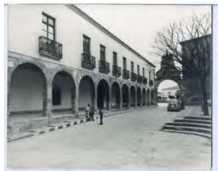
CNL. Fachada de la Biblioteca pública municipal de San Clemente (Cuenca) Caja F-00007, sobre 07.