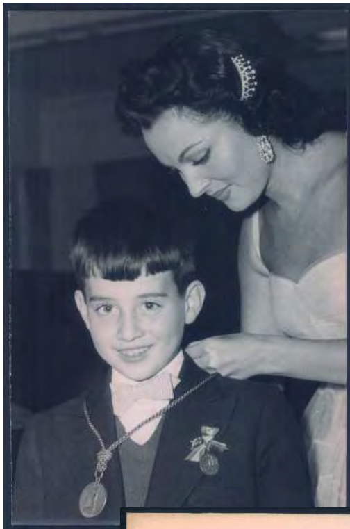
Agencia Gráfica Torremocha. Paquita Rico. Caja F-02816, sobre 13.

Página siguiente: Agencia Gráfica Torremocha. Paquita Rico. Caja F-02816, sobre 13.