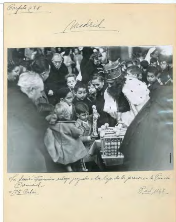
Sección Femenina. Caja F-04310, sobre 10.