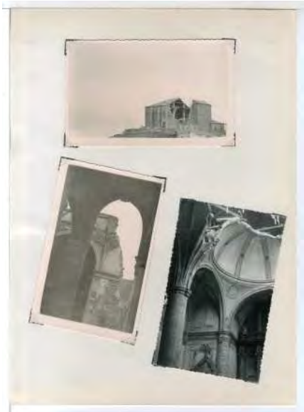
JRTP. Iglesia parroquial de Torrejuncillo del Rey (Cuenca) Caja F-04131, 16.