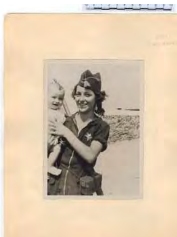
Miliciana despidiéndose de su hijo, Caja F-04064, 001.