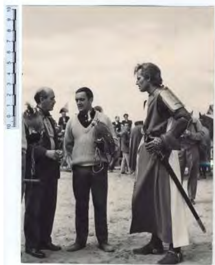
MCSE. Rodaje de la película El Cid en España. Charlton Heston con Félix Rodríguez de la Fuente (1961). Caja F-02398, sobre 08.