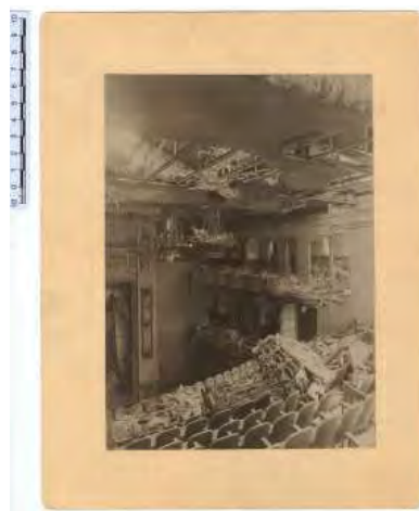
Cine Ópera. Caja F-04038