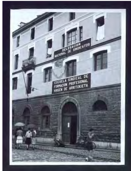
Delegación Nacional de Sindicatos, Caja F/04545, s. 6.