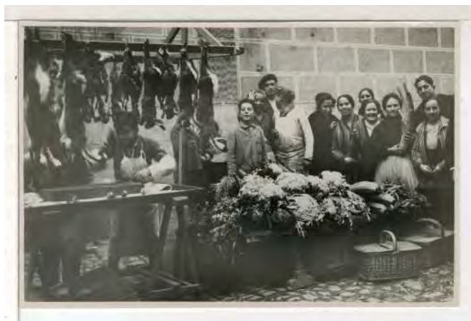
MCSE. PGN. Mercado de Lavapiés. Madrid F-00670, sobre 4.