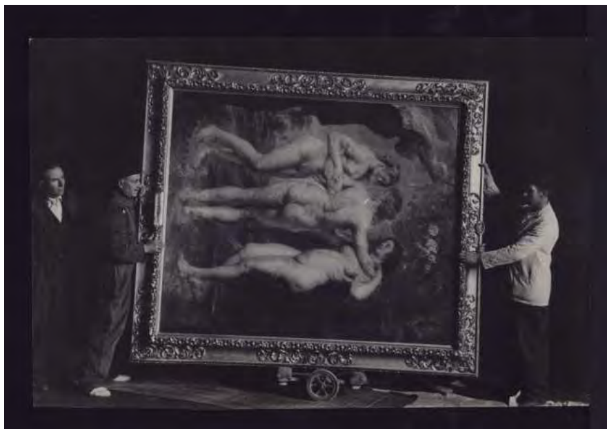
MCSE. PGN. Las Tres Gracias de Rubens vuelven al Museo del Prado (8 de julio de 1939). Caja F-00974, sobre 53.

Prensa Gráfica Nacional Prensa Gráfica Extranjera Biografías Biografías de cine, teatro y espectáculos Temático Toros Circo Teatro Cine