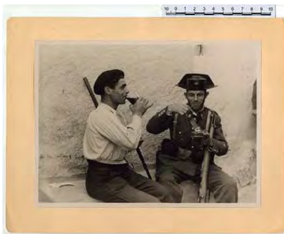
Miliciano y Guardia Civil almorzando [1936]. Caja F-04050, fotografía nº 5417.

Dentro del Ministerio de la Propaganda republicano durante la Guerra Civil (1930 – 1939) 102 cajas de conservación AGA (con 3.049 fotografías). Creado por la Junta Delegada de Defensa de Madrid, cuyos orígenes se remontan a los inicios de la Guerra Civil española, en 1936, si bien contiene imágenes de acontecimientos anteriores a la contienda, como la sublevación de Jaca de 1930. En la actualidad lo componen 3.051 imágenes, realizadas en blanco y negro y montadas en soportes de cartón, como era habitual para la época. Las unidades documentales que lo componen están organizadas por categorías temáticas, siguiendo los inventarios originales.