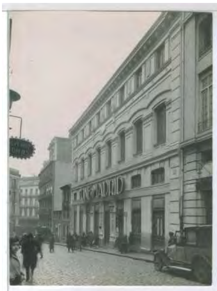
MCSE. Cine. Cine Madrid. F-02039-3901.