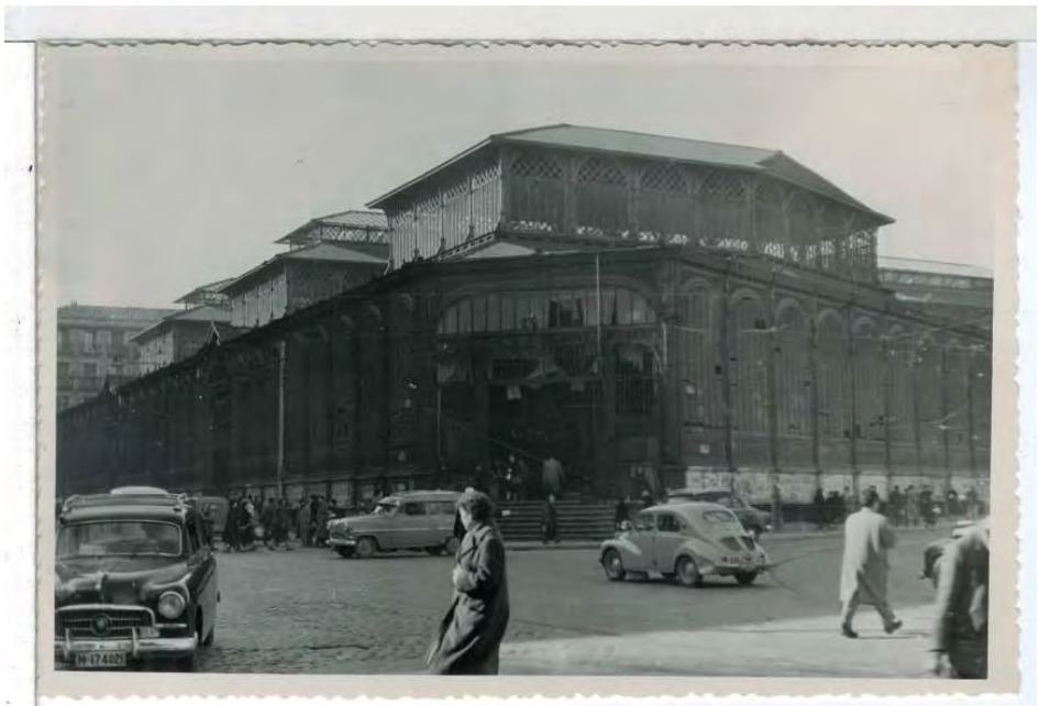
MCSE. PGN. Mercado de La Cebada. Madrid. (1969) F-00670, sobre 4.