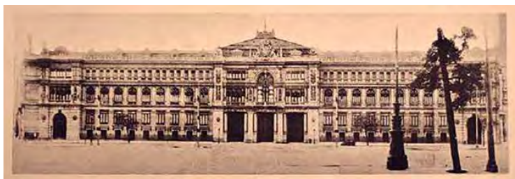
Madrid. Fachada de la calle de Alcalá del edificio del Banco de España. Arriba, a la derecha, las casas de Santamarca antes de su demolición. Abajo, después de la ampliación realizada entre 1929 y 1936. 1936.