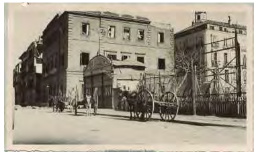
Sucursal de Málaga (calle de la Alameda Hermosa, 7, sede entre 1874 y 1936). Izquierda, vista exterior del edificio. Ca. 1896. Derecha, estado ruinoso en que quedó el edificio después de los bombardeos sufridos a comienzos de la Guerra Civil. Ca. Abril de 1937.

Las fotografías de este edificio tienen un valor especial por haber sido bombardeado durante la Guerra Civil y demolido a continuación. El nuevo y actual edificio, en la avenida de Cervantes, fue proyectado por José Yarnoz e inaugurado en mayo de 1937, en plena Guerra Civil.