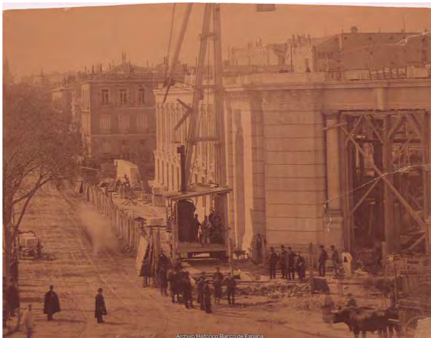
Madrid. Grúa de vapor delante del edificio del Banco de España en construcción (Chafalán de Cibeles y paseo del Prado). Ca. 1886. Fotografía Jean Laurent.

se conservan fotografías de época y apenas alguna posterior. En cambio, de la sede actual en la plaza de Cibeles, cuya construcción finaliza en 1891, existe una primera fotografía de su construcción, que podemos datar en 1886, con una grúa de vapor subiendo los materiales, cuyo autor es el insigne Jean Laurent, y un precioso reportaje de gran valor estético e informativo, realizado por el afamado establecimiento fotográfico de J. Laurent y Cía., sucesores de Jean Laurent, que ya había muerto.