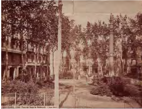
Barcelona. Edificio de la plaza del Duque de Medinaceli ofertado al Banco de España en 1882 para establecer la sede de la sucursal. Ant. 1882.

Su alquiler fue desestimado y no fue hasta 1892 que la sucursal se trasladó a la casa de March de Reus, en la Rambla de Santa Mónica, un edificio construido a fines del siglo XVIII por el arquitecto Joan Soler y Faneca como palacio burgués, en el que se hicieron algunas obras de adaptación para su utilización con sede bancaria, como la cobertura del patio central con una armadura de hierro y cristal para convertirlo en Patio de Caja de Efectivo, pero manteniendo en muchas de las salas el aspecto palaciego original. De este edificio se conserva un conjunto de fotografías muy interesantes datadas en 1929. Actualmente el inmueble está ocupado por dependencias de la Generalitat de Catalunya.