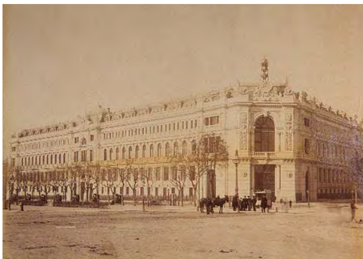
Madrid. Vista del edificio del Banco de España. 1891.