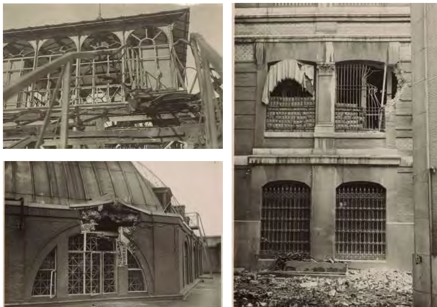
Madrid. Desperfectos causados en el edificio por los bombardeos de la Guerra Civil. Ca. 1937.

Nuevas obras y ampliaciones han quedado inmortalizadas en fotografías, como el amplio reportaje de la segunda ampliación del edificio que ocupa la calle de Los Madrazo y de Marqués de Cubas, realizada entre 1969 y 1976, en la que intervinieron los arquitectos Juan de Zavala y Javier Yarnoz Orcóyen. El reportaje, formado por más de 700 fotografías, constituye una auténtica narración gráfica de la obra, que comienza con las instantáneas de los solares y las edificaciones preexistentes a su demolición y termina con la obra ya finalizada. Sucesivas fotografías de nuevas ampliaciones, de reformas interiores, de rehabilitaciones de espacios, están presentes en la colección. Todas ellas forman parte de la historia documental del edificio.