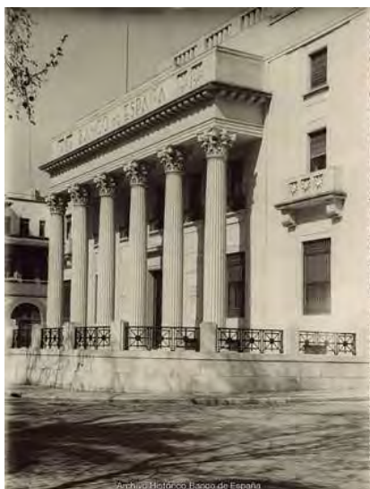
Sucursal de Málaga. Vista exterior del edificio (avenida de Cervantes, 3). Ca. 1973.

Un segundo bloque de fotografías de la Colección lo constituye el formado por las fotografías de los empleados del Banco . En el proyecto de formación de la Colección de Fotografías se han rastreado todos los expedientes personales de los empleados del Banco en busca de sus retratos fotográficos, habiéndose hallado que las primeras fotografías de esta tipología fueron realizadas en los primeros años del siglo XX. Inicialmente se fotografiaba exclusivamente a los empleados de las escalas más bajas de la plantilla –ordenanzas, mozos, porteros, celadores– pero en el transcurso del tiempo el recurso a la fotografía para identificación de los empleados se extendió a la plantilla completa. Se trata de fotografías cuya intención era el reconocimiento de los empleados a partir de su imagen física y podrían ser consideradas un antecedente de la posterior fotografía de carnet. Hasta la Guerra Civil encontramos fotografías de gran calidad técnica realizadas con un realismo y veracidad sorprendentes. En ellas descubrimos las modas de cada momento, el cuidado en los posados, las decoraciones de los fondos, la utilización de recursos lumínicos... aspectos todos ellos que evolucionan con el tiempo, dejando en la fotografía la impronta estética propia de cada época.