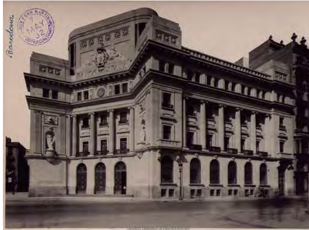
Sucursal de Barcelona. Vista exterior del edificio (vía Layetana, 32-34, sede entre 1932 y 1955, obra de los arquitectos José Yarnoz Larrosa y Luis Menéndez Pidal). 1932.

Continuando con Barcelona, no podemos dejar de hacer mención a las fotografías realizadas por el fotógrafo Andreu Puig i Farrán del edificio de Vía Layetana, obra singular de José Yarnoz Larrosa y Luis Menéndez Pidal inaugurado en 1932, uno de los mejores edificios de los levantados por el Banco de España en su historia, que hoy ocupa otra entidad bancaria. La original disposición de vestíbulos, patios y oficinas de la planta baja con sus correspondientes lucernarios y juegos de luces, han sido magníficamente destacados por el ojo del fotógrafo, que ha logrado capturarlos con el realismo que merecen.