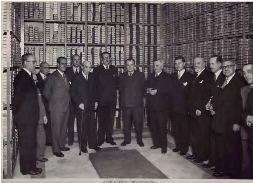
Visita de Demetrio Carceller Segura, ministro de Industria y Comercio, a la cámara acorazada del Banco de España. 1944.