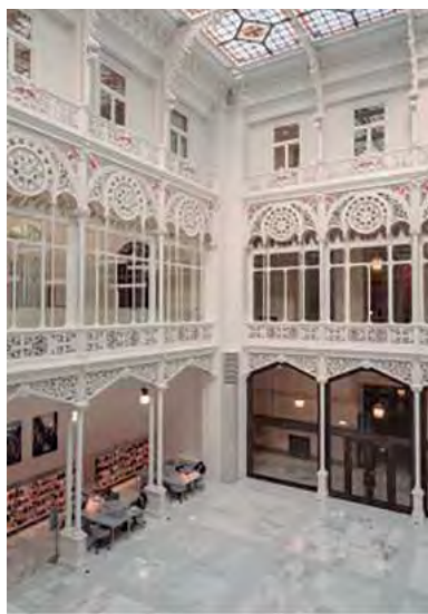
(Izquierda) Madrid. Patio de Caja de Efectivo del edificio del Banco de España. 1891. Fotógrafo J. Laurent y Cía. Positivo de Juana Roig Villalonga [entre 1915 y 1930]. (Derecha) Madrid. Biblioteca del Banco de España. 2019. Fotógrafo Luis Asín.