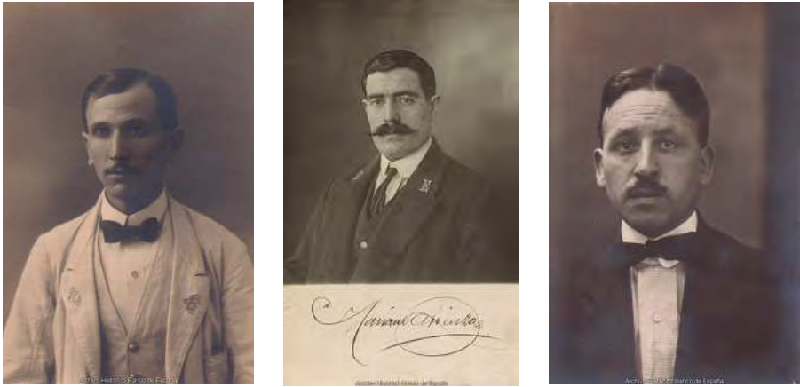
Retratos de empleados del Banco de España. Entre 1911 y 1918.

deja entrar de modo completo en este momento esencial de nuestra historia que es el anterior a la Guerra Civil. Aparecen fotografiados los empleados de Madrid, de las setenta sucursales y de las agencias de Tánger, Larache, Tetuán, Londres y París.