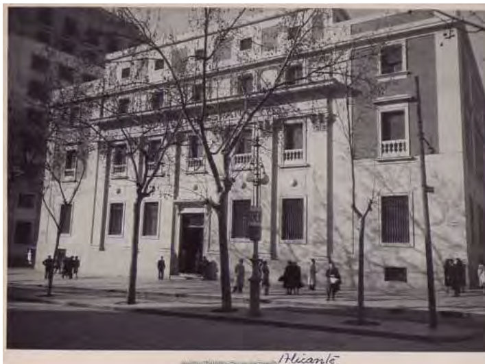
Sucursal de Alicante. Vista exterior del edificio de la rambla de Méndez Núñez. Ca. 1970.

fotografía desde varios ángulos la calle Méndez Núñez, donde se construiría el edificio de la sucursal, que sería proyectada por José Yarnoz Larrosa en 1943 y que hoy día continua en uso como Banco de España.