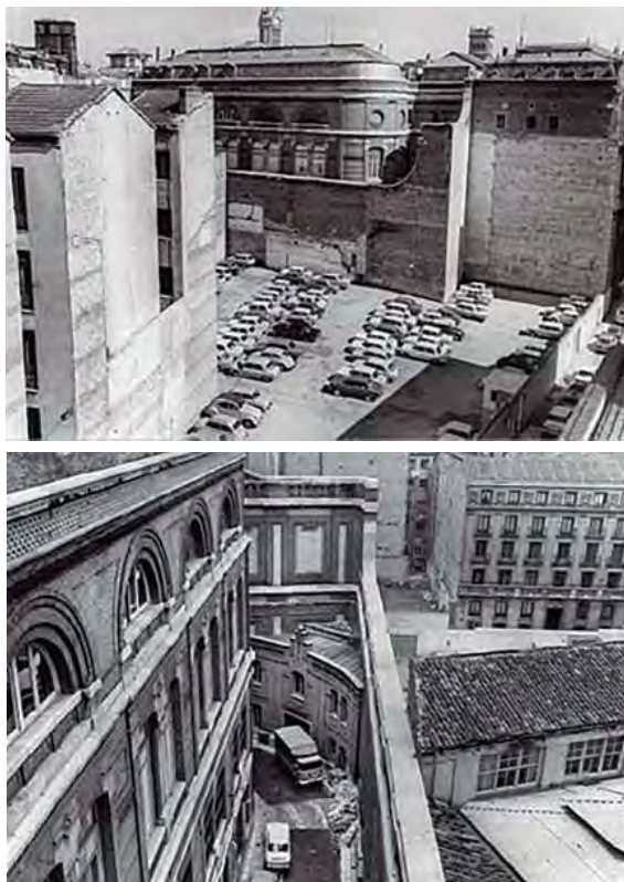
Madrid. Vista de los solares de las calles de Los Madrazo y Marqués de Cubas, sobre los que se construirá la segunda ampliación del edificio del Banco de España entre 1969 y 1976. Ca. 1969.

que se instalan las agencias de Londres y París, y se continua con la agencia de Berlín en 1903. Tánger abrió sus puertas en 1909 y Larache y Tetuán en 1920.