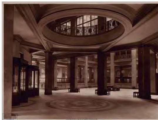
Sucursal de Barcelona. Perspectiva del Patio de Operaciones (vía Layetana, 32-34, sede entre 1932 y 1955, obra de los arquitectos José Yarnoz Larrosa y Luis Menéndez Pidal). 1932.