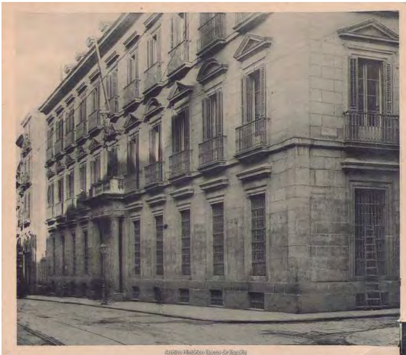
Madrid. Edificio de los Cinco Gremios Mayores de Madrid (calle Atocha, 15), sede del Banco de España entre 1847 y 1891.

El Banco ha transitado en Madrid por cuatro sedes, además de una auxiliar en la calle de Alcalá, 522, obra de José Antonio Corrales y Ramón Vázquez Molezún, que fue finalizada en 1992. De las dos primeras, el palacio del conde de Sástago, en la calle de la Luna, sede entre 1783 y 1825, y la casa de la calle de La Montera, sede entre 1825 y 1847, lógicamente no existen fotografías de época, dado que la fotografía se da a conocer en 1839 y en esos pocos años en que fotografía e edificios conviven, aquella era poco utilizada. Tampoco se conservan en el Archivo Histórico del Banco de España fotografías de estos edificios de época posterior. De la tercera sede, el palacio de los Cinco Gremios Mayores, localizada en la calle de Atocha y utilizada como sede entre 1847 y 1891, tampoco