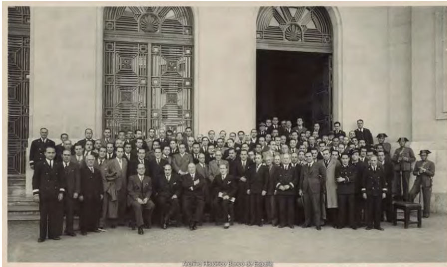
Empleados de la sucursal de Barcelona. 1936. Fotografía desconocida.

Un grupo interesante de fotografías es el de las mujeres contratadas de modo temporal para sustituir a los hombres que habían sido llamados a filas durante la Guerra. Son las auxiliares temporeras amovibles y se conservan fotografías de todas ellas. Otro grupo de fotografías es el formado por los retratos oficiales de la alta administración del Banco, especialmente gobernadores y subgobernadores, consejeros y directores generales. Aquí hay importantes carencias, pues no ha sido hasta época reciente que se ha procurado retratar de modo sistemático a la alta administración de la institución.