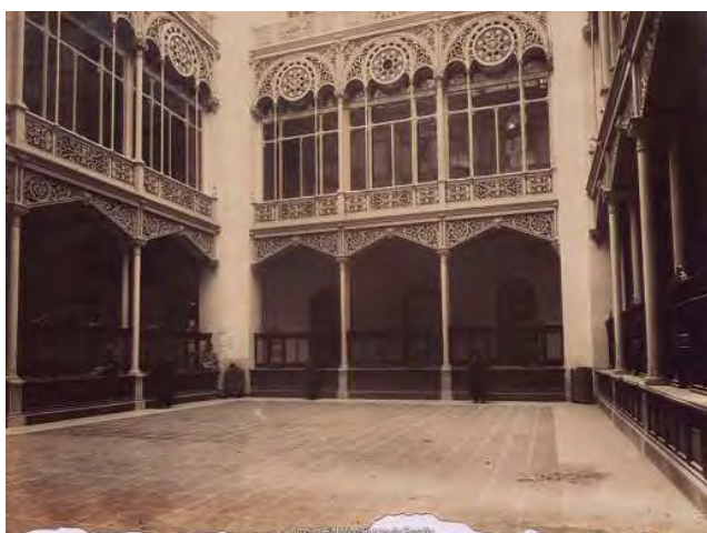
Madrid. Patio de Caja de Efectivo del edificio del Banco de España. 1891. Fotógrafo J. Laurent y Cía. Positivo de Juana Roig Villalonga [entre 1915 y 1930].