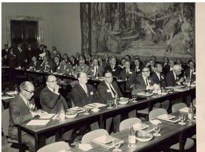
XIII Conferencia Monetaria de la American Bankers Association, celebrada en España entre el 23 y el 27 de mayo de 1966.