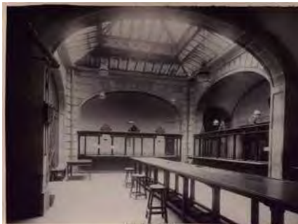
Sucursal de Barcelona. Vistas del edificio (casa March de Reus, rambla de Santa Mónica, 27, sede entre 1892 y 1932). Ca. 1929.