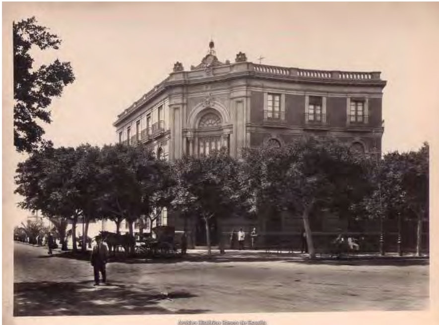
Sucursal de Almería. Vista exterior del edificio de la plaza Circular; actual plaza de Emilio Pérez, sede entre 1904 y 1953, obra del arquitecto Enrique López Rull). Ca. 1929.