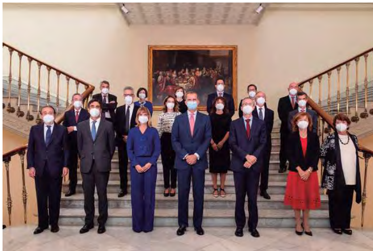
Consejo de Gobierno del Banco de España con el rey Felipe VI y Pilar Alegría, ministra de Educación y Formación Profesional. 2021.

nuevas incorporaciones que necesariamente tienen que llegar, empezando por las fotografías realizadas hoy día por la institución para inmortalizar sus actividades y continuando con posibles compras o donaciones que se pueden producir. Las fotografías nos proporcionan información de gran valor desde múltiples aspectos, entre los que no es menor el mundo de las mentalidades de cada época. La creación de este Fondo ha supuesto una evidente puesta en valor del patrimonio documental del Banco de España y ha ampliado nuestro conocimiento sobre la institución y sobre quienes interactúan con ella.