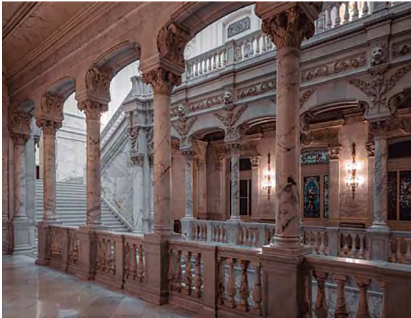
Madrid. Escalera principal del edificio del Banco de España. 2019.

Los documentos del Archivo del Banco de España son el reflejo de las sucesivas funciones que el Banco ha ido asumiendo a lo largo de sus más de 240 años de existencia que, como es lógico, han ido transformándose progresivamente. Podemos afirmar que gracias a la importancia que el Banco ha dado siempre a sus documentos y al cuidado y profesionalidad con el que lo ha gestionado, ha llegado a nuestros días un archivo bien conservado y muy completo, del que podemos afirmar que es una de las mejores fuentes documentales existentes para el estudio de historia financiera y bancaria de España, con toda la riqueza informativa que ello conlleva.