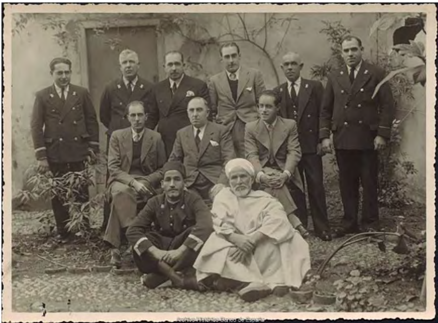
Empleados de la sucursal de Tánger. 1936.