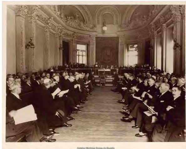
Reunión de la Junta General de Accionistas en 1935.

curiosamente, son las únicas fotografías conocidas de un evento similar. Aunque se desconoce la razón de tal circunstancia, ello concede al reportaje realizado un valor testimonial único en lo que se refiere a un evento de este tipo. La reunión se celebró en el Salón de Juntas Generales de Accionistas, donde los miembros del Consejo de Gobierno se situaban en un estrado elevado tras las mesas dispuestas en posición de semicírculo bajo la presidencia del gobernador y los subgobernadores del Banco. En posición centrada se disponían los bombos de votación. El resto de la sala estaba ocupado por los accionistas asistentes, que se sentaban en bancos enfrentados en dos bloques, dispuestos de modo transversal a la mesa presidencial. El gobernador, Alfredo Zavala Lafora, posa junto al subgobernador 1º, Pedro Pan Gómez, el subgobernador 2º, José Suárez-Figueroa Serrano, y los consejeros José González Pintado Hermoso, Francisco Aritio Gómez, José Varela de Limia y Menéndez, vizconde de San Alberto y Lorenzo Martínez Fresneda Jouvé, entre otros. Tras la mesa presidencial, donde en otras épocas lucía el retrato del rey reinante, se reconoce un tapiz con el escudo de España republicano. Las fotografías muestran el Salón de Juntas Generales de Accionistas en su aspecto primigenio y solo un año antes de la reforma que modificaría por completo la sala, eliminado todo el programa iconográfico realizado en escayola por el escultor Francisco Molinelli en 1891.