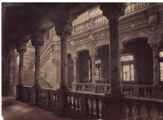
Madrid. Escalera principal del edificio del Banco de España. 1891. Fotógrafo J. Laurent y Cía. Positivo de Juana Roig Villalonga [entre 1915 y 1930].