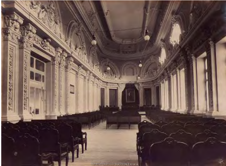
Madrid. Salón de Juntas Generales de Accionistas en Madrid. 1891. Fotografía J. Laurent y Cía. Positivo de Juana Roig Villalonga [entre 1915 y 1930].

Mayor valor testimonial aún adquiere la fotografía de Laurent del Salón de Juntas de Accionistas, al haber sido completamente transformado el espacio en una reforma de los años treinta del siglo XX, realizada por el arquitecto Juan de Zavala, que hizo desaparecer, de modo irrecuperable, el programa iconográfico en escayola original del edificio, basado en la utilización de elementos mitológicos alusivos a la fuerza, el dinero y el comercio.