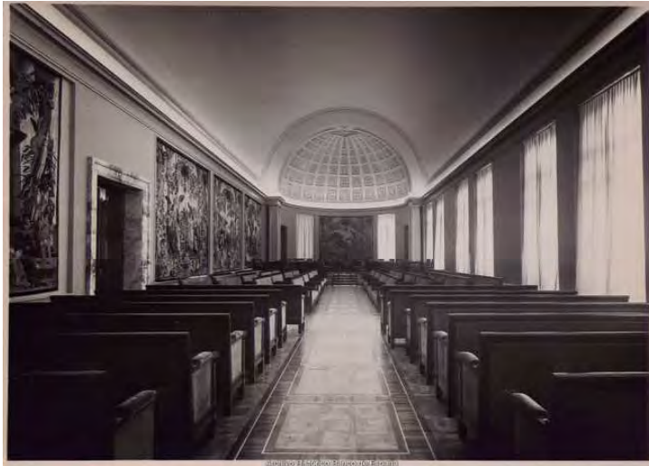
Madrid. Salón de Juntas Generales de Accionistas reformado. 1936.