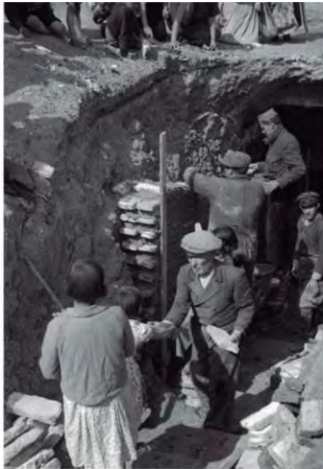
Fondo Gerardo Contreras. Construcción de refugios urbanos. Madrid, febrero 1938. Signatura 131807

A finales de los años 20, funda, junto a Alejandro Vilaseca, la Agencia Contreras y Vilaseca , situada en la calle Apodaca, nº 9 de Madrid, especializada en el suministro de material gráfico a los periódicos ilustrados madrileños, destacando las aportaciones a Estampa y Ahora .