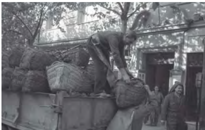
Fondo Cristóbal Portillo. Descargando carbón. Madrid 1959. Signatura 101340

El fondo ha sido organizado y descrito y, por el momento, es accesible de forma presencial en el ARCM, en donde puede consultarse un inventario formado por 65.676 registros descriptivos. La digitalización de este fondo ha comenzado a finales de este año 2022.