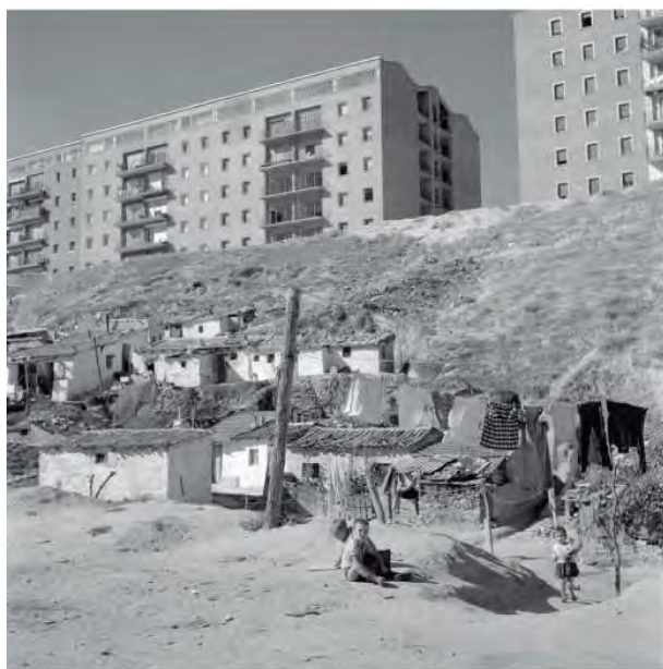
Chabolas y nuevos barrios. Madrid, 1955-1965. Signatura 119625.

Otro de los rasgos que caracteriza este tipo de fondos es la presencia de registros de control (libros registros, ficheros, listados, álbumes de contactos), normalmente elaborados por el propio autor como herramienta de trabajo que le permitía al fotógrafo controlar y recuperar las imágenes producidas en un momento determinado. Se considera esencial para el tratamiento posterior del