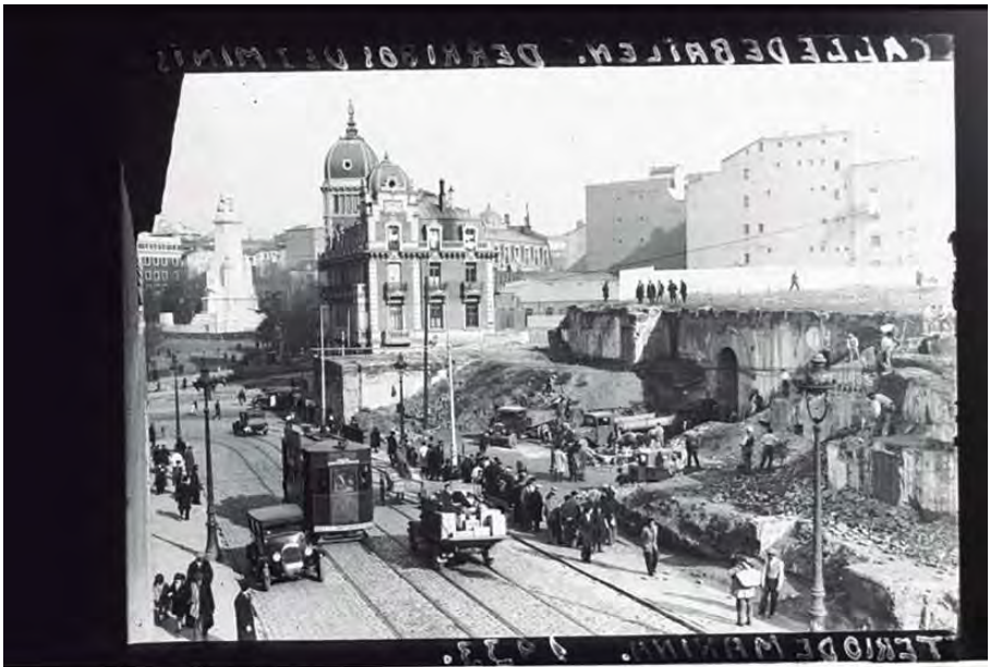
Derribo de varias edificaciones del antiguo Ministerio de la Marina en la c/Bailén. Madrid, 1933. Signatura 42304