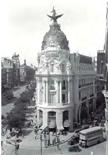
Fondo Cristóbal Portillo. Edificio Metrópolis. Madrid, 1947. Signatura 94034

No ha sido, ni está siendo, un camino fácil. La profesión de archivero se ha orientado tradicionalmente hacia el tratamiento de grandes volúmenes de documentos textuales de cualquier época, soporte y formato, por lo que enfrentarnos a fondos compuestos por imágenes supone para el archivero un reto profesional apasionante.