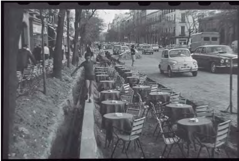
Fondo Martín Santos Yúbero. Terrazas y obras en la calle Serrano. 1965 Signatura 23712

Hasta el momento son 6 los fondos de fotógrafos profesionales que se custodian en el ARCM, cuya suma en torno a 1,5 millones de imágenes convierte a esta agrupación en la más voluminosa del centro.