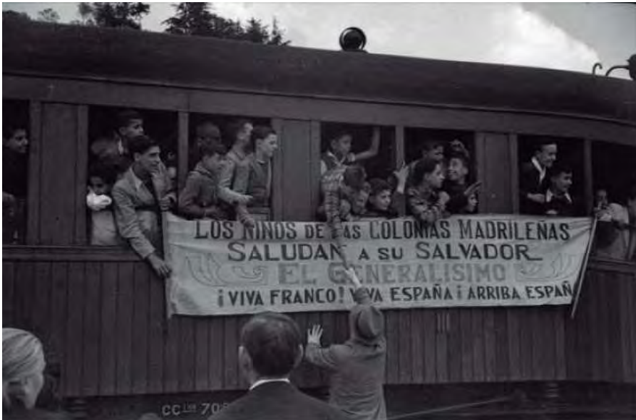
Llegada de niños procedentes de colonias de evacuación a la estación del Norte. Madrid, mayo 1939. Signatura 131859