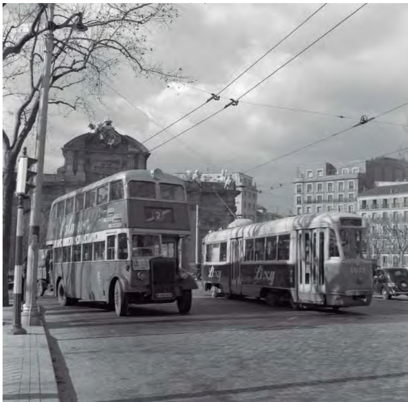
Transporte público en Madrid. [1950-1960 fechas aproximadas. Signatura 119657