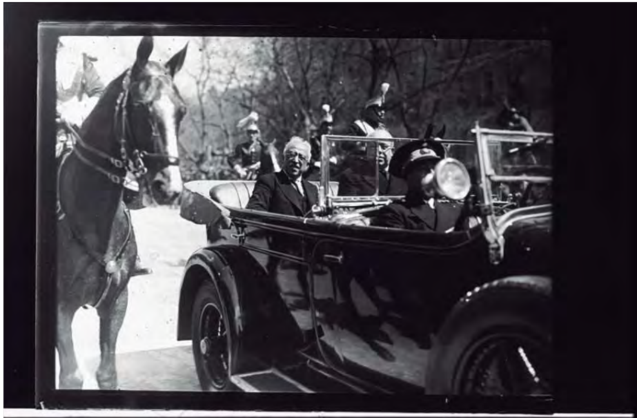
Azaña y Alcalá Zamora en coche descubierto por la Castellana durante el desfile conmemorativo del aniversario de la II República. Madrid, 14 abril 1932. Signatura 43013

años 1920 y 1987, que han sido descritas y digitalizadas en su totalidad en un inventario compuesto por 46.080 registros descriptivos; que se organizan siguiendo el registro de control del propio fotógrafo.