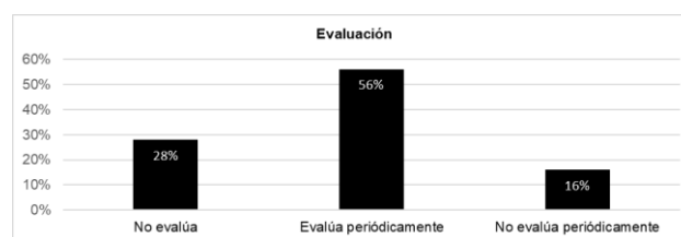
Figura 2. Porcentaje de profesionales que evalúan sus programas AFD con personas con discapacidad.

Los datos de género muestran resultados similares entre hombres y mujeres que planifican sus programas de AFD con personas con discapacidad. En el caso del factor edad, quienes tenían entre 45 y 70 años (78%) eran los más propensos a planificar y los que tenían entre 16 y 29 años (56%) eran los menos. Según los datos de experiencia, la planificación tuvo mayor porcentaje entre los profesionales de AFD con experiencia.