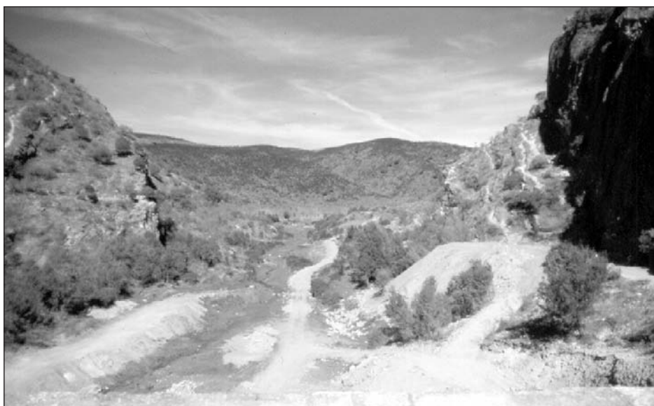
Figura 1. Vista de la presa del Pontón de la Oliva, en el Lozoya y vaso vacío y abandonado de la misma. Sicre propuso levantar su presa en la confluencia de dicho río con el Jarama, en el estrecho de Guesa, pero admitiendo otra posibilidad: «en Lozoya, a 2.500 varas al NNE de su unión con Jarama, cerrando un estrecho que llaman el Pontón de la Oliva [vista superior], para recogerlas en una concha que forman los montes [vista inferior]». Esa fue, precisamente, la solución que, años después, adoptaron Rafo y Ribera, dando origen al Canal de Isabel II, al que corresponden estas vistas.