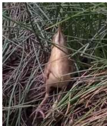
Figura 4. Garza mirasol ( I. exilis ) registrada en el relicto de humedal Madre de Agua.

Por otra parte, en el relicto de humedal se registraron especies típicas de ecosistemas acuáticos como Porphyrio martinicus , Phimosus infuscatus , Tringa solitaria , Butorides striata e I. exilis (figura 4). De esta última, en particular, se observó una subespecie endémica del altiplano cundiboyacense (Stiles et al. , 2000) que se encuentra en peligro crítico de extinción (Renjifo et al. , 2016). En efecto, la última vez que se había reportado una población de esta ave, conocida como garza mirasol, fue en la laguna La Herrera en zonas rurales del municipio de Mosquera (Rosselli y Stiles, 2012), y se le atribuye una extinción local en Bogotá debido a que sus últimos registros han sido en zonas periféricas de la ciudad (Stiles et al. , 2021; Zuluaga-Carrero, 2023). Por lo tanto, la detección de esta especie en el área evaluada es muy relevante ya que corresponde a una zona altamente urbanizada del interior de la capital.