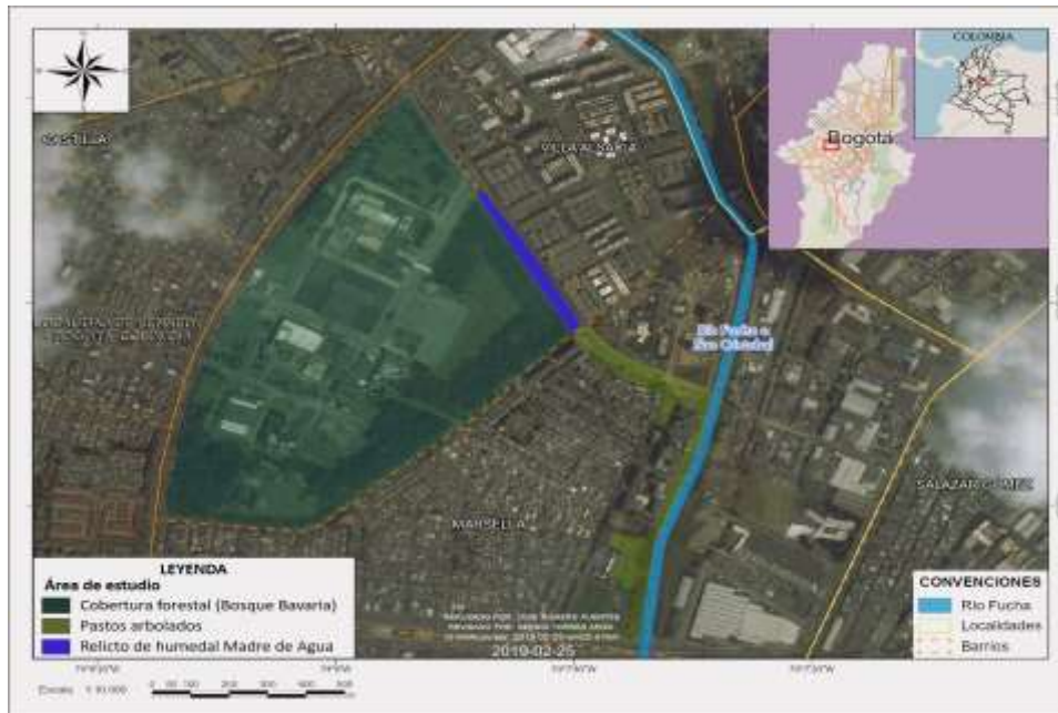
Figura 1. Área de importancia ecológica Madre de Agua.

El área de importancia ecológica está ubicada al suroccidente de Bogotá, en la localidad de Kennedy, dentro de una matriz altamente urbanizada ( 4^{\circ}38'15,76'' N, 74^{\circ}7'42,74'' W), a una altitud de 2 550 m. Está conformada por una cobertura forestal mixta con especies nativas denominada por la comunidad como Bosque Bavaria, un relicto de humedal, áreas de pastos arbolados y la ronda del río Fucha, que en conjunto abarcan un área total de 90 ha aproximadamente (figura 1). Al occidente se encuentran dos reservas distritales de humedal: Techo, a 0,8 km de distancia, y El Burro, a 1,3 km.