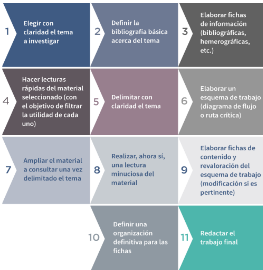
Figura 1. Procesos de investigación Documental.

Carmen Isabel Colcha-Meléndrez; Zila Isabel Esteves-Fajardo