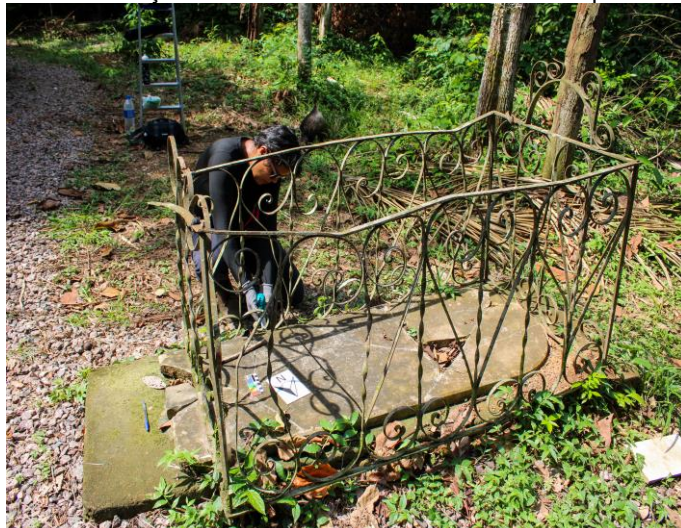
Foto de Youssef Hijazi Zaglhout, tirada em 23 de novembro de 2020.