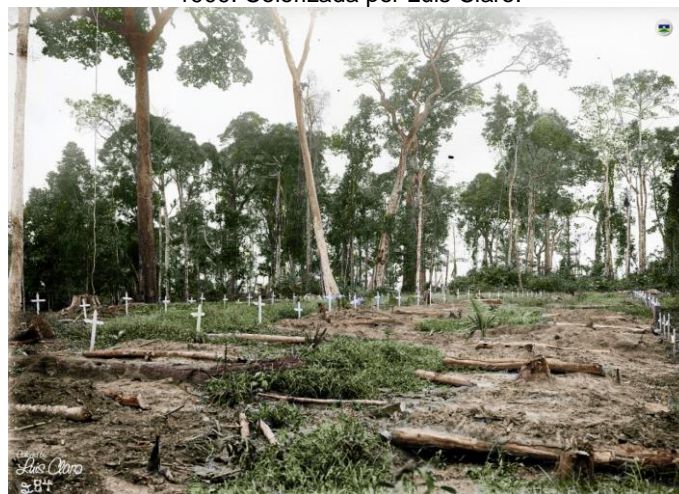
Figura 8 – Cemitério da Candelária visto a partir do hospital homônimo. Foto de Dana Bernard Merrill, 18 de maio de 1909. Colorizada por Luis Claro.

Disponível em: https://br.pinterest.com/pin/760123243342811063/ .