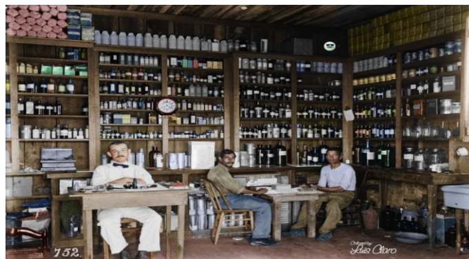
Figura 1 – Farmácia do hospital da Candelária. Na imagem vemos o farmacêutico à esquerda, enquanto seus auxiliares (à direita) preparam um composto que parece quinina. Foto de Dana Merrill, 1910. Colorizado por: Luis Claro.

Disponível em: https://br.pinterest.com/pin/76012324335886400/