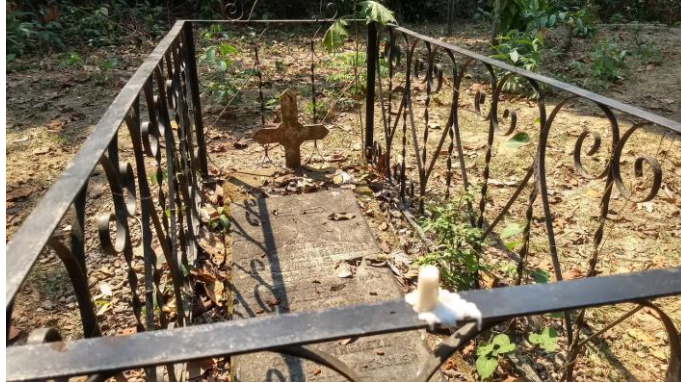
16 de agosto de 2021.