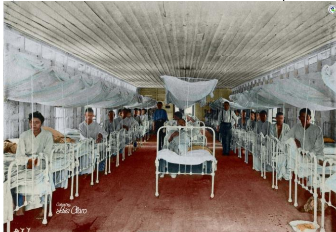
Figura 9 – Enfermaria do Hospital da Candelária com os trabalhadores enfermos em tratamento. Foto de Dana Bernard Merrill, tirada em 17 de maio do ano de 1909. Colorizada por Luis Claro.

Disponível em: https://br.pinterest.com/pin/760123243335205218/ .