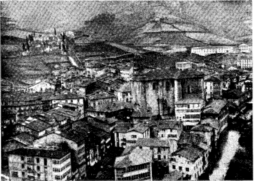
Una vista de Eibar hacia 1920, de la zona correspondiente al primitivo casco urbano de la villa