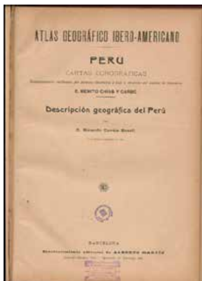
Figura 3. Portada del Atlas Geográfico del Perú.