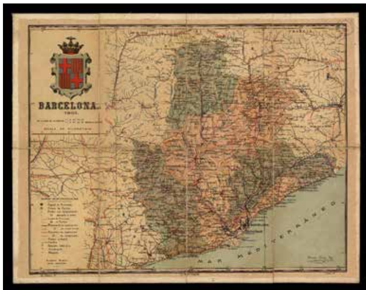
Figura 2. Provincia de Barcelona del Atlas geográfico de España (Cartoteca del ICGC, RM.16672).

Cada volumen está firmado por un autor local de prestigio y la información se basa en estadísticas oficiales proporcionadas por distintas instituciones públicas. Todos ellos contienen mapas de las regiones de cada uno de los países descritos. Cabe destacar que se trata de una cartografía de diseño único para todos los volúmenes, de manera que podemos hablar de una colección de cartografía de regiones iberoamericanas que, desgraciadamente no se llevó a cabo en su totalidad. Los volúmenes publicados son los siguientes: