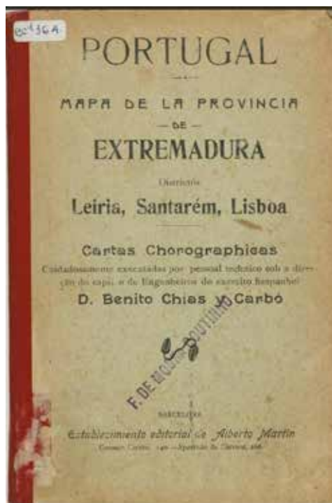
Figura 9. Cubiertas de la hoja de la provincia de Extremadura correspondiente al Atlas Geográfico de Portugal destinadas a la comercialización por separado (Biblioteca Nacional de Portugal, CC d 364).