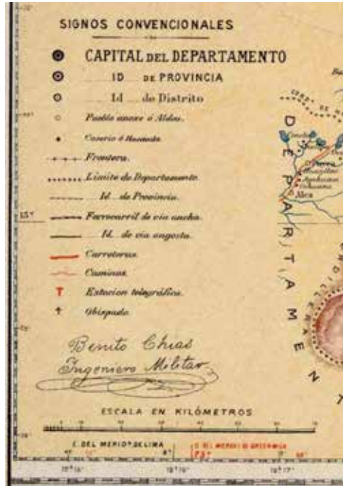
Figura 4. Signos convencionales de la hoja del departamento del Cusco correspondiente al Atlas Geográfico del Perú.

la utilización por parte de la editorial de la denominación Cartas Chorographicas al referirse a mapas dibujados en un gabinete a partir de otra cartografía.