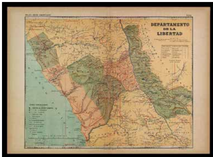
Figura 10. Hoja del Departamento de La Libertad correspondiente al Atlas Geográfico del Perú (Cartoteca del ICGC, R.23764).

Pese al fracaso editorial en el continente americano, los atlas iberoamericanos de la editorial Alberto Martín nos revelan la existencia de consumidores de cartografía, principalmente a partir de la segunda mitad del siglo XIX. Mas allá de los usos oficiales y técnicos del mapa, productos como estos atlas son coleccionados semanalmente o adquiridos por volúmenes por un público interesado en la lectura de obras ilustradas de geografía sobre todo ilustradas con cartografía detallada y actualizada.