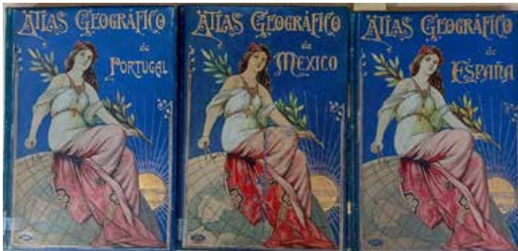
Figura 1. Cubiertas de los atlas geográficos correspondientes a Portugal, México y España. El diseño es obra de José Roca (Cartoteca ICGC, R.2527, R.8849, R.2075).

Geográfico Ibero-Americano . El origen de la colección se halla en la publicación del Atlas geográfico de España , que empezó a distribuirse en 1901. Los primeros sesenta y dos fascículos publicados estaban dedicados exclusivamente al territorio español, pero a partir del fascículo sesenta y tres, hacia 1903, se cambia el título de la obra, que pasa a denominarse Atlas Geográfico Ibero-Americano , y, al cabo de pocas semanas, empezaron a publicarse los fascículos correspondientes a Portugal, en este caso en edición bilingüe portugués-español. No se sabe el motivo de este cambio de rumbo ni cuántos volúmenes se proyectaron, aunque todo indica que se trataba de una colección que debía abarcar todos los países de habla oficial castellana y portuguesa. La publicación de obras referidas a este vasto espacio lingüístico responde a una de las estrategias comerciales de la mayoría de las editoriales barcelonesas que, por aquellos años, se estaban expandiendo por todo el mercado latinoamericano. Posiblemente con este atlas la editorial Alberto Martín vio la posibilidad de introducirse en él.