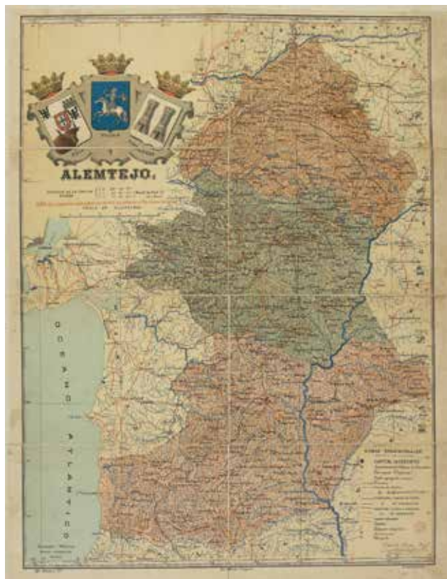
Figura 8. Hoja de la provincia de Alentejo correspondiente al Atlas Geográfico de Portugal (Cartoteca del ICGC, R.2527).