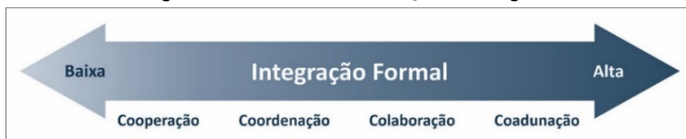
Figura 2 – Continuum de Alianças Estratégicas