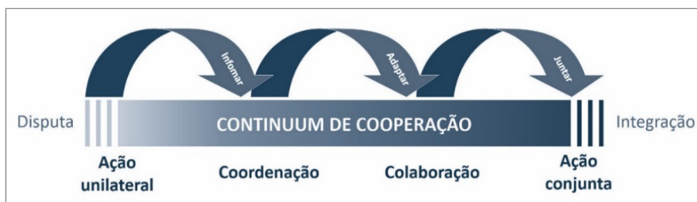
Figura 3 – Continuum de Cooperação

Fonte: Sadoff e Grey (2005, p. 424, tradução nossa).