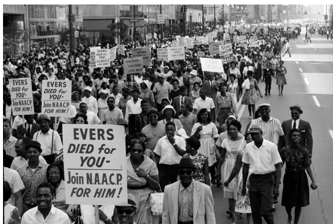
Figura 2. El 12 de junio de 1963, el líder del movimiento de los derechos civiles Medgar Evers fue asesinado por un supremacista blanco en su casa de Decatur, Misisipi. Su muerte provocó indignación en todo el país. Ese mismo mes, los participantes de la marcha de la libertad de Detroit, Míchigan, llevaron pancartas en honor de Evers.

Medgar Evers dirigente de la NAACP (Asociación Nacional para el avance de la gente de color) fue asesinado en Misisipi el mismo día que John Kennedy hablara por televisión para defender la lucha por la igualdad de los derechos civiles para toda la población, sin discriminación de ningún tipo. Con esa consigna, en agosto de 1963, 250 mil personas marchan en Washington. Poco tiempo después, el 22 de noviembre, Kennedy fue asesinado. 6