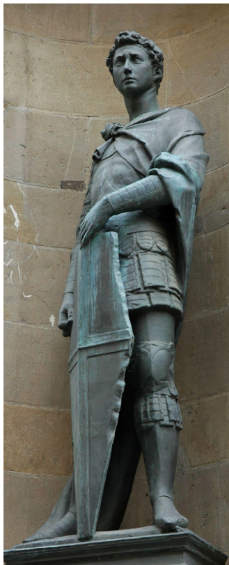
Figura 3. Copia de bronce de San Jorge de Donatello (1416), ubicada en Orsanmichele, Florencia.

Cabe mencionar que, otros autores, ya han relacionado a San Jorge con la cultura egipcia, y lo hicieron a través de la figura de Horus. Muchos de estos artículos sirvieron de inspiración para la realización