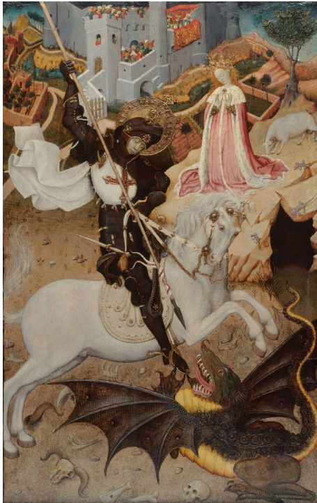
Figura 2. San Jorge matando al dragón. Instituto de Arte de Chicago. Bernat Martorell. 1434-1435. Fuente.