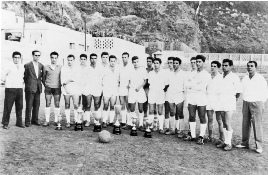
Jugadores del Tenisca «de las seis copas» con los trofeos, temporada 1959-1960