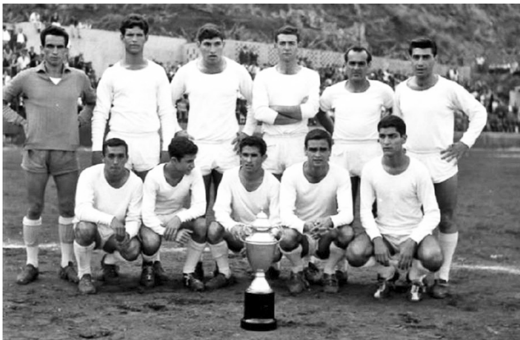
Formación de la S. D. Tenisca con trofeo