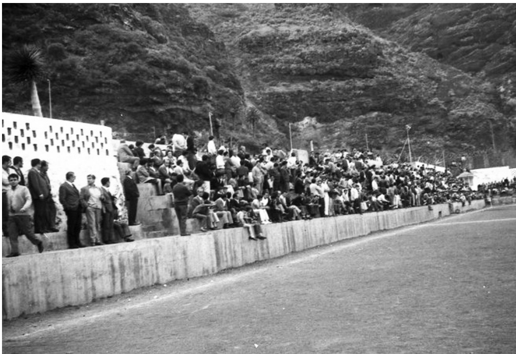
Aspecto habitual de la tribuna de Bajamar en los años 60 [SDT]