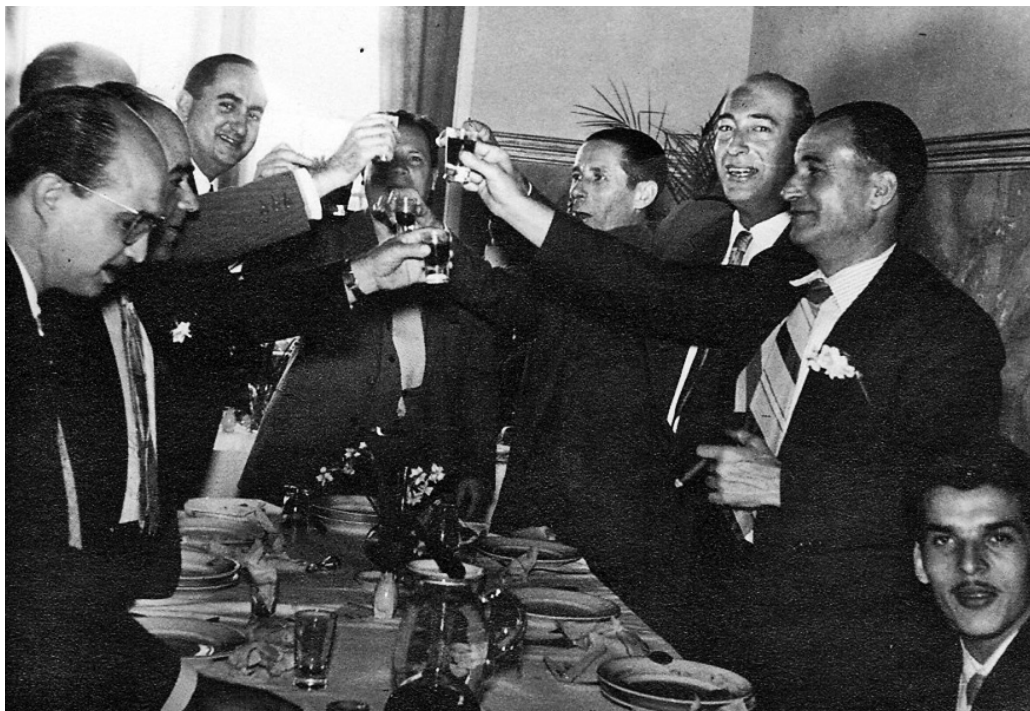
Celebración de un aniversario de la S. D. Tenisca, década de 1950 [SDT]