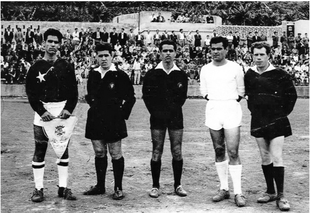
La S. D. Tenisca hace entrega de un banderín conmemorativo al Estrella, década de 1960 [SDT]