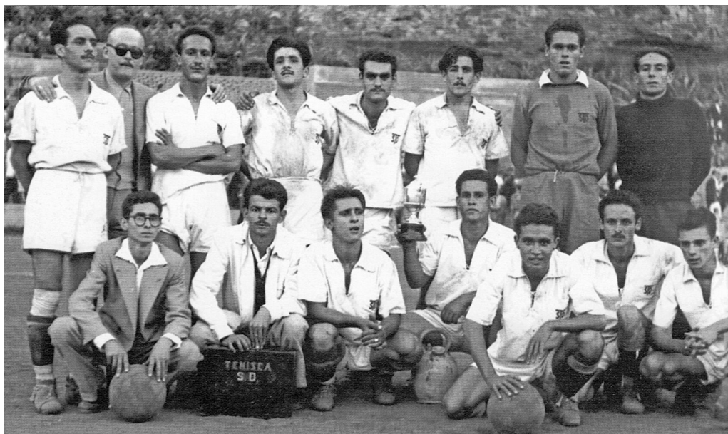
Formación de la S. D. Tenisca, década de 1950 [SDT]