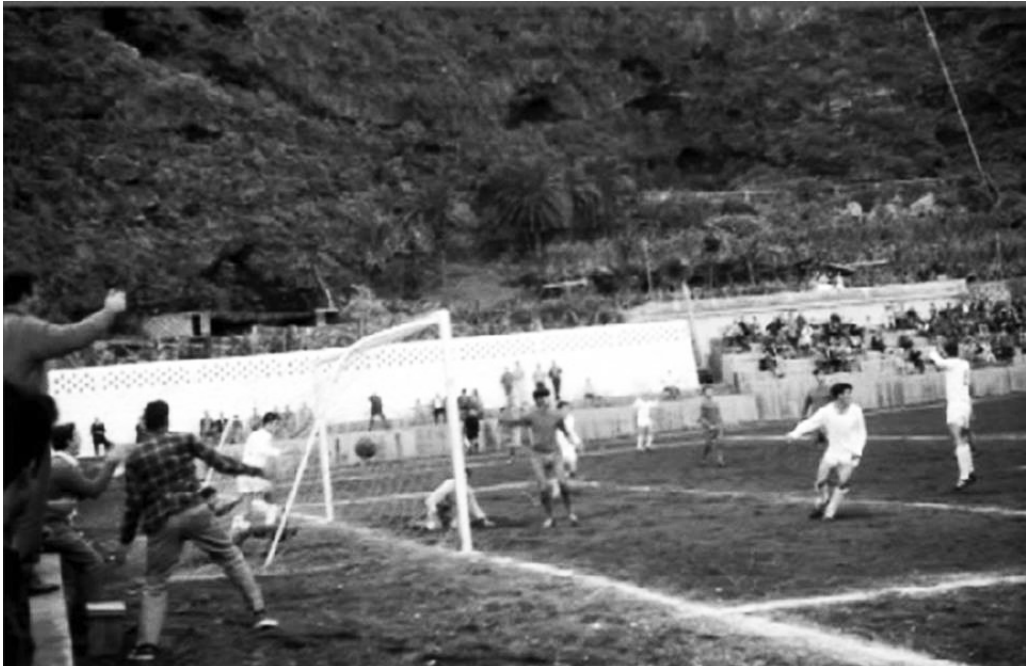
Gol de la S. D. Tenisca en el fondo sur de Bajamar, década de 1960 [SDT]