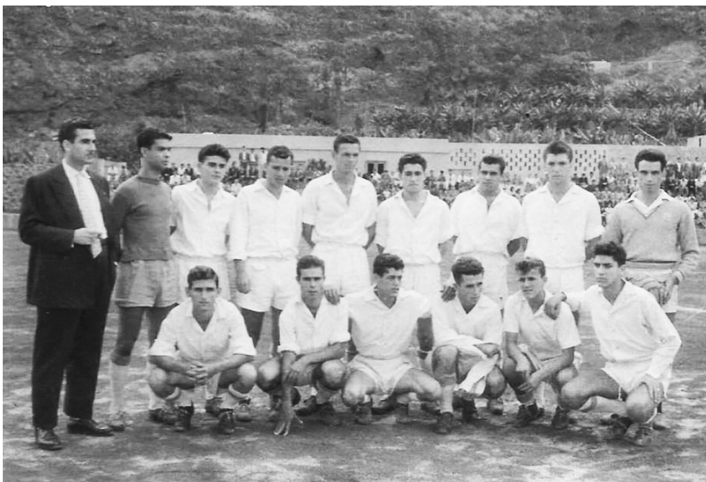
Formación de la S. D. Tenisca, década de 1960 [SDT]