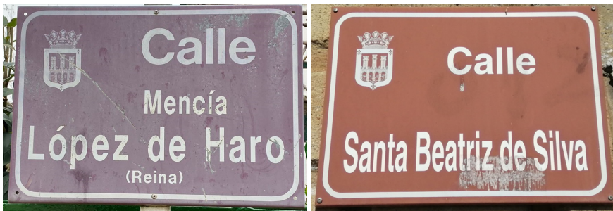
Imagen. Placas de las calles Mencía López de Haro y Santa Beatriz de Silva.