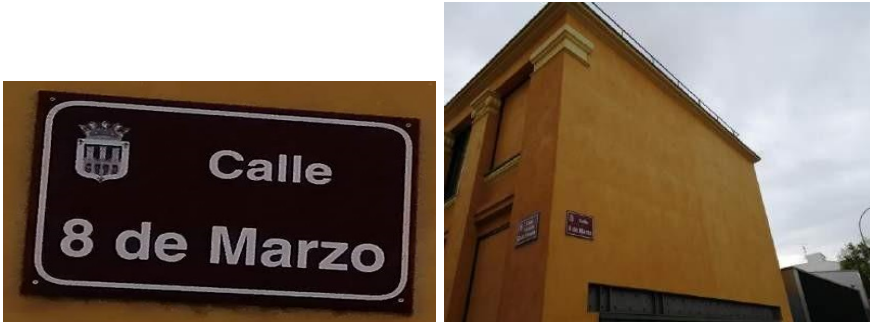
Imagen. Placa de la calle 8 de Marzo y de la Biblioteca Rafael Azcona.

El 31 de agosto de 2016 la Junta de Gobierno Local aprueba renombrar seis calles en recuerdo a franquistas, y así, la calle Coronel Innerarity cambia a Beata María Pilar Izquierdo 24 . El 11 de julio de 2018 se cambian otras tres calles, y Defensores de Villarreal pasa a denominarse 8 de Marzo, junto a la Biblioteca Rafael Azcona.