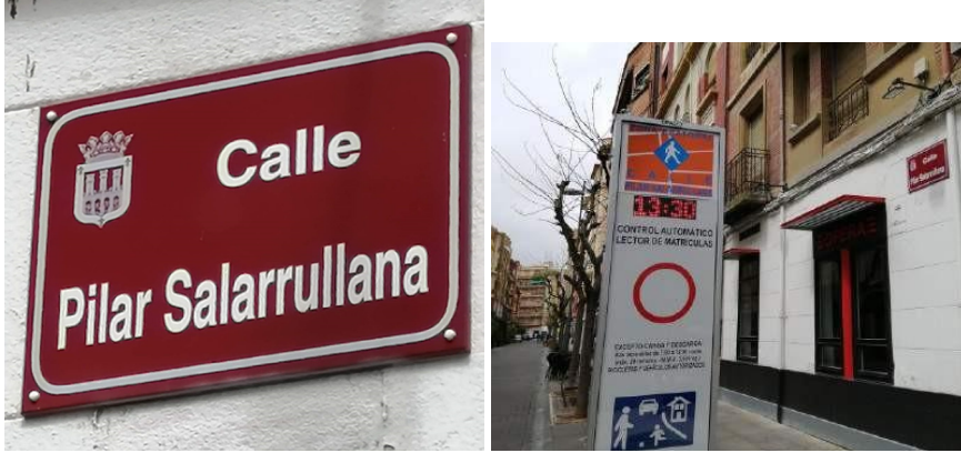
Imagen. Placa y vista de la calle Pilar Salarrullana.

pp. 3.091-3.104; Bermejo Martín, 2018, pp. 149-150), Rosa Chacel 26 y Margarita Salas 27 .