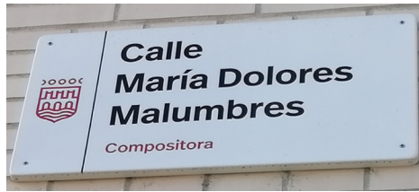
Placa de la calle María Dolores Malumbres.