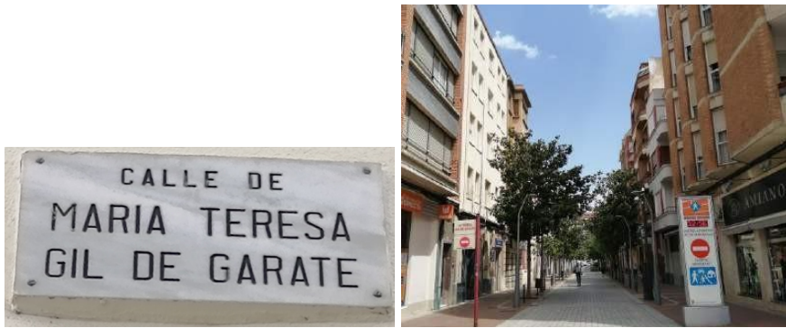
Imagen. Placa y vista de la calle María Teresa Gil de Gárate.