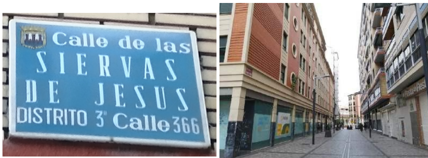
Imagen. Placa y vista de la calle de las Siervas de Jesús.

del “cólera morbo asiático” que asoló la ciudad y abarrotó el cementerio municipal (Jiménez Martínez, 1987, p. 329; Jiménez Torres, 2011, pp. 741-742) 19 . Esta calle fue peatonalizada en 2010, dando seguridad a los peatones junto con la calle Bretón de los Herreros.