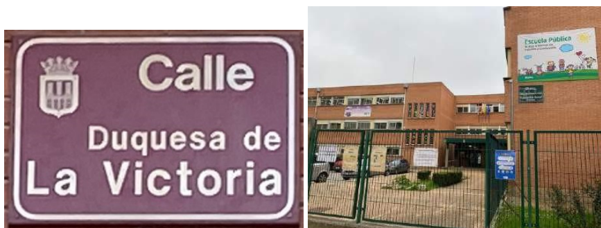
Imagen. Placa y colegio Duquesa de la Victoria.

Se conoce con este nombre desde finales del siglo XIX, pero se oficializó en torno a 1915. Esta calle se desarrolló con el derribo de las murallas y la construcción de la plaza de toros, en el entorno del convento del Carmen, alargándose conforme se iban construyendo nuevas edificaciones a lo largo de lo que será Avenida de Colón, hasta la actual Obispo Fidel García. Por el caso se denominó originalmente Avenida Plaza de Toros, construida en 1863 y destruida por un incendio en 1914 (Cerrillo Rubio, 1987, pp. 50-51, 123-128).