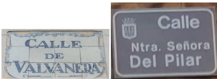
Imagen. Placas de las calles de Valvanera y Nuestra Señora del Pilar.

La Plaza Virgen de la Esperanza se encuentra en el tramo final de la calle República Argentina y fue construida entre 1954 y 1955, en pleno auge de la construcción provocado por la vía del ferrocarril (Jiménez Torres, 2011, p. 788).