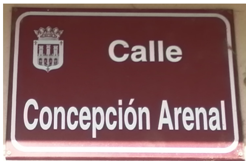
Imagen. Placa de la calle Concepción Arenal en El Campillo.

en el Parlamento de La Rioja, debido a que se aprobó mediante Decreto de la Presidenta 32 .