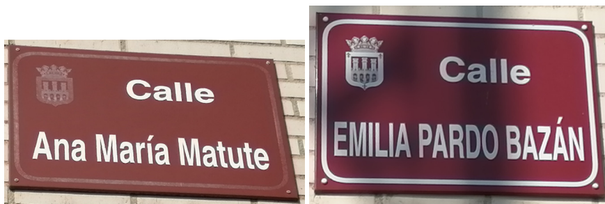
Imagen. Placas de las calles dedicadas a las escritoras Ana María Matute, Emilia Pardo Bazán y M a Teresa León en el barrio de El Campillo.