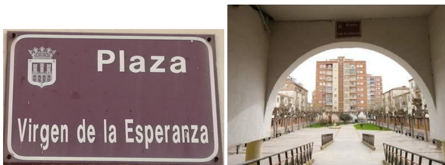
Imagen. Placa y vista de la calle Virgen de la Esperanza.

Encontramos un grupo de calles dedicadas a religiosas y vírgenes, entre las que caben destacar los espacios dedicados a las patronas: la patrona de Logroño, la Plaza Virgen de la Esperanza; la de España tiene la calle Nuestra Señora del Pilar 15 (Jiménez Martínez, 1987, p. 259; Jiménez Torres, 2011, pp. 526-527); la de La Rioja, la Virgen de Valvanera, perpendicular a la calle Portales (Jiménez Torres, 2011, pp. 769-771), y también la Virgen de la Merced, cuyo antiguo convento del siglo XVI da cabida actualmente al Parlamento de La Rioja (Jiménez Martínez, 1987, p. 237).