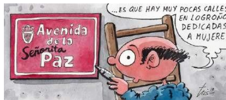
Imagen. Viñeta de Tris, La Rioja , 28 de noviembre de 2019.

La conclusión hasta ahora es que había 47 calles dedicadas a mujeres entre el total de 652, lo que suponía el 7% del callejero. El dibujante Tris, siempre con su humor en forma de viñeta, reivindicaba este pobre porcentaje en una de sus viñetas diarias del periódico La Rioja .