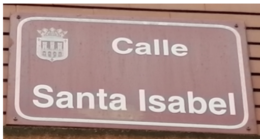
Imagen. Placa de la calle Santa Isabel.

El 22 de marzo de 1948 se da un nuevo nombre a la calle particular que da acceso al chalé en la que sería denominada Calle Santa Isabel, en la zona del ensanche de la capital con Vara de Rey y Menéndez Pelayo (Jiménez Martínez, 1987, p. 162; Jiménez Torres, 2011, pp. 727-728).