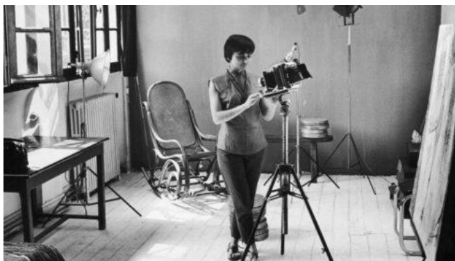
Agnès Varda, al seu estudi de la rue Daguerre, Paris.

Durant la dècada de 1960, la consciència política d'algunes intel·lectuals, sota l'impuls de la Segona Onada Feminista, va cridar l'atenció sobre l'absència d'escriptores, de pintores i de compositores en els respectius cànons artístics. El xoc amb la cultura patriarcal s'havia produït, i el que resultava urgent tot seguit era contar les coses des de l'altre punt de vista, el femení. Pel que fa al cinema, la joventut del mitjà feia que encara no se'n tinguera una història plenament institucionalitzada, però això no va evitar que teòriques com E. Ann Kaplan o Laura Mulvey hi identificaren el mateix ordre simbòlic masculí. En primer lloc, van denunciar una obvietat: hi havia a penes dones cineastes, fruit del sexisme existent en la indústria de fer pel·lícules. Però, tanmateix, la realitat contrasta amb el que ja s'estava començant a explicar, perquè avui se sap que durant els orígens del cinema moltes dones van treballar com a guionistes, muntadores i, fins i tot, directores. El problema és que rarament van estar acreditades, a causa de les nefastes inèrcies patriarcals.