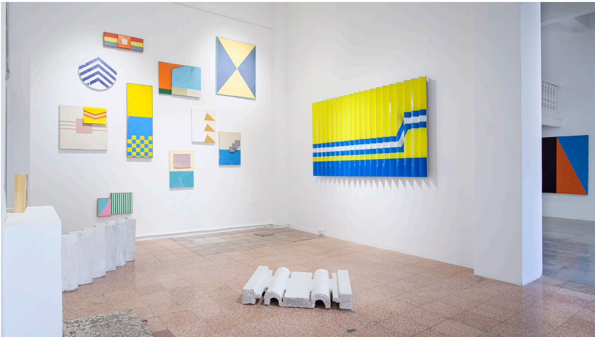
Figura 1. Fotografía de Trópico Informal de David Orbea en Casa del Barrio Guayaquil.

Los ejercicios pictóricos de David Orbea se han caracterizado por la simplificación de las formas que encuentra en muy distintos registros comunicacionales, desde fotografías de prensa hasta productos comerciales. En algunas de sus series este propósito adquiere características formales ligadas a la abstracción, pero conservando su capacidad de comentar la realidad circundante.