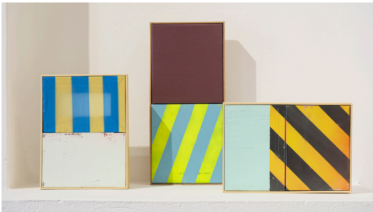
Figura 2. Fotografía de Trópico Informal de David Orbea en Casa del Barrio Guayaquil.

de patrones y colores que configuran la ciudad como un chocante pastiche. La serie la titula Postales justamente por una aproximación donde enfoca la abstracción como una superestructura donde se asientan el resto de elementos que conforman la representación del entorno. Orbea en cierto modo separa la paja del grano al prescindir de los excesos de realidad, seleccionando y editando tramos de aquella red sobre la cual se implanta todo lo demás. Con esto en mente podemos entender la exposición como un gran paisaje urbano que ha sido abreviado, sintetizado... abstraído.