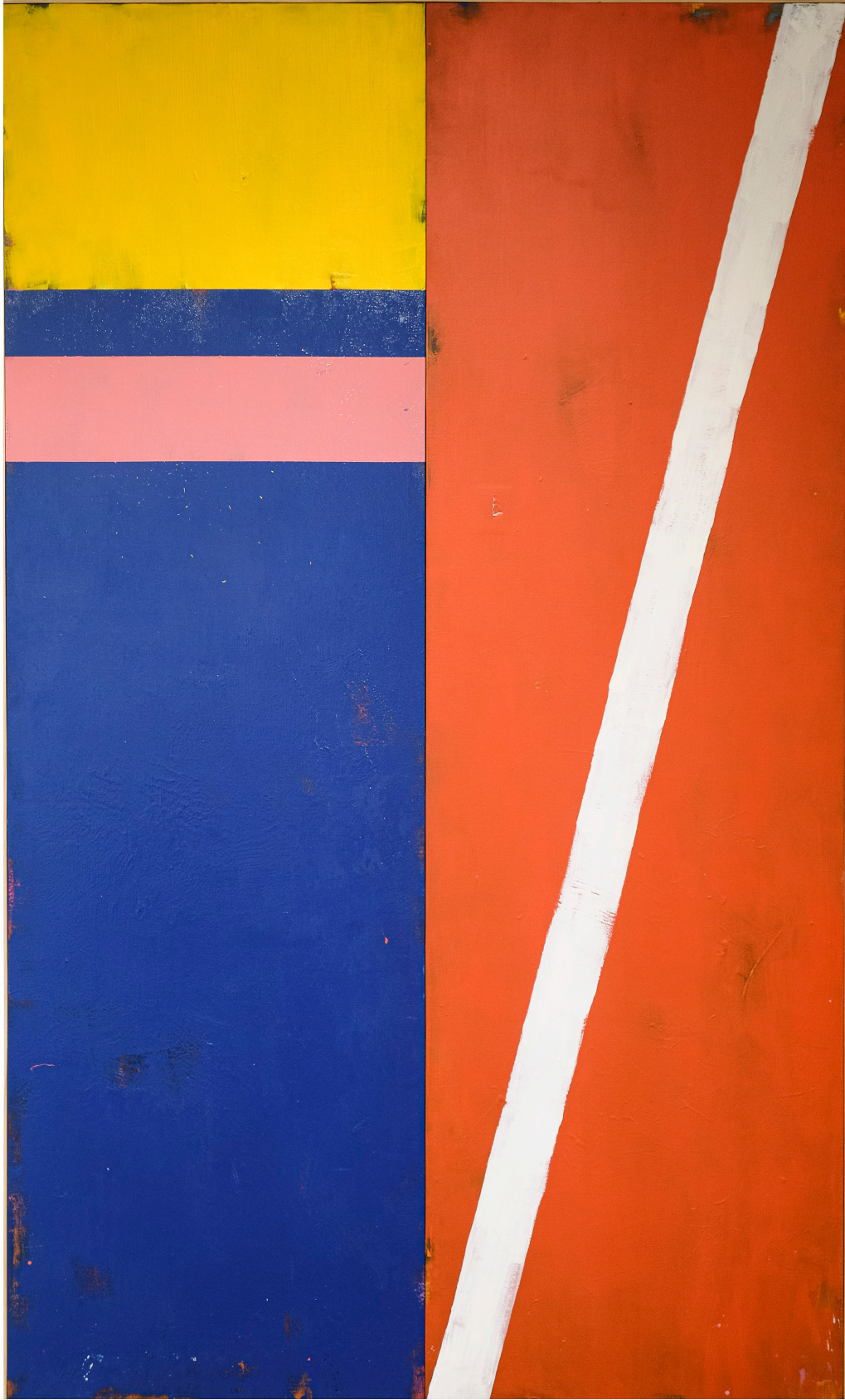
Figura 3. Fotografía de Trópico Informal de David Orbea en Casa del Barrio Guayaquil.