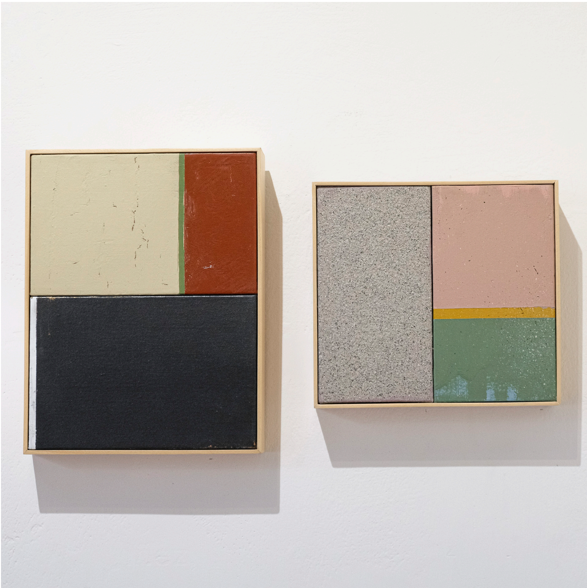
Figura 5. Fotografía de Trópico Informal de David Orbe en Casa del Barrio Guayaquil. Fotografías de Ricardo Bohórquez, 2023.