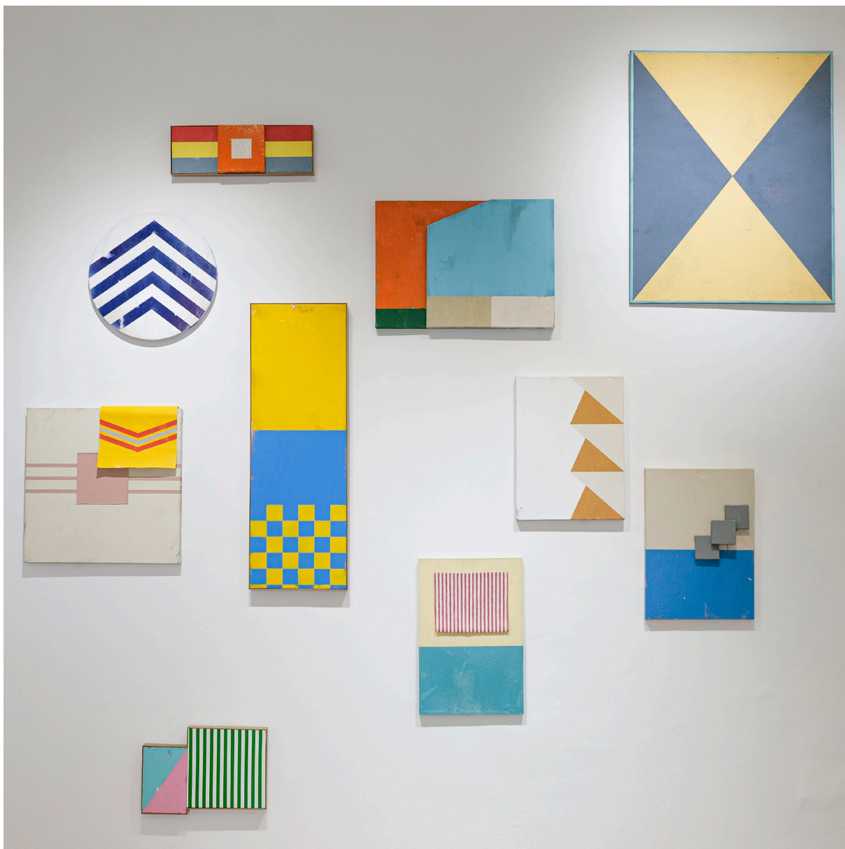
Figura 4. Fotografía de Trópico Informal de David Orbea en Casa del Barrio Guayaquil. Fotografías de Ricardo Bohórquez, 2023.