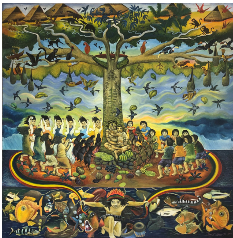
Figura 7. Brus Rubio Churay “La raíz de mi mundo” Móniya Amena (2014). Acrílico sobre tela (100 x 100 cm).