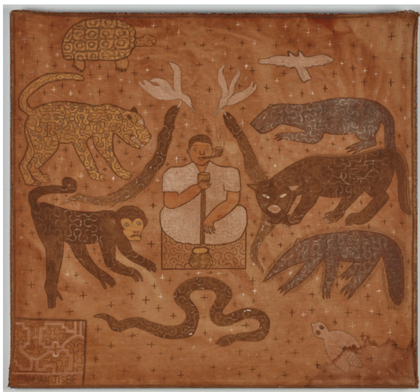
Figura 9. Elena Valera "Bawan Jisbe" de la serie Visiones del chamán (1999). Tintes naturales sobre tela (69,5 x 75 cm). Colección Gredna Landolt