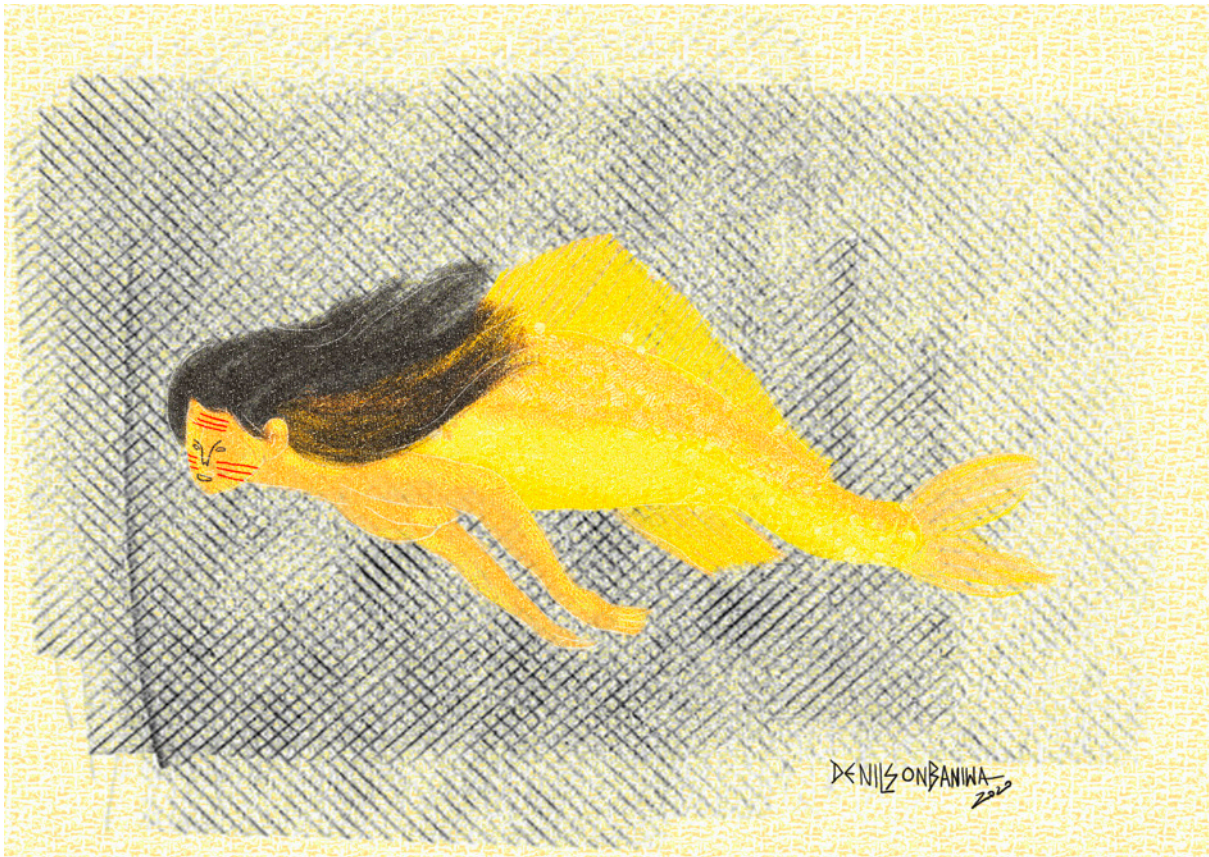
Figura 3. Denilson Baniwua. “Sukuryu-Tapuya” (2019). Grabado digital, tamaños variables