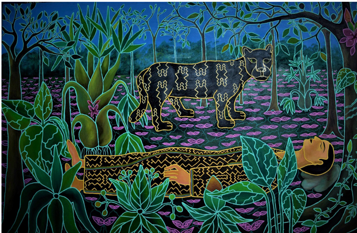
Figura 8. Chonon Bensho "O sonho do dietador" (2018). Óleo sobre tela (150 x 95 cm).