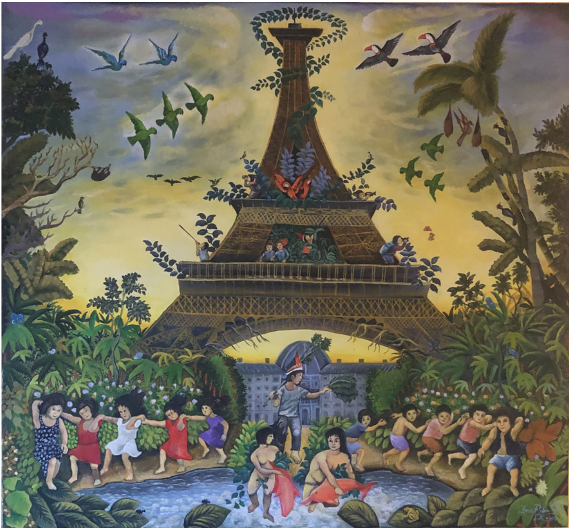
Figura 10. Brus Rubio Churay “Pasaporte amazónico” (2014). Acrílico sobre tela (100 x 100 cm)