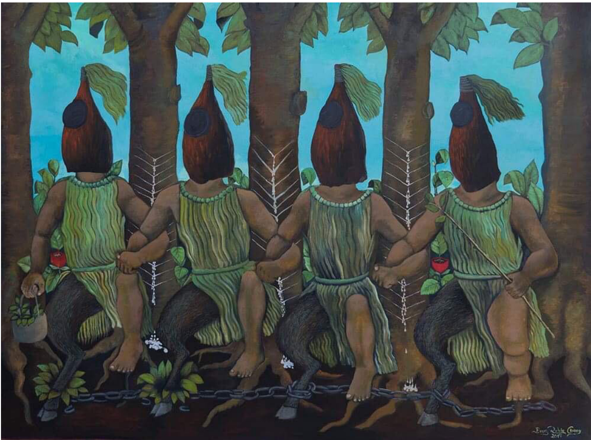
Figura 11. Abel Rodríguez, “La maloka” (2018). Acrílico sobre papel (50 x 70 cm). Fotografía María Paula Bastidas. Cortesía del artista y del Instituto de visión100 cm)