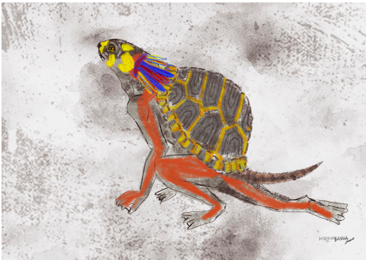
Figura 1. Denilson Baniwua, “Anory -Tapuya” (2019). Grabado digital, tamaños variables