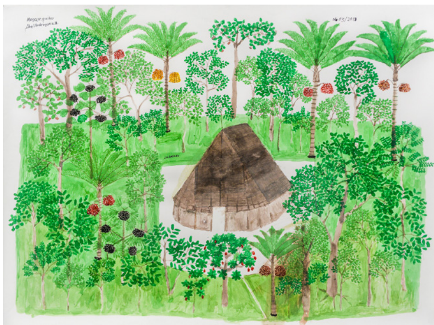
Figura 11. Abel Rodríguez, “La maloka” (2018). Acrílico sobre papel (50 x 70 cm). Fotografía Maria Paula Bastidas. Cortesía del artista y del Instituto de visión 100 cm)