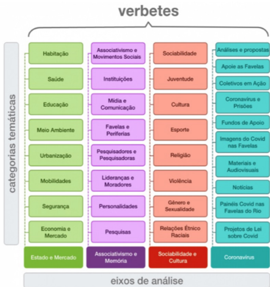
Figura 1 – Distribuição dos verbetes, categorias temáticas e eixos de análise do Wikifavelas – Dicionário Marielle Franco

Fonte: Página do Wikifavelas – Dicionário de Favelas Marielle Franco - Seção Organização e Conceitos.