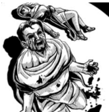
Figura 3 Edipo Rey

Nota. Adaptado de La belleza de lo trágico en Edipo Rey [Fotografía], por Juan Carlos Sosa Azpúrua, s.f. ( https://ideasjcsa.com/2020/11/17/la-belleza-de-lo-tragico-en-edipo-rey/ ).