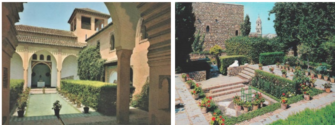
Zona palaciega y jardines de la Alcazaba de Málaga donde estuvo instalado el Museo Arqueológico Provincial