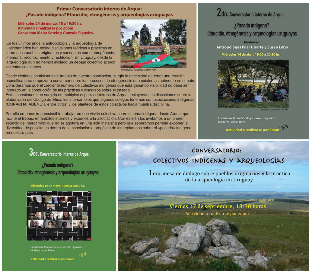
Figura 1. Carteles de difusión convocando a participar de las cuatro instancias de conversatorio

un papel instrumental en el activismo por el reconocimiento de la presencia indígena a nivel de la sociedad civil. La difusión de la actividad se extendió rápidamente, y en el conversatorio se conectaron representantes de un total de 15 agrupaciones, contándose un total de 54 asistentes entre arqueólogos e indígenas. Las comunidades que participaron fueron Comunidad Santo Domingo Soriano, Clan Gubaitasé Charrúa, Clan Rua La-at, Comunidad Jaguar Berá, ADENCH, Comunidad Guyunusa Tacuarembó, Comunidad Betum, Clan Choñik, Comunidad Guadaripí, Ineu o Guidaí Maldonado, Ineu o Guidaí Paso de los Toros, Comunidad Tacuabé Chasqui Oyendau, Basquadé Inchalá, Comunidad Tacua Oipik, Ahijuna y Charrúa Oipik.