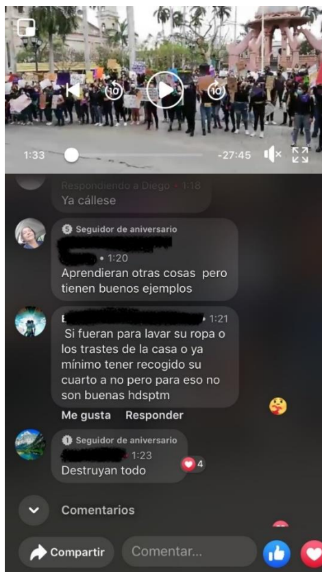
Imagen 4. Captura de pantalla 1:33