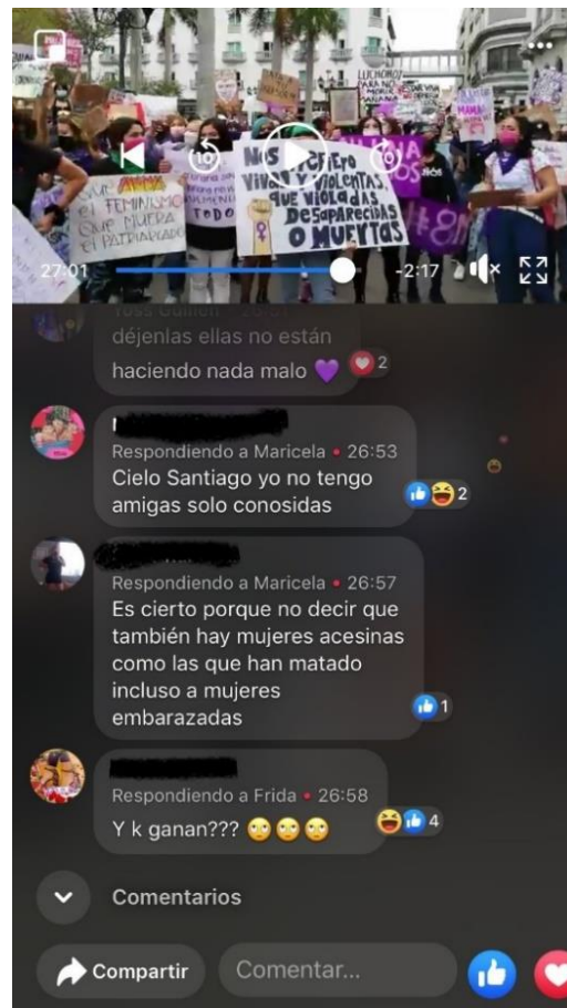
Imagen 2. Captura de pantalla 27:01