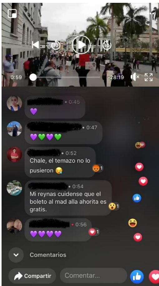
Imagen 1. Captura de pantalla 0:59