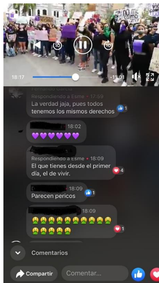
Imagen 3. Captura de pantalla 18:17