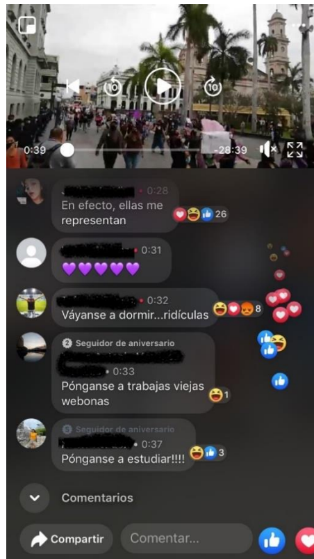
Imagen 5. Captura de pantalla 0:39