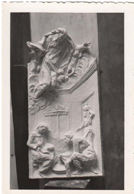
Fig.6. Boceto Nacimiento de la Virgen en burro.

Con respecto a la ejecución de sus relieves, su legado fotográfico permite constatar la forma de trabajar en los mismos. Él diseñaba un primer boceto y a partir de ahí realizaba las modificaciones correspondientes, hasta obtener el resultado deseado. Es el caso de la escena el Nacimiento de la Virgen, la figura que representa a Dios Padre aparecía en el primer boceto (fig.6) a la izquierda de la composición, tallado en altorrelieve, con cierto aire salzillesco, quizás realizado por el estilo imperante en la Murcia de los sesenta, presidiendo la escena, siendo el resultado final una figura más suave, dejando el protagonismo a la figura de la Virgen Niña (fig.7), siendo el resultado de la obra más renacentista.