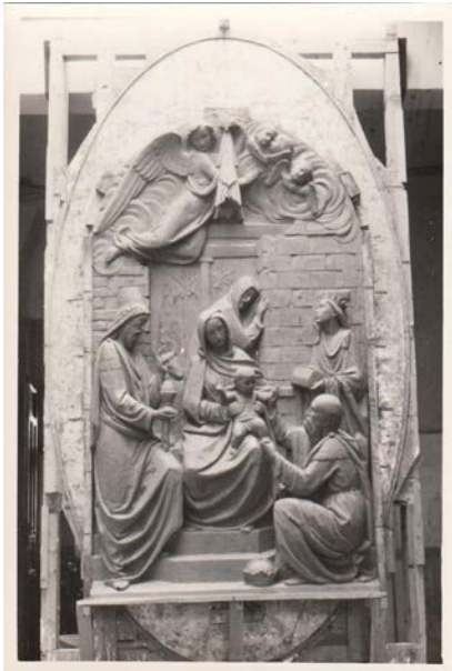
Fig.8. Boceto de la Adoración de los Reyes Magos.