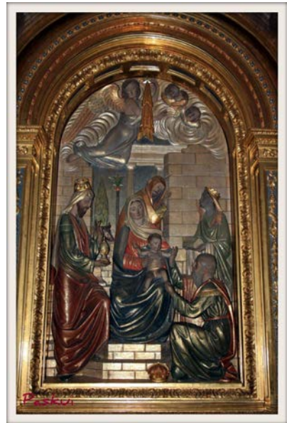
Fig. 9 La Adoración de los Reyes Magos.