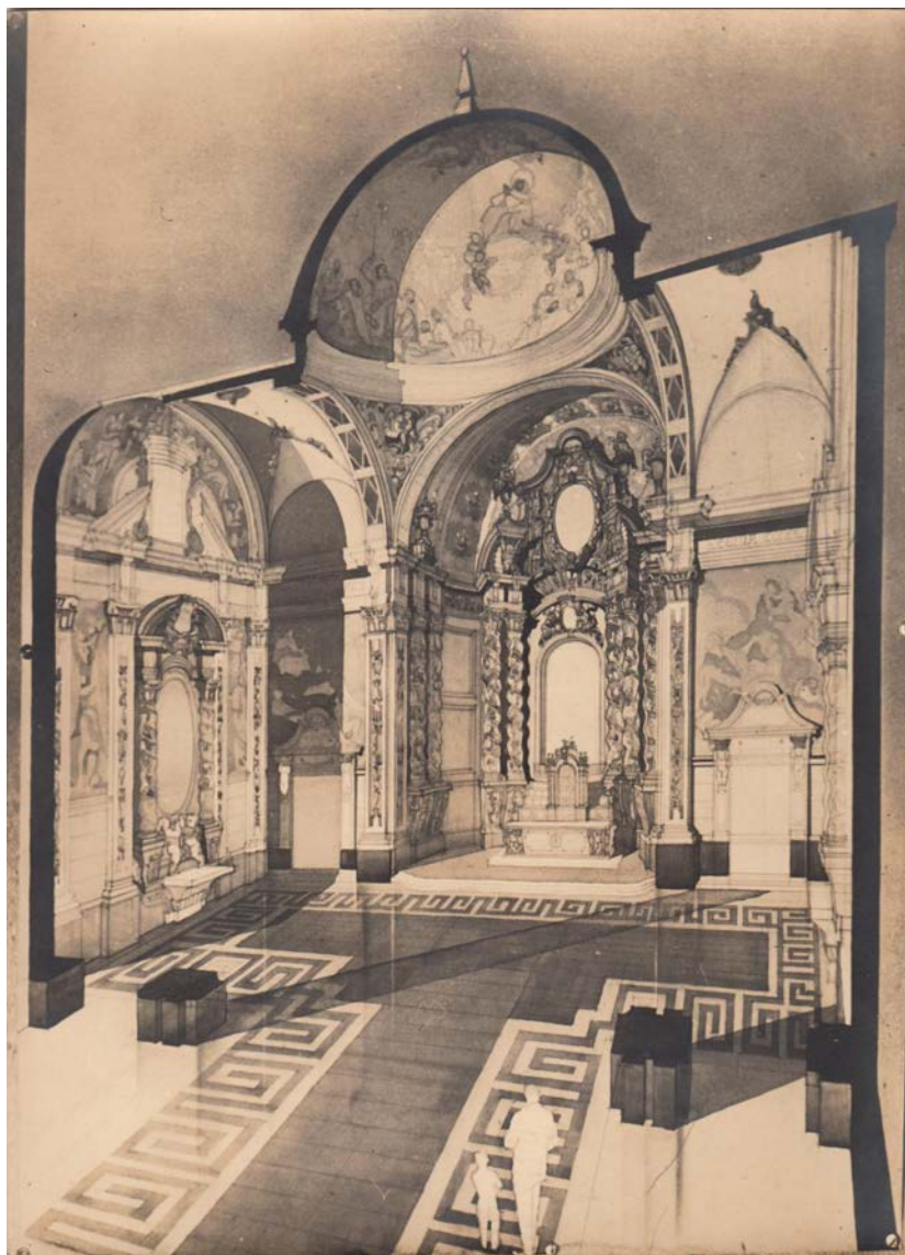
Fig.3. Alzado frontal del camarín y capillas del crucero del interior del Santuario de la Fuensanta.