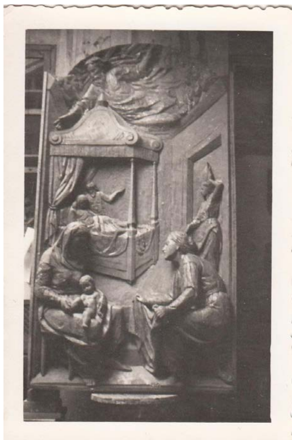
Fig.7. Nacimiento de la Virgen en burro .

Estos «arrepentimientos» también se pueden constatar en otras escenas. En la Adoración de los Reyes Magos, el artista diseña primero dos palmeras (fig.8), que asoman por cada una de las ventanas, quedando finalmente sólo una, en la ventana de la izquierda (fig.9). En realidad, sólo le hacía falta un árbol para simbolizar a Cristo y a la Iglesia, 28 quizás estudió cuál era el emplazamiento más adecuado para ello.