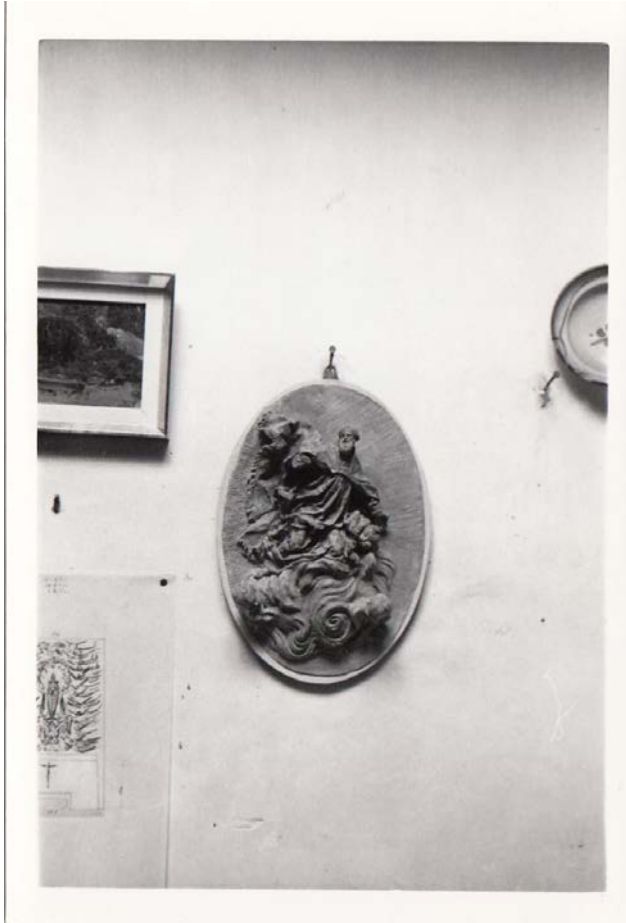
Fig. 10. Alto relieve del taller de Juan González Moreno.

Claustro del monasterio de Silos. También, hay altorrelieves elaborados por el autor, imitando los que hacía Salzillo, de estilo eminentemente barroco y, otros, más renacentistas.