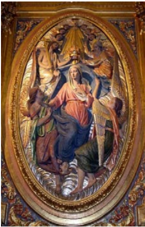
Fig.4. La Coronación de la Virgen María.

Las dos obras del crucero son las más grandes y están concebidas al modo de los tondos renacentistas, estilo muy presente en la obra del artista en esos años, y que traslada también a la ejecución de sus retratos, tal y como se puede constatar en su legado fotográfico. La Coronación de la Virgen (fig.4), aparece junto a la Santísima Trinidad y la Asunción (fig.5), dogma de fe consagrado en 1950, aunque en Murcia ya estaba representado desde un siglo antes en la Catedral. Las imágenes están impregnadas de esa mediterraneidad que caracteriza la obra civil de González Moreno, que empieza a atreverse a trasladar a su obra religiosa, con rasgos suaves y elegantes, alejados de la rotundidad del barroco. Algo que contrasta con la concepción barroca del edificio, siguiendo la estela de mayoría de iglesias religiosas de la capital. A pesar de que el escultor trabajaba tanto el alto relieve como el bajo relieve, prefirió utilizar aquí un modelado menos rotundo para las figuras; los ángeles, tan característicos de su obra, rodean la imagen de la Virgen, protegiéndola.