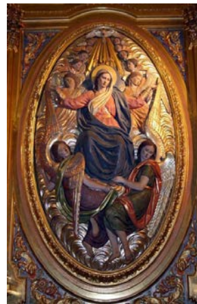
Fig. 5. La Asunción de la Virgen María.

No es la única vez que utiliza este recurso, en el conjunto escultórico que realizó para el complejo de Espinardo, en 1967, la Virgen, de bulto redondo, aparece