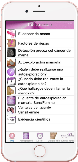
Figura 1. Interfaz de acceso a la aplicación.