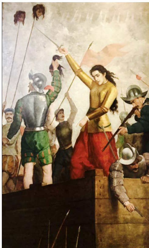
Ilustración 2. Doña Inés de Suarez en la defensa de la ciudad de Santiago. José Mercedes Ortega, 1897. Museo Histórico Nacional de Chile.