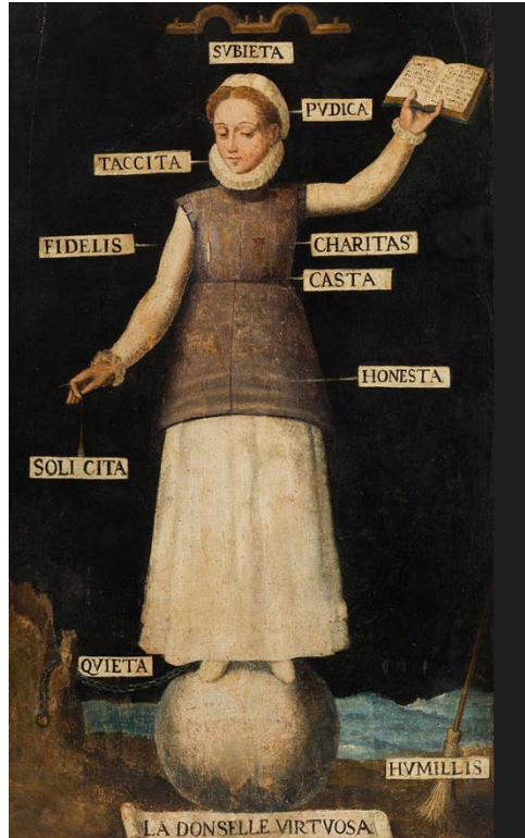
Citado según el museo. «La donzella virtuosa», https://barcelona.cat/museu-etnologic-culturesmon/ca/blog//la-donzella-virtuosa .

la reforma tridentina, tanto en Europa como en la América española 34 . Estos y otros tratados, fueron centrales para el traslado y consolidación de los modelos y roles de género femeninos vigentes en el denominado Nuevo Mundo, labor en que los monasterios femeninos tuvieron un papel destacado.