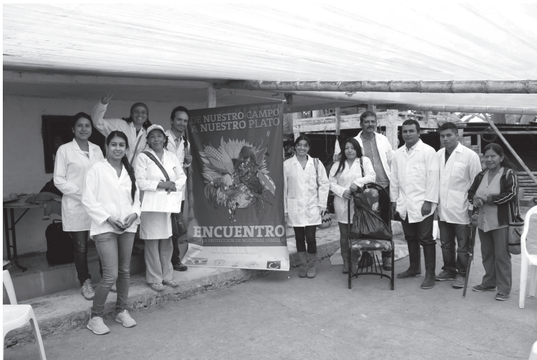
Foto 3. Afiche con la identidad visual del evento De nuestro campo a nuestro plato, utilizado posteriormente en encuentros para recolección de semillas de maíz y pruebas de contaminación transgénica.