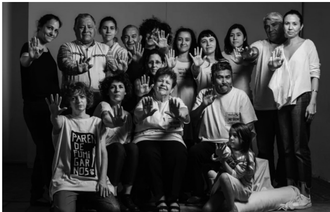
Foto 4. Campaña NO"OXONEC (Algodón de Frontera).

El activismo se plasma en varios aspectos del proyecto. Una de las principales cuestiones en donde se entretujan quienes participan del proceso, junto con diseñadores y artistas, es en el desarrollo de las dos colecciones cápsula que se desarrollaron haciendo uso de los tejidos agroecológicos para las prendas con la consigna "paren de fumigararnos" como estampa de protesta.