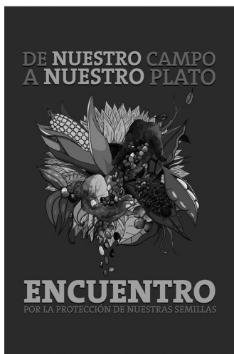
Foto 1. Identidad visual para el encuentro De nuestro campo a nuestro plato. Ilustración y diseño: Ángel Gabriel Andrade.

Desde el 2013, el nodo Cauca de la RGSV y los programas de Agroecología, Ingeniería Forestal y Diseño Gráfico de la Universidad del Cauca, iniciaron una experiencia dialógica para la creación de estrategias de carácter interdisciplinario, interinstitucional e intercomunitario con impacto regional, para promover la conservación de las semillas nativas, patrimonio 3 de las comunidades del territorio.