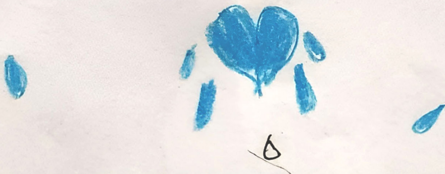
Imágenes 3, 4 y 5. Equipo Aire (2022).

me da tristeza cuando peliamos con mis amigas