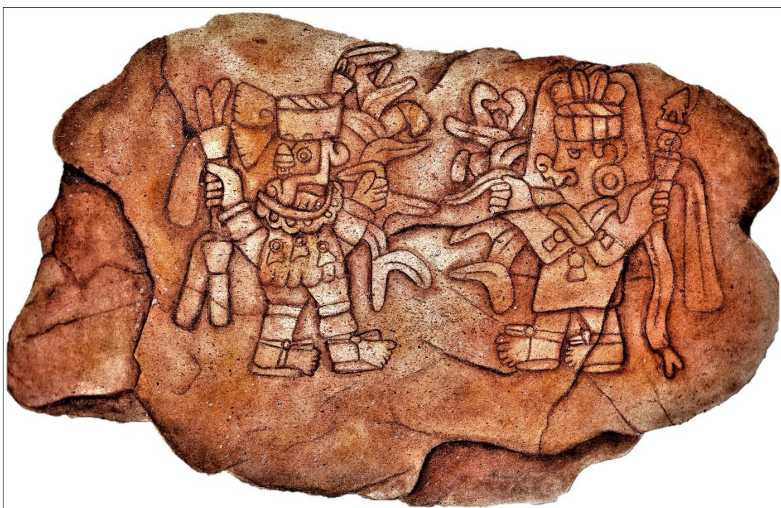
Figura 6. Representación de Tláloc y Chicomecóatl en el monumento 41 de Tetzapotitlan, también conocido como 'piedra del maíz'. Imagen tomada de Márquez Lorenzo (2021a).

Posteriormente a la ocupación territorial el desarrollo cultural de Tetzapotitlan fue permeado por un nuevo régimen, que lejos de sólo intervenir como mediador para la extracción de tributo se empeñó en hacer notar su presencia en las parafernalias rituales públicas (Márquez Lorenzo, 2017, 2020, 2021b). Esto explica la proliferación de númenes e imagería mexicas en las esculturas de Tetzapotitlan y otros sitios (figura 6), algunas de las cuales sirvieron para celebrar el Toxih molpilia de 1507, ceremonia efectuada cada 52 años (Márquez Lorenzo, 2012a, 2012b, 2015, 2017, 2020). Su pertinencia habría sido dada no sólo mediante un orden político sino social, a través de la juventud nacida y crecido bajo las nuevas manifestaciones culturales.