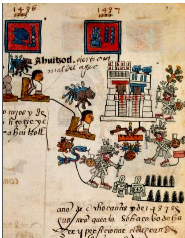
Figura 4. Construcción de fachada del Templo Mayor en 1487 a cargo de guerreros esclavos tetzapotecas, cuetlaxtecas y tziocoacas mazatecas (tének), quienes fueron sacrificados en su inauguración.

clara intención de atemorizar aún más a sus poblaciones sujetas al no discriminar entre la población para la manufactura de tzompantlis, lo cual se corresponde perfectamente con su estrategia política de dominación, más allá del significado religioso que se le pueda atribuir (Márquez Lorenzo, 2015a).