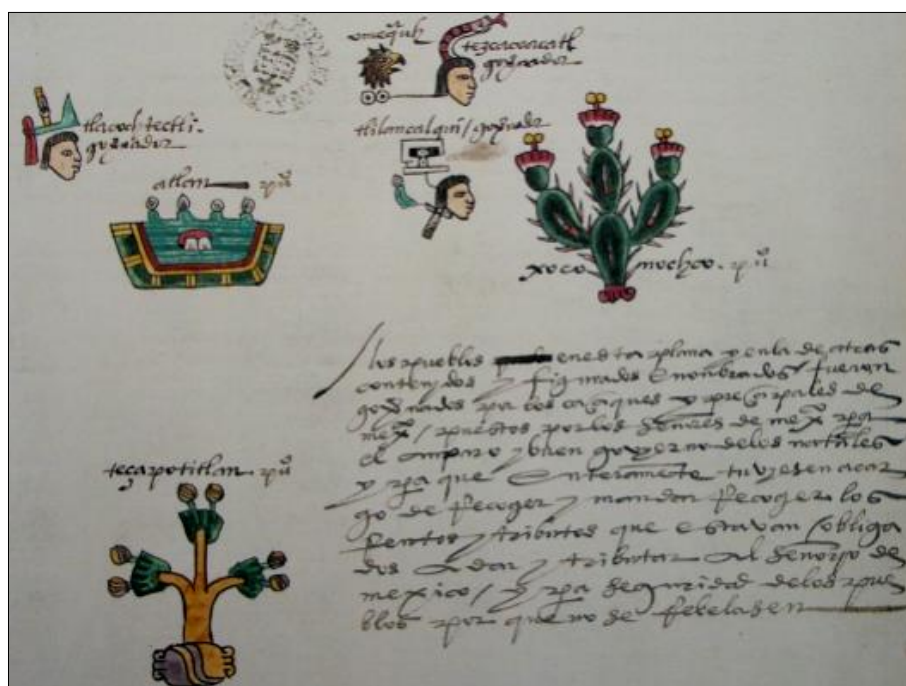
Figura 5. Instauración de gobernantes del Altiplano en las provincias de Atlan y Tetzapotitlan de acuerdo con el Códice Mendoza. Imagen tomada de Berdan & Anawalt (1992).

No obstante, la principal mano de obra explotada por la Triple Alianza no era la de los habitantes del Altiplano beneficiados con tierras en las provincias sujetas, pues recordemos que, en su mayoría, solamente ocurrieron instauraciones e imposiciones de un sector político en las localidades sin ocurrir movimientos poblacionales considerables, como sí ocurre en Tetzapotitlan (Márquez Lorenzo, 2020). En todo caso, el interés por el dominio de esta provincia sí tuvo un trasfondo económico, por ser éste el fin del expansionismo militar mexica.