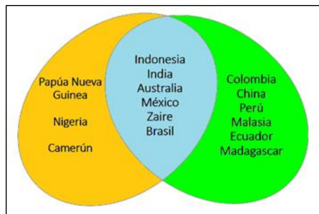
Figura 1. Países con alta diversidad cultural (amarillo) y biológica (verde). Países en el centro (azul) presentan gran diversidad biocultural. Modificado de Boege Schmidt (2008).

En la intersección de la figura 1 se presentan los países con alta diversidad biológica y cultural. Entre ellos se encuentra México, con aproximadamente 62 pueblos indígenas y 364 variantes lingüísticas (formas del habla con diferencias estructurales y léxicas, que implica una determinada identidad sociolingüística) (Cruz Murueta, López Binnqüist, & Neyra González, 2009; Toledo, Barrera-Bassols, & Boege Schmidt, 2008).