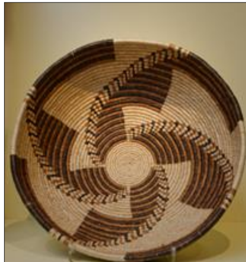
Figura 6. Corita, fibra de torote ( Jatropha cuneata ) teñida y tejida en espiral. Proveniente de Punta Chueca, Sonora.