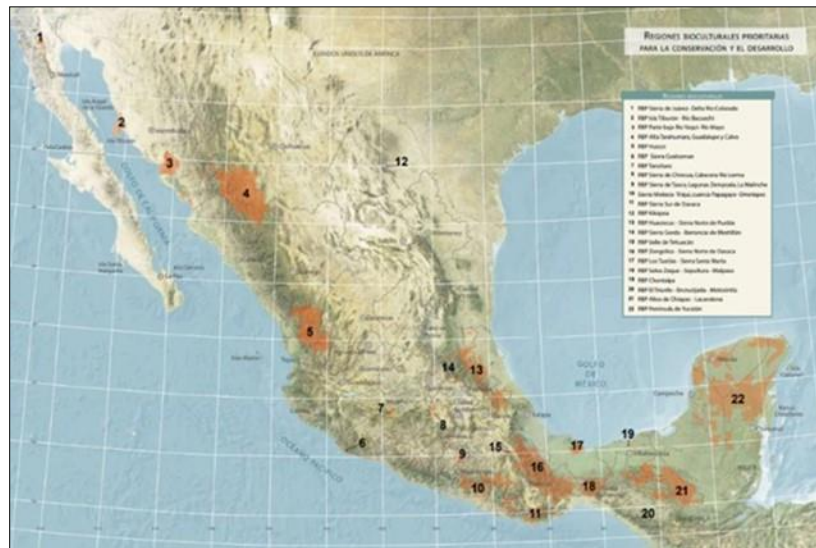
Figura 2. Regiones bioculturales prioritarias para la conservación y desarrollo en México. Tomado de Boege Schmidt (2008).

Por ejemplo, una de las zonas con mayor riqueza biológica en América del Norte es el Valle de Tehuacán, México. Esta es una región semiárida que ha sido denominada como Patrimonio de la Humanidad por la UNESCO, ya que cuenta con una riqueza biocultural excepcionalmente alta donde se hablan al menos 19 dialectos. Los conocimientos tradicionales de esta región comprenden información sobre cerca de 1,600 especies de plantas utilizadas por la población local para satisfacer sus necesidades de subsistencia y es reconocida como una de las áreas agrícolas más antiguas de las Américas. Las actividades principales de los pobladores de esta zona son la ganadería, la agricultura y el aprovechamiento de los productos forestales, usando métodos de producción con reminiscencias de prácticas ancestrales (Martínez Casas, 2018; Vallejo, Ramírez, Reyes-González, López-Sánchez, & Casas, 2019; Zarazúa-Carbajal et al., 2020).