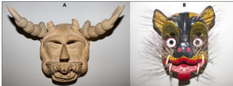
Figura 9. A. Diablo con serpiente al relieve. Autor: Luis Martínez Hinojosa. Madera de aile ( Alnus acuminata ) natural tallada. B. Máscara de jaguar. Madera ( Erythrina sp.) tallada y policromada.