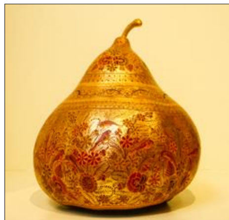
Figura 10. En el centro de la imagen se observa un tecomate ( Crescentia cujete ) laqueado, policromado y decorado con hoja de oro.