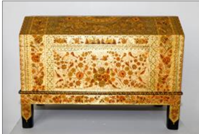
Figura 13. Baúl. Autor: Francisco Coronel Navarro. Madera de linaloe ( Bursera linanoe ) laqueada, con hoja de oro.

Por otro lado, algunos procesos artesanales deberían ser modificados para lograr un mejor aprovechamiento del recurso. Por ejemplo, las hojas de la palma dulce ( Brahea dulcis ) han sido ampliamente utilizadas para la creación de artesanías, objetos ornamentales, ofrendas y techos de viviendas. La distribución de la especie va del Norte del país (San Luis Potosí, Veracruz) hasta Guatemala. Sin embargo, el uso desmedido de la palma ha ocasionado problemas de escasez, por lo que los artesanos se han visto forzados a ampliar su zona de búsqueda y alejarse de sus localidades, incrementando los gastos de producción. Aunque no se cataloga como especie en riesgo, para su explotación sustentable sería necesario, por un lado, fomentar el uso de las hojas maduras y no del corazón, cortándolas en temporadas específicas y con métodos adecuados y, por otro lado, promover programas de reforestación en los terrenos propicios, con lo cual se lograría su recuperación y aprovechamiento sustentables (Cruz Murueta et al., 2009).