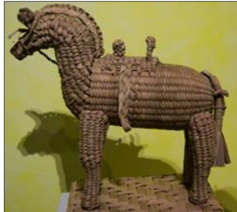
Figura 8. Caballo alcancía. Autora: María Elena Hernández. Elaborado y tejido a partir de tule de la laguna ( Typha sp.).