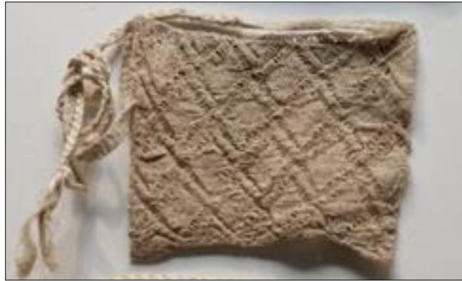
Figura 12. Morral tejido de henequén.

En términos generales, México cuenta con una amplia diversidad de arte popular. Según el Inventario de especies vegetales y animales de uso artesanal (Bravo-Marentes, 1999) en todo el país se utiliza un total de 666 especies distintas con este fin, 536 especies vegetales y 125 especies animales (tabla 1), destacando como entidades federativas Michoacán, Yucatán, Quintana Roo, Oaxaca, Chiapas y Sonora, en cuanto a concentración de especies para uso artesanal.