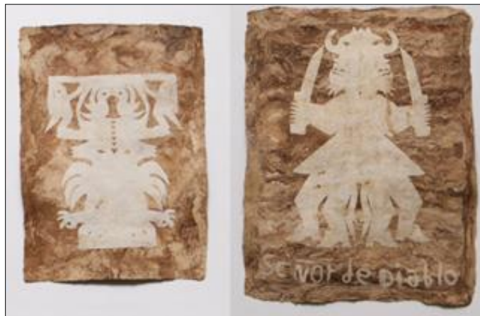
Figura 11. Amate. Autor: Humberto Trejo. Papel amate.

En el municipio de Chilapa, Guerrero se elaboran manteles o tapetes partiendo de cintas delgadas de hojas de palma sollate ( Brahea dulcis ) que se trenzan y tejen; también son usadas para hacer sombreros, portavasos, bolsas, cestos, sopladores o joyería de la misma palma. En San Pablito Pahuatlán, Puebla se elabora el papel amate, una artesanía nahuátl elaborada desde la época prehispánica, que consiste en un papel grueso de color generalmente café y se realiza aplastando la corteza de los árboles jonotes rojo y blanco ( Ficus cotinifolia y F. padifolia ), para cocerse con cal y obtenerse una lámina fibrosa que queda en manos del artesano para decorarlo según su imaginación y creatividad; generalmente con flores, animales, paisajes o anécdotas de la vida cotidiana (figura 11) (Coronel & Pulido, 2011; Gual Díaz, 2018).