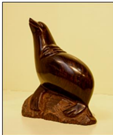
Figura 4. Foca, escultura en palo fierro ( Olneya tesota ).

Los artesanos utilizan alrededor de 5,000 toneladas de madera al año. La usan dado que se trata de una madera dura, de hebra rectilínea, que no tiene poros ni vetas; por lo que no le penetra la humedad. Desafortunadamente se empezaron a fabricar imitaciones de piezas, lo que empezó a generar el mal uso y manejo del palo fierro, ya que los árboles vivos se talaban para realizar la talla de las piezas. Además, en 1992 se registró que más de 21,000 toneladas de palo fierro se usaron para la obtención de carbón; de hecho, 90% del carbón exportado a EE. UU. proviene de Sonora, y de esta cantidad 25% proviene de árboles jóvenes de palo fierro. Actualmente, la conservación del palo fierro presenta algunos desafíos; por un lado, se emplea como leña, y por otro lado, en la región se han transformado las zonas de desierto en pastizales con fines ganaderos. En los últimos años, debido a la escasez de palo fierro, la comunidad seri comenzó a usar la talla a partir de palo blanco ( Acacia willardiana ), concha nácar ( Pictada sp. y Pteria sp.) y coral negro ( Antipathes sp.) (Gual Díaz, 2018).