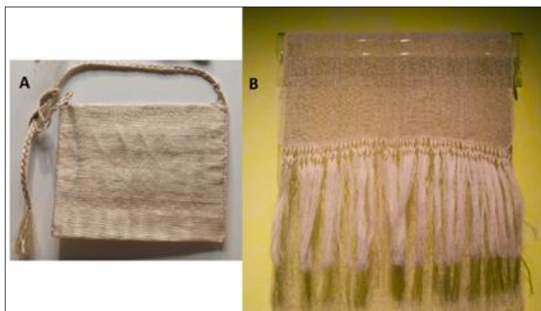
Figura 7. A. Morrill tejido de ixtle (A. lechuguilla). B. Rebozo tejido de ixtle (A. lechuguilla).

En Michoacán el pino lacio ( Pinus devoniana ) es utilizado para la manufactura de cofres, joyeros y servilleteros. Otros recursos maderables, como el cirimo ( Tilia americana ) y el pinabete ( Abies religiosa ) son empleados para la obtención de cubiertos, bandejas y molinos, a los cuales se les da forma mediante un torno. El tule ( Typha sp.), por su parte, se usa para elaborar cestos, muebles, manteles, bolsos, tapetes, tortilleros y figuras de diferentes especies de su entorno (figura 8). Las maderas de aile ( Alnus acuminata ) o colorín ( Erythrina sp.) son utilizadas para manufacturar máscaras que por su suavidad facilitan el trabajo (figura 9); también son utilizadas las jícaras y tecomates ( Crescentia alata y C. cujete ), que mediante el arte de maque son acondicionadas y decoradas (figura 10).