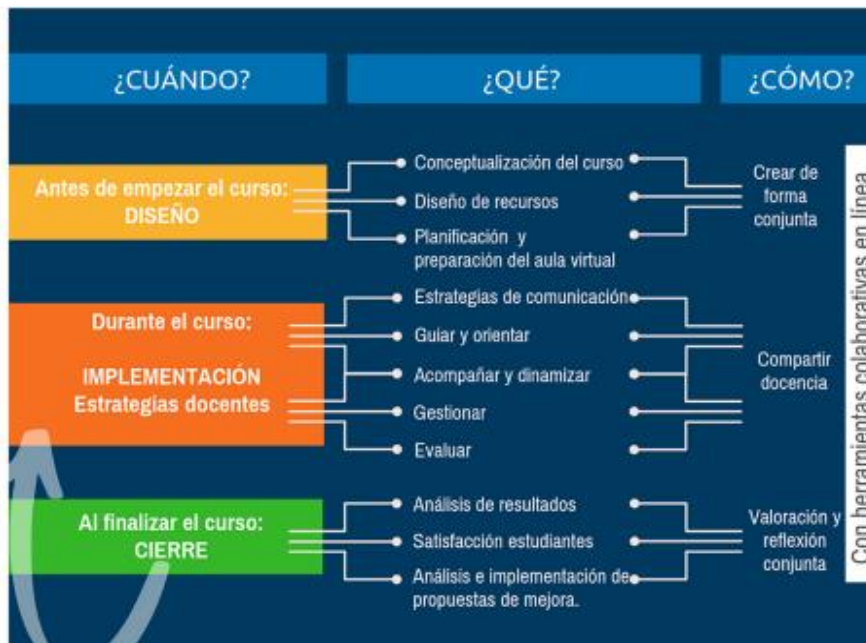
Figura 1. Estrategias docentes en línea: ¿cuándo?, ¿qué? y ¿cómo?

En el artículo “Estrategias para la docencia en línea”, se habla del nuevo rol del docente, que tiene que adquirir en la era digital; de acuerdo con este, el docente adquiere un rol y se enuncian algunas de las funciones que el profesor debe proporcionar como guía y orientador del proceso de aprendizaje de los estudiantes. Las tecnologías, además del acceso a la información, también facilitan procesos de comunicación, colaboración y creación de contenidos, lo que propicia que el trabajo del docente se acerque más al acompañamiento y la dinamización (Catasús Guitert y Fontanillas Romeu,).